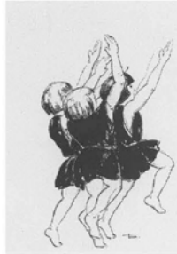
Abb. 11 Duncanschülerinnen karikiert von Dani. (Bachrušin Theatermuseum, Moskau)

sowjetischen Trend der Zeit: 52 » [...] personally, I would have preferred boys, for they are better able to express the heroism of which we have so much need in this age.« 53