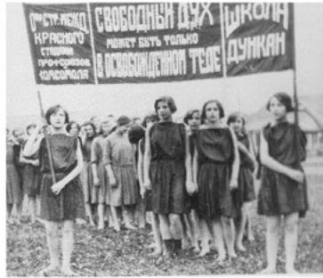
Abb. 12 Abschluss und Beginn der Übungen bestand in einem gemeinsamen Marsch.