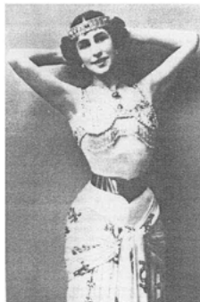
Abb. 4 Matil' da Kšesinskaja in der »Bajadere« ca. 1898.

selben Lehrern gelernt hatten, Welten lagen. 70 Die Pavlova und Koesinskaja waren Tänzerinnen aus zwei verschiedenen Epochen. 71