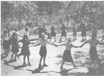
Abb. 13 Wohlgeordnete Volkstänze Ende der 20er Jahre.

Ehemalige Bewunderer begannen sich zu fragen, ob Duncans Tanz nun gestorben sei. 60 Andere wiederum stellten geradezu erfreut fest, dass Duncan nun nicht mehr Tanz, sondern die neue sowjetische Körperkultur betrieb. Davon, so argumentierten sie, könnten die Arbeiterkinder noch viel lernen. 61 Mit dem Tenor dieser Bemerkungen korrespondieren Berichte, in denen die Rede vom Verschwinden des Körpers in den offiziellen Inszenierungen war. Durch die Körperkontrolle, die in den sowjetischen Ritualen den Beteiligten abverlangt wurde, schien der Körper verdrängt zu werden. Dabei war es nicht der Körper an sich, der hier aus dem Blick geriet, sondern nur der Körper in unkontrollierter, ekstatischer oder organischer Bewegung. Zu sehen waren dagegen wohlgeordnete, streng kontrollierte und genau koordinierte Körper in militarisierten Paraden, in Massenschören und -gymnastiken. 62