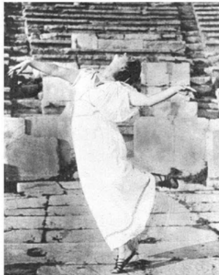
Abb. 8 Duncan 1903 im Theater des Dionysos. (D. Duncan: Life into Art , S. 57)

Duncan war ganz im Trend der Zeit, wenn sie die Zukunft im antiken Griechenland sah. Um sie in ihren Tänzen zur Erscheinung zu bringen, nahm sie Abbildungen rasender Mänaden auf antiken Vasen zum Vorbild. Und das Ergebnis ließ sich sehen.