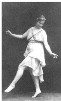
Abb. 3 Duncan 1903 in einer Pose aus »Narziss«, Chopin op. 64, Nr. 2. (D. Duncan: Life into Art, S. 68)

Hatten bis 1899 noch rosa Strumpfhosen und Tanzschlappchen Isadora Duncans Beine geziert, so waren Beine und Füße jetzt nackt. Ihre Arme waren unverhüllt, der Körper vom Korsett befreit. Doch sie hatte nicht alle Hüllen fallen lassen. Eine leichte Tunika umgab noch ihren bloßen Körper. 1