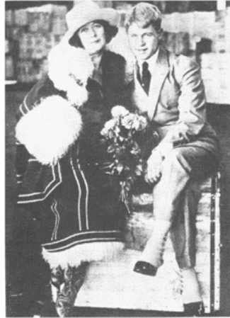
Abb. 9 Während Duncan sich 1922/23, unterwegs in Europa, in ein russisches Phantasiekostüm hüllte, inszenierte Esenin sich als Dandy.

von »primitiven Jazztänzen«, deren Rhythmen unterhalb die Gürtellinie zielen und in denen sich die Menschen nur in »sabbernden, affen-ähnlichen Konvulsionen« verrenken würden. 22