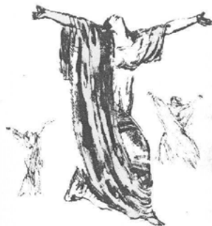
Abb. 10 Eine Zeichnung von Léon Bakst zeigt Duncan zur Revolutionshymne tanzend. (T. Kasatkina: Ajsedora, S. 102)

Lenin soll bei Duncans Auftritt persönlich anwesend gewesen sein und diesen ausgiebig beklatscht haben. 31 Glaubt man den Quellen, dann stellte das Programm ein Wagnis dar, da Duncan als erste öffentlich zur offiziellen Hymne der Revolution tanzte. Später wurden Tänze zu Revolutionsliedern als sogenannte »Revolutionstänze« fester Bestandteil der sowjetischen Feste. 32