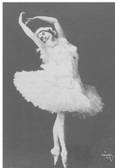
Abb. 5 Anna Pavlova ca. 1908 im »Sterbenden Schwan«.

Doch was hatte Duncan der zukünftigen russischen Ballerinnengeneration mit auf den Weg gegeben? Anhand dieser Photographien und einer der Pavlova gewidmeten Beschreibung von Krasovskaja lassen sich zwar keine Rückschlüsse ziehen, aber zumindest erahnen, wie diese von Duncan beeinflusst war: »Ihr Körper wird zunehmend freier und biegsamer, die Falten ihres Kostüms passen sich den Körperbewegungen an« heißt es hier. Fast siebzig Jahre früher hieß es bei Belyj über Duncan: »Die Falten ihrer Tunika, genau rauschend, schlugen sprudelnde Fluten, als sie sich dem freien und reinen Tanz hingab.« 72 Versinnbildlicht in der Falte des Kostüms war es die Freiheit der Bewegung, die Duncan aufgeschlossenen Anhängern des Balletts eröffnete. Duncan hatte mit ihrer Tunika und ihren bloßen Füßen nicht nur die Tanzkleidung revolutioniert. Indem sie das Kostüm der Tänzerin von bewegungseinschränkenden Details wie dem Spitzenschuh oder dem Korsett befreit hatte, ermöglichte sie auch dem Körper eine größere Bewegungsfreiheit. Und dabei war das Kostüm stets Teil der Bewegung und wie der ganze Körper in ständigem Fluss und ständiger Veränderung begriffen.