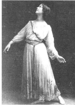
Abb. 2 Duncans Einsatz der Hände, hier in ihrer Orpheuschoreographie ca. 1903/04, konnte man auch in Russland auf den Postkarten des Münchner Photostudios Elvira bewundern.

Und wieder deutete – im wahrsten Sinne des Wortes – ihm Isadora Duncan den Ausweg aus der Krise. Anhand ihrer Handgeste zeichnete er das Bild eines ursprünglichen, idealen Körperzustandes: Duncans Hand war für ihn ein Organ des seelischen Ausdrucks und keine tote Extremität. 46 Duncan – das war für ihn der beseelte Körper, in dem sich die Dichotomie zwischen Seele und Körper sprichwörtlich aufhob. 47