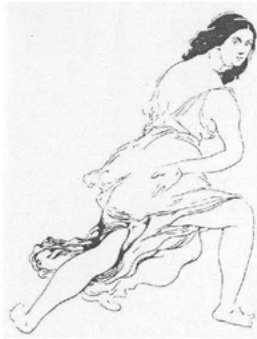
Abb. 7 Duncans Wirken zwischen Wiederbelebung und Dilettantismus karikiert von Bakst. (T. Kasatkina: Ajsedora, S. 222)

zuschauen. Jede von Natur aus einigermaßen graziöse Frau könne à la Duncan tanzen. Aber sollte Duncan doch einmal versuchen, die Technik bis zur Vollendung russischer Tänzerinnen zu erreichen. 82