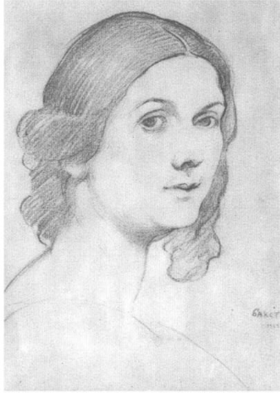
Abb. 1 Isadora Duncan 1908 »zurück in die Zukunft« blickend, portraitiert von dem russischen Bühnen- und Kostümbildner Léon Bakst. (Puschkin Museum für bildende Künste, Moskau)