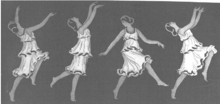
Abb. 6 Duncan in Glucks »Iphigenie in Aulis« gezeichnet 1910 von Michail Dobrov. (Bachrušin Theatrumuseum, Moskau)

– erweiterte sie vor allem das Vokabular der Oberkörper-, Kopf- und Armbewegungen, deren Wirkung sie durch das bewusste Spiel mit dem Körpergewicht unterstützte. Doch anders als das Ballett besaß ihr Tanz kein reiches Vokabular. Ihr Körper bewegte sich immer als Ganzes. Torso und Hüften waren scheinbar problemlos integriert. Bewegung und Gestik waren nie isoliert. Sie waren immer verwoben in den Fluss des Tanzes. 73