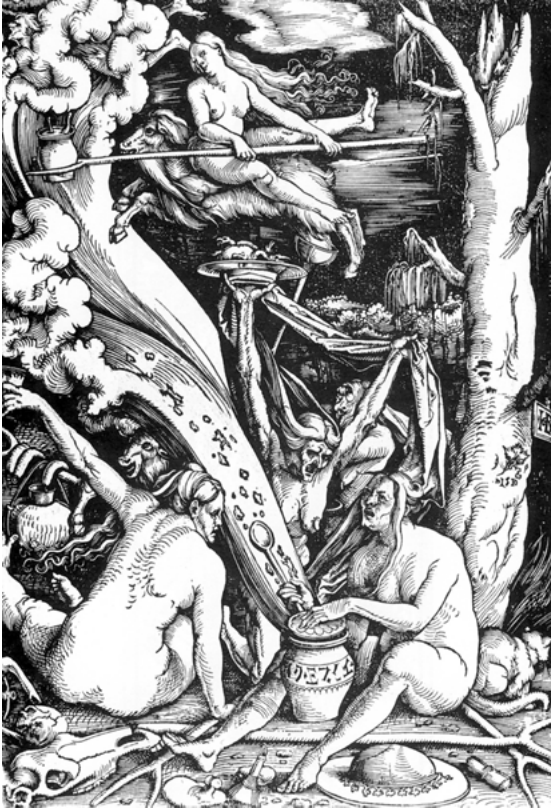
Abb. 2: Hans Baldung Grien: Die Hexen, 1510

Hans Baldung Griens Holzschnitt hat alle Zutaten des Genres: Ein frevelhafter Ort im Wald. Unter dem unfruchtbaren Baum hockt die Katze. Dem Hexenkessel entströmen u.a. Reptilien. Links hängen ›abgehexte männliche ›Schamglieder‹ wie Würstchen über dem Kochfeuer.