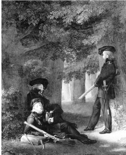
Abb. 15: Georg Friedrich Kersting: Auf Vorposten , 1815

Eine andere Ikone der »Freiheitskriege ist Georg Friedrich Kerstings »Auf Vorposten«. Er zeigt den Eichenwald »tatsächlich im Kleist'schen Sinne« als »Kombattanten des deutschen Widerstandes« gegen Frankreich/Napoleon. Der Wald »deckt« die Freikorpsler der »Lützower Jä-