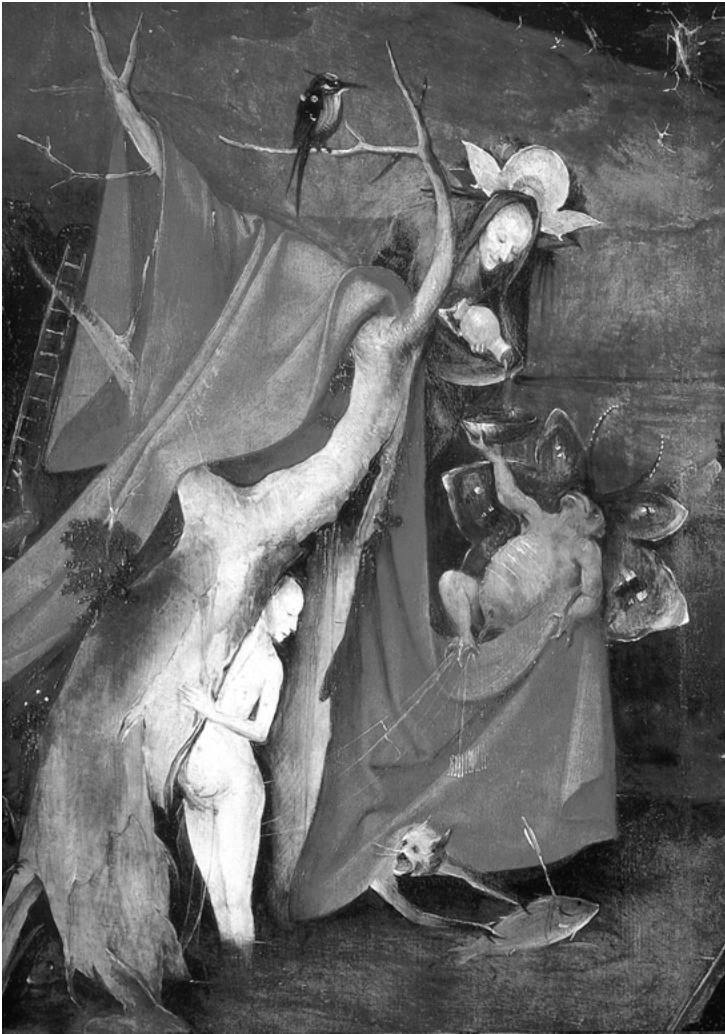
Abb. 1: Hieronymus Bosch: Die Versuchung des heiligen Antonius (Detail des rechten Innenflügels), um 1500