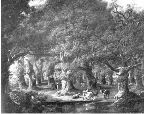
Abb. 13: Pascha Weitsch: Eichenwald bei Querum mit Selbstbildnis, 1800

Weitschs Varianten des »Eichenwalds bei Querum« (das erste Gemälde entsteht 1784) konstruieren also »Heilige Haine«, »Waldesdome«, die zugleich das Wissen um deren agrarische Nutzung dokumentieren. Sie stellen den »Höhepunkt« der Tendenz seit den 1780er Jahren dar, »die Eichbäume immer mächtiger und urtümlicher zu gestalten«. Die Wipfel des »mächtigen, urwelthaftigen Eichenwaldes« wölben sich sozusagen über dem Betrachter. Die »riesigen, zerklüfteten Stämme« sind nahezu symmetrisch angeordnet, zentriert auf »die mittlere, stärkste Eiche«. Allegorie aufs »Vaterland« (und zugleich anscheinend aufs Herzogtum Braunschweig), geprägt von Klopstocks »Hermansschlacht«. 805 »Du