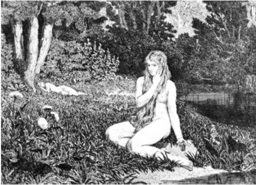
Abb. 3: Max Klinger: Eva und die Zukunft; Blatt 1: Eva, 1880

Auch Klingers »Eva« passt zum zeitgenössischen Diskurs um die »matriarchalischen Sümpfe«. Die Frau als »Hauptfigur des Sündenfalls« kauert »sinnend am Ufer des Teiches« im »jungfräulichen« Wald, während Adam noch unterm Baum schläft. Sie verführt ihn, wird – bei Klinger – »aber nach der Vertreibung aus dem Paradies seine Beute« 348 – »selbstgewollt und selbstverschuldet«. 349