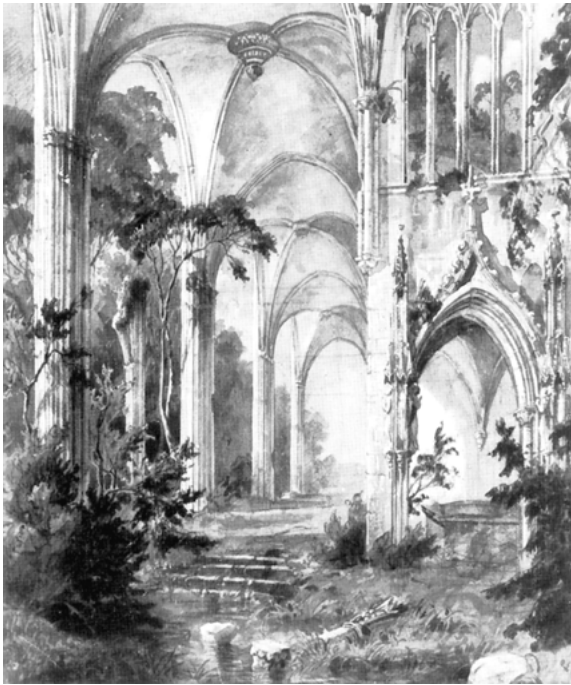
Abb. 18: Karl Blechen: »Gotische Kirchenruine«, um 1830

Im romantischen Landschaftsgarten kommt es programmatisch zum Bruch mit der »Harmonie« einer aufgeklärten »vernünftigen Natur«, bzw. einer Harmonie, wie sie der Landschaft noch von Herder zugeschrieben wird. »Das verweist darauf, daß die Romantik in einer Suche nach der sinnstiftenden »ganzen Natur« letztlich von einem Bewußtsein der Vergeblichkeit der Sinnsuche und der »Zerrissenheit« des Menschen beherrscht ist«, meint Siegmund unter Hinweis auf die romantische Landschaft und ihre »untrennbare Verbindung mit dem Innern, den Gefühlen des Menschen«. 255 Die Genese des »Schauerblicks« der Romantik, »der Melancholie und Schrecken« vereint, ist zurückzuführen aufs Erhabenheitskonzept der Aufklärung. Anders als hier, wo der »Schwindelblick« ausgehalten werden muss, um »die sinnlich wahrnehmbare