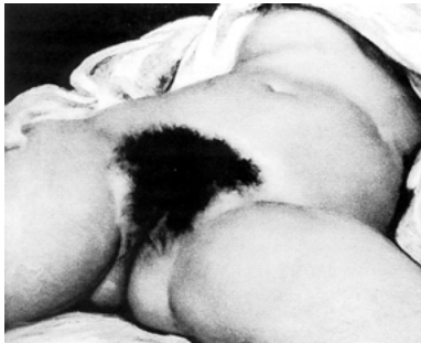
Abb. 4: Gustave Courbet: Der Ursprung der Welt, 1866

Es scheint klar, worauf das hinausläuft: auf das Bild vom »Ursprung der Welt« (1866), den nackten Unterleibstorso, der sich analog als Landschaft beschreiben lässt. Und in ähnlicher Weise auf die »Frau mit den weißen Strümpfen« (1861). Metken zitiert eine Bemerkung Jack Lindseys zu diesem ebenfalls »um die Vagina zentrierten Werk«: Würden Bildkomposition und Anordnung beibehalten und in einer Skizze »die menschlichen Partien in Felsen, Gebüsch« usw. umgewandelt, käme eine Courbet-typische Landschaft heraus. »Die Vagina bildet den Ein-