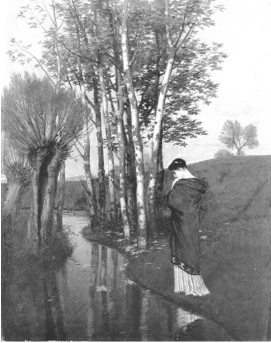
Abb. 21: Arnold Böcklin: Herbstgedanken, 1886

Der zweite Typ aktuell dominierender Wunschlandschaften, Kennzeichen der Entmischung und ökologische Variante bzw. Weiterentwicklung des Landschaftsgartens, Vor-Bild der ›Renaturierungen‹ von Bachläufen. Birken und Kopfwald sorgen für ein ›stimmungsvolles‹ Ambiente – und sind ›standorttypisch‹. Zudem gelten Kopfwald als wertvolle ›ökologische Nischen‹. Gleichzeitig sind sie in dieser Weise ihrer ehemaligen Zugehörigkeit zum Arbeits-Alltag (Niederwald-Wirtschaft) entzogen. Im Gegensatz zum klassischen Landschaftsgarten – auch dafür steht die Kopfwald – aber ist hier die Sichtbarkeit des permanenten formgebenden Eingriffs notwendig, muss doch offenbar auch weiterhin ein ›eigensinniges Wuchern‹ (die Bedrohung der ›zweiten Natur‹ durch die ›erste‹) nicht nur verhindert, sondern dieses auch demonstriert werden.