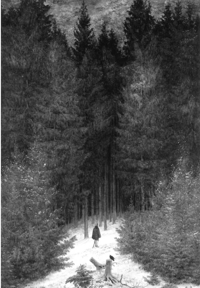
Abb. 14: Caspar David Friedrich: Der Chasseur im Walde, 1813

»Lust und Ergötzung« hervor. Das streng Geregelte ist das Soldatische unter dem Banner der nationalen Idee: »Im frühen 19. Jahrhundert wurden die Neubegründungen von Wald und Staat im Zusammenhang gesehen. Man forstete als Maßnahme des mehr oder weniger stillen Widerstandes gegen Frankreich.« 823