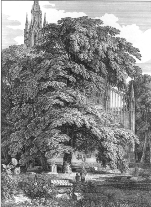
Abb. 17: Karl Friedrich Schinkel: »Dom hinter Bäumen«, 1810

Diese »Größe« scheint 1815 (»Mittelalterliche Stadt an einem Fluß«) dann schon näher zu sein. Ist vorher die Kirche nur teilweise durchs Laub zu sehen, so lässt Schinkel sie jetzt in voller Pracht aus einem waldigen Hügel emporwachsen, ihre Turmspitzen einen Regenbogen berühren. Unten, am Fuß der Kathedrale eilen Menschen heran, die sich zu einem mächtigen Zug formieren. 207