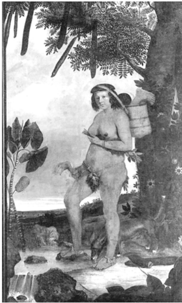
Abb. 6: Albert Eckhout: Tapuya-Frau , 1641

Töten, Grillen, Kochen: Im Zentrum der Konstruktionen von Hexen und Kannibalinne steht »die Verflüssigung der Körper« ihrer Opfer. 506 Im »Hexenhammer« sind es vor allem Hebammen, aber auch andere alte und ökonomisch selbständige Frauen, 507 die besonders ungetaufte, aber auch getaufte Kinder ohne Kreuz in der Wiege töten und stehlen. Diese