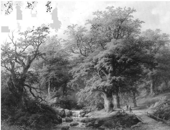
Abb. 20: Johann Bernhard Klombeck: Waldlandschaft mit Figuren auf einem Weg an einem Bach, 1860

Eine der aktuell dominierenden »Wunschlandschaften«: »partielle Wildnis« innerhalb einer als solche jederzeit erkennbaren »wohlgeordneten« Kulturlandschaft. Das Vor-Bild entstammt einer romantischen Landschaftsmalerei, die rein auf das »Gefühl« abzielt. 34