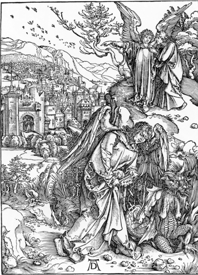
Abb. 8: Albrecht Dürer: Die Einlochung Satans und die Weisung der Hl. Stadt (Apk. 20, 1 3; 21, 1-2 und 9-14), 1496-1498

Die Wahrnehmung der (Groß-)Stadt als Dschungel, Wildnis, feminierte Fremde in scharfem Gegensatz zur geordneten, heimatlichen Landschaft – jetzt umgekehrter Stadt-Land-Gegensatz – setzt systematisch erst im späten 19. Jahrhundert ein. Allerdings gibt es hier Vorläufer. Albrecht Dürer lässt die Wildnis in die Stadt eindringen, im Schlussbild seiner »Johannes-Apokalypse« (1496/98). Das Heilsinstitut kann auch zugrunde gerichtet sein. Diese Stadt – wahrlich kein »Jerusalem« –