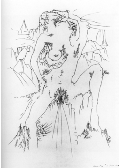
Abb. 5: André Masson: La Cascade , 1938

fruchtbare Weide« ins Bild. Hier übersetzt in unbewusste, sich ziellos verzweigende Zeichen, die in sumpfigen Untergründen entstehen.