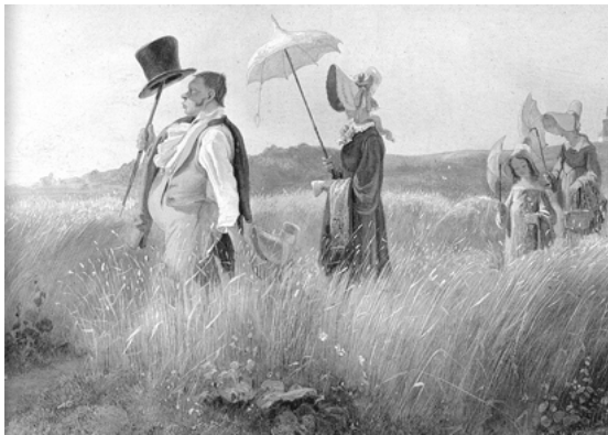
Abb. 19: Carl Spitzweg: Der Sonntagsspaziergang, 1841

Gudrun M. König schildert die zeitgenössischen Konzepte des bürgerlichen Spaziergangs in »freye[r] Natur« als »Akte[e] moralischer Reinigung« und Aufsuchen von »Gegenbild[ern] zur einzwängenden Stadt«, zur dortigen Entfremdung, zur »Unwirtlichkeit der Zivilisation«. Auch damals gilt das ästhetische Interesse der »mannigfaltige[n] und schöne[n] Natur«, in der unterschiedliche Orte angetroffen werden sollen, denen »eine je eigene Erlebnisqualität und Erkenntnis« zustehe. So wird nach Feldern als Bildern »des menschlichen Kunstfleißes« und einer darauf gründenden Zukunftshoffnung verlangt, nach Wiesen, um »ein Gefühl ruhiger Gleichmut und stiller Zufriedenheit« zu erzeugen, Wäldern, die es gestatten, »ohne alle Störung unserer selbst und der Natur zu sein«. Diese »Annäherung des bürgerlich-städtischen Spaziergängers an die »Natur«« trage nahezu »mystische Züge«, sei als ästhetische Erfahrung Ersatz religiöser Praxis und werde »Teil seiner Orientierung in einer säkularisierten Welt«. Die »freye Natur« ist alles Nicht-Urbane, aber Kultivierte, dem zugleich mit städtischer Distanz begegnet wird,