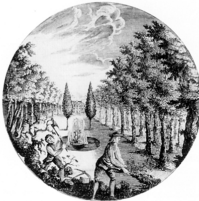
Abb. 10: Stich aus: William Boutcher: A Treatise on Forest-Trees, 1775

Der Forst ist ›männliche‹ Maschine, dient der Produktion und repräsentiert sie, ist schmucklos, aber monumental, der Garten ›weibliche‹ Maschine, dient der ›bloßen‹ Repräsentation, dem Schmuck, dem Plai-