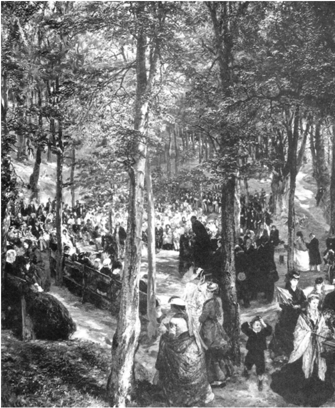
Abb. 16: Adolph Menzel: Missionsgottesdienst in der Buchenhalle bei Bad Kösen, 1868

Der Wald als Kirche. »Waldesdom«, »Buchendom«, »Lindendom« (im Frühneuhochdeutschen bezeichnet ›Linde‹ »sowohl einen heiligen Hain als auch den Lindenbaum«), 55 »Heilige Hallen«. Derartige Bezeichnungen des Waldes (nicht zu verwechseln mit antiken oder archaischen »Heiligen Hainen«) sind offenbar erst seit dem späten 18. Jahrhundert geläufig, als einfache ›Hallen‹ oder ›Gewölbe«, 56 die aber ihre Weihung