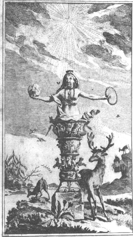
Abb. 9: Titelbild zu Linnés „Fauna Svecica“, 1746

Die ehemals autonome Natur reproduziert nur noch. Nichts anderes ist mehr möglich. Die ›Herrin der Tiere‹ und der Vegetation streift nicht mehr umher nach eigenem Willen. Sie ist gefangen. Im Blumentopf. Sklavin des kultivierenden Gärtners. Des Demiurgen, der vorgefundenes Material zum Kunstwerk gestaltet. Und nur in dieser Gestalt ist das vorgefundene Material statthaft, ist Natur akzeptiert. Auch die ›Herrin der Natur‹ ist vorgefundenes Material; auf der Ebene des zu transformierenden Sinnbilds. Das gebändigte Schrecknis wird zum Spiegel der Erhabenheit des Bändigers. Der hält sie ebenso gefangen in seiner Erkenntnis ihrer Gesetze. Indem er so ihr Geheimnis enttarnt, unterwirft er sie seinem Willen.