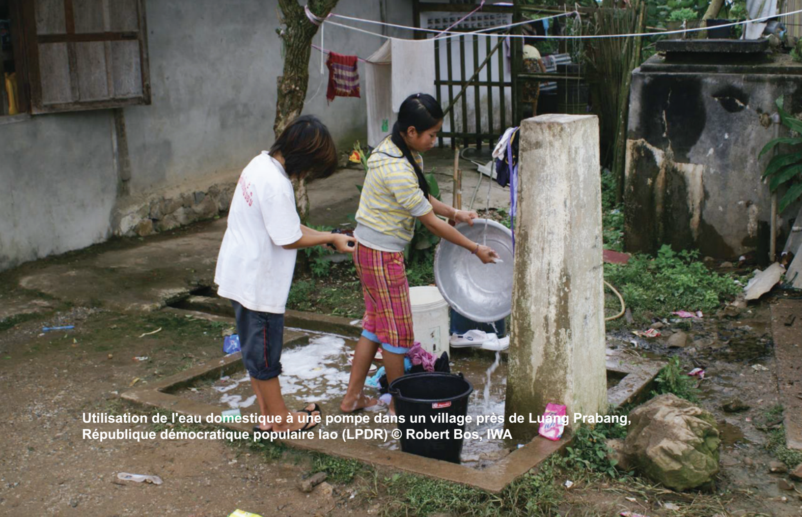
Utilisation de l'eau domestique à une pompe dans un village près de Luang Prabang, République démocratique populaire lao (LPDR)