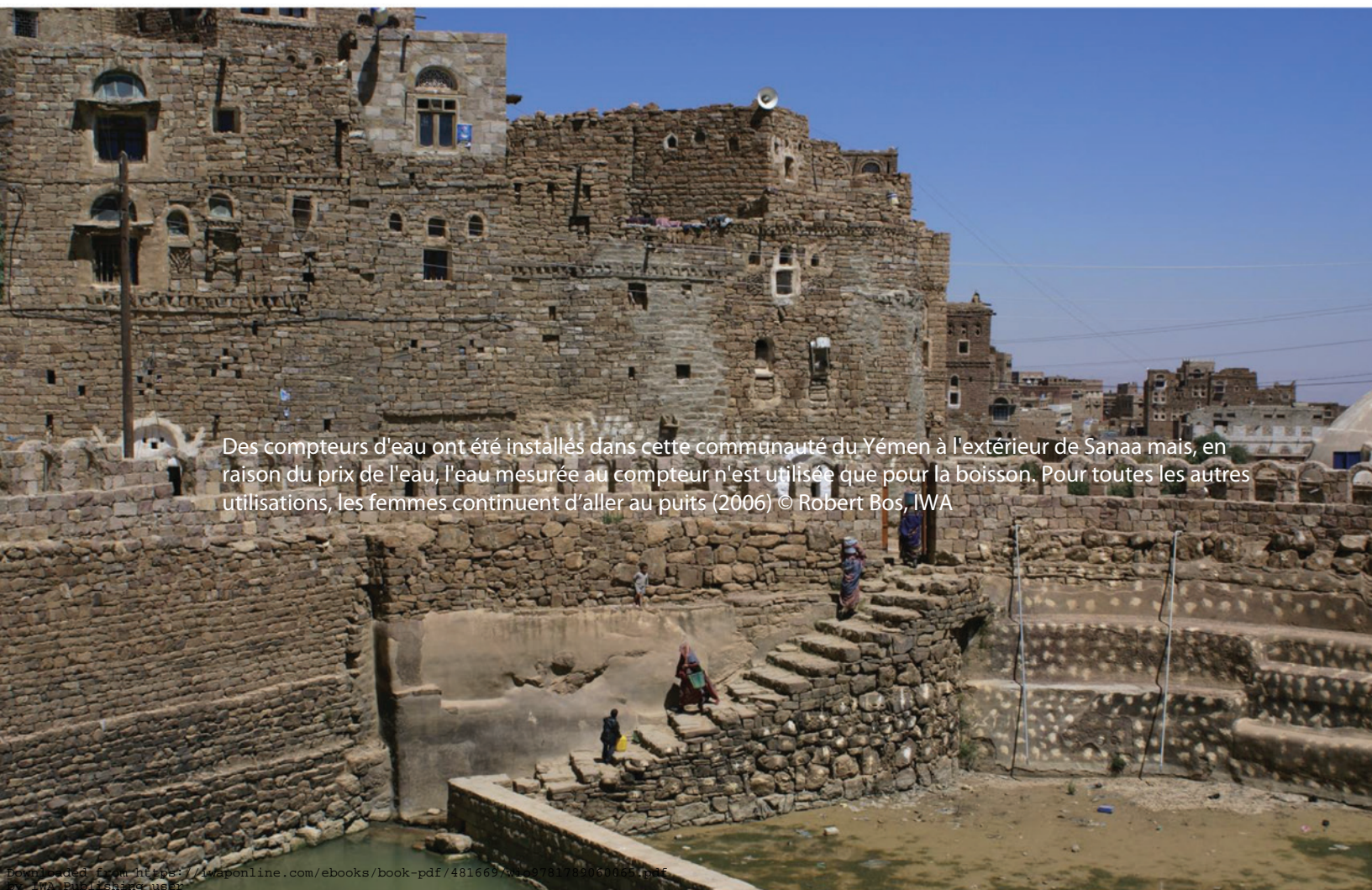
Des compteurs d'eau ont été installés dans cette communauté du Yémen à l'extérieur de Sanaa mais, en raison du prix de l'eau, l'eau mesurée au compteur n'est utilisée que pour la boisson. Pour toutes les autres utilisations, les femmes continuent d'aller au puits (2006)