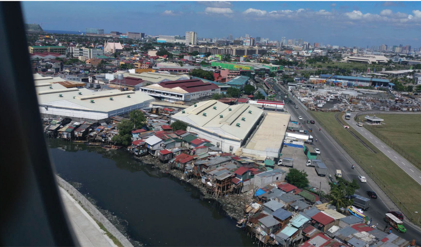
Manille, Philippines