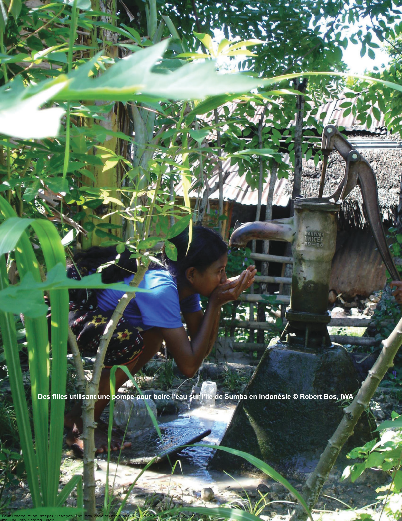
Des filles utilisant une pompe pour boire l'eau sur l'île de Sumba en Indonésie