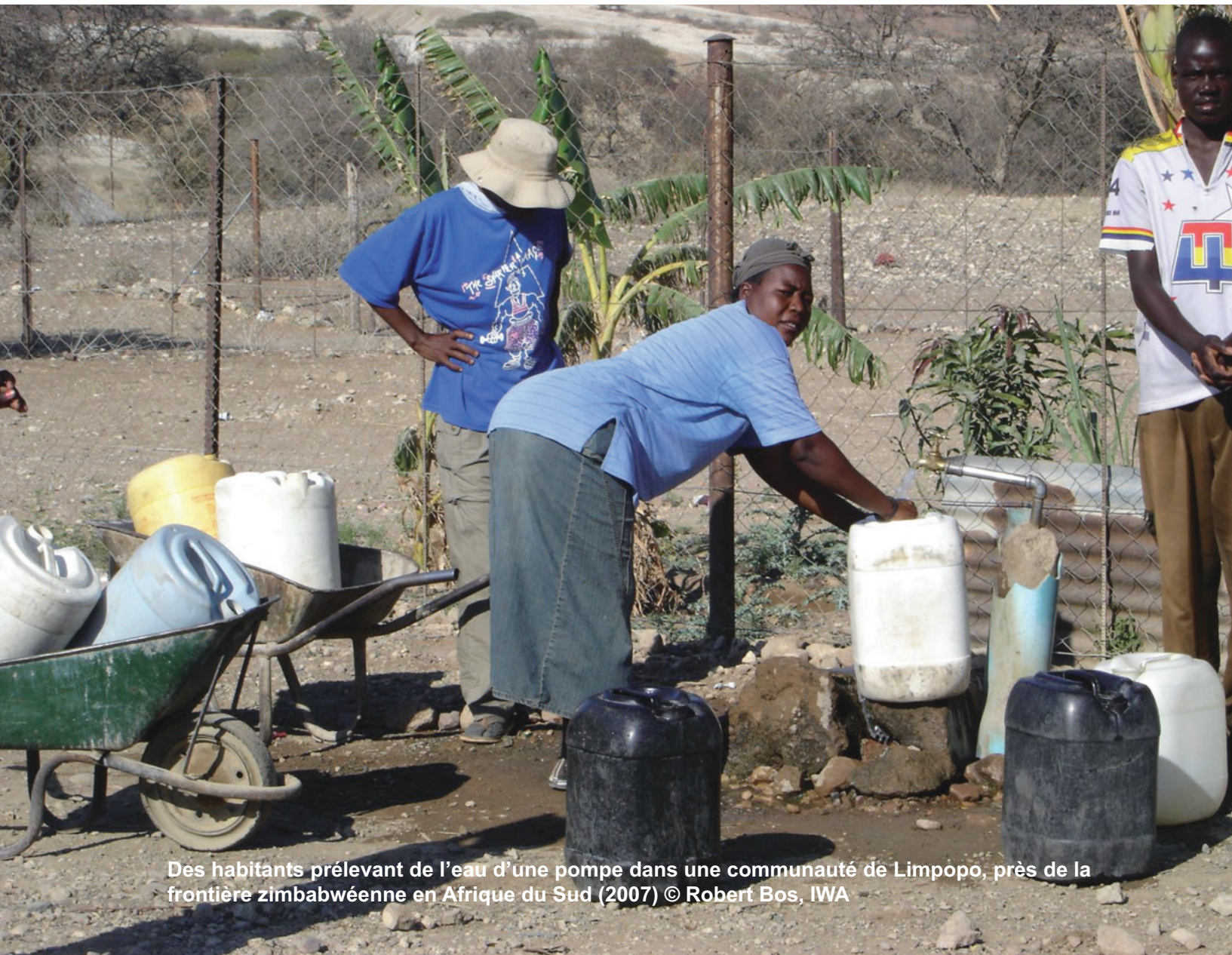
Des habitants prélevant de l'eau d'une pompe dans une communauté de Limpopo, près de la frontière zimbabwéenne en Afrique du Sud (2007)