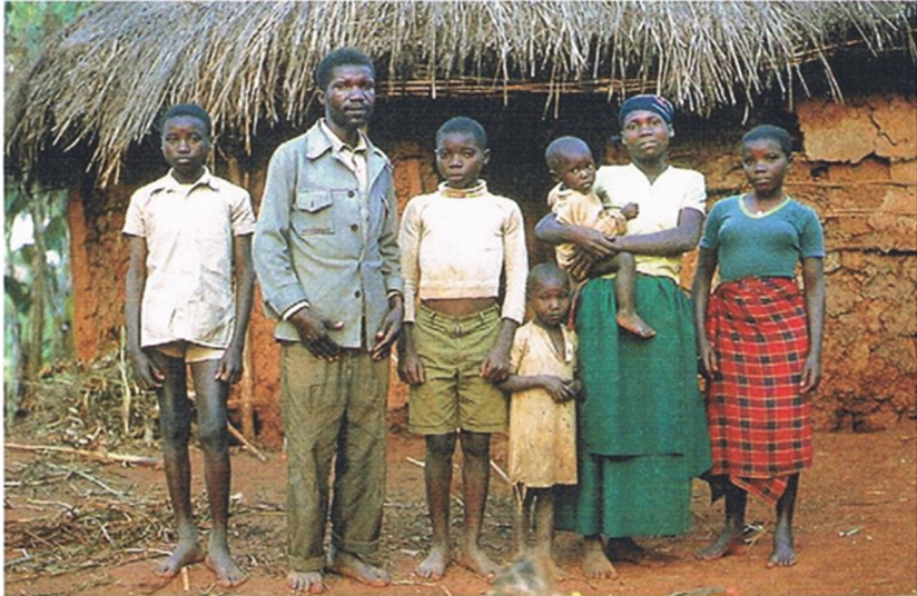
Familie in Kenia