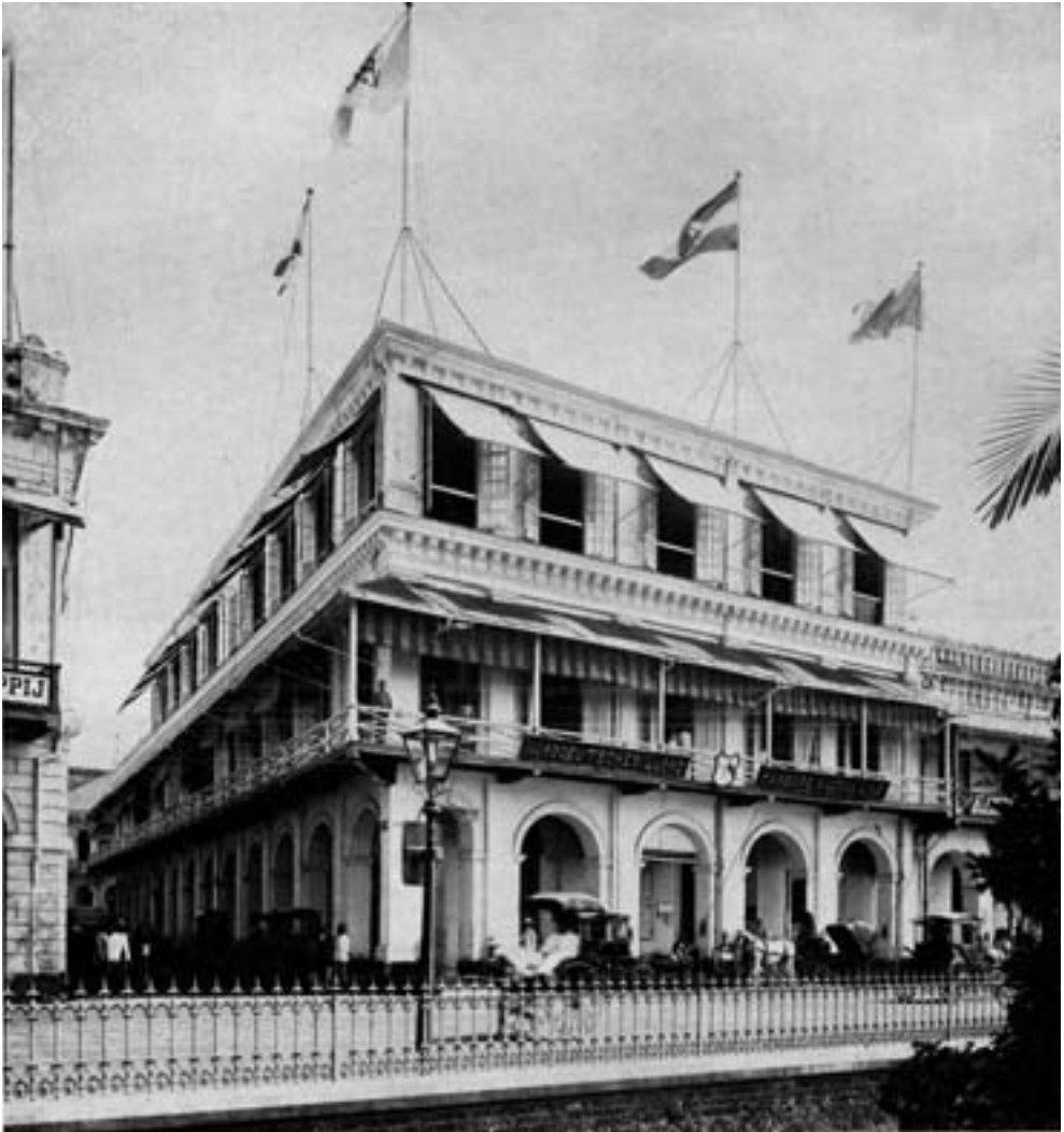
Das Geschäftsgebäude der Firma Behn, Meyer & Co. am Finlayson Green in Singapur