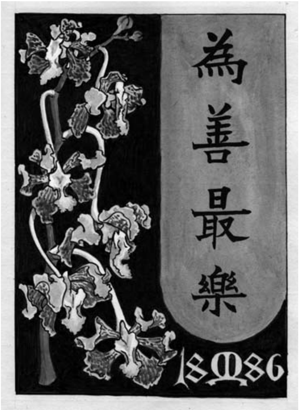
Bild aus dem Jahr 1886, von Eduard Lorenz Meyer. Die Übersetzung lautet: „Gutes zu tun bringt höchstes Glück“