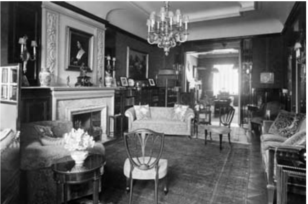
Herrenzimmer und Wohnzimmer des Hauses Tesdorfstraße 18