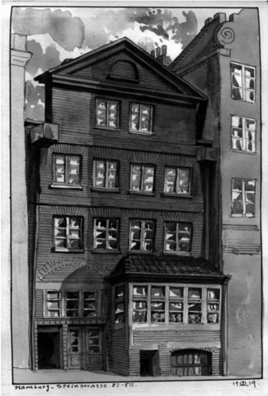
Hamburg, Steinstrasse 83-85, von Eduard Lorenz Lorenz-Meyer (1919)