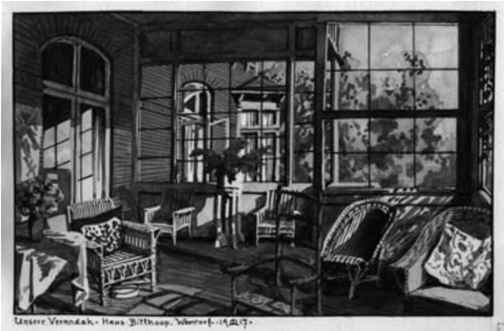
Veranda Haus Billhoop Wentorf, von Eduard Lorenz Lorenz-Meyer (1917)

Hauptsache ist, dass wir in der Ausübung einen Dienst am Nächsten tun und nicht um unserer selbst willen, (...).