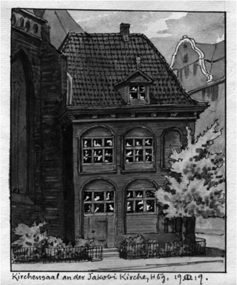
Kirchensaal an der Jacobi-Kirche, Hamburg, von Eduard Lorenz Lorenz-Meyer (1919)

..... „An Bildern, Urkunden, Tagebüchern kann man hier den Roman einer Familie ablesen, und diese private Familienchronik weitet