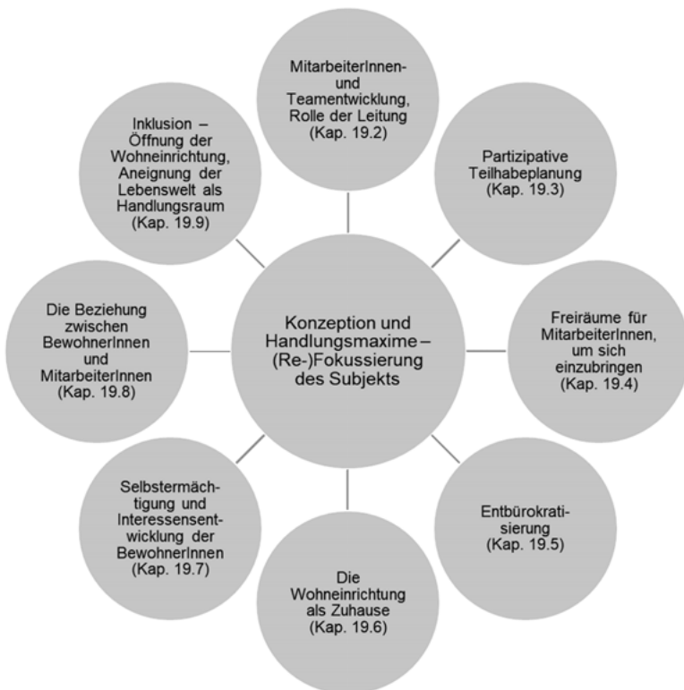
Abbildung 1: Konzeption und Handlungsmaxime – (Re-)Fokussierung des Subjekts

pädagogischen Konzept und zeugt zudem davon, wie sehr die einzelnen Aspekte miteinander zusammenhängen. Das verdeutlicht auch, dass die Arbeit am pädagogischen Konzept nicht als singuläre Maßnahme erfolgen kann, sondern dass es sich dabei um einen Prozess handeln muss, der sich diskursiv vollzieht. Die untenstehende Übersicht sowie die darauffolgende Tabelle zeigen die in diesem Kapitel aufgeführten Ideen hinsichtlich der Entwicklung eines pädagogischen Konzepts, das von einer (Re-)Fokussierung des Subjekts ausgeht. Darin wird zudem ein erster Eindruck der Vielgestaltigkeit konzeptioneller Ideen vermittelt, die bei einer solchen Entwicklung eines pädagogischen Konzepts eine Rolle spielen.