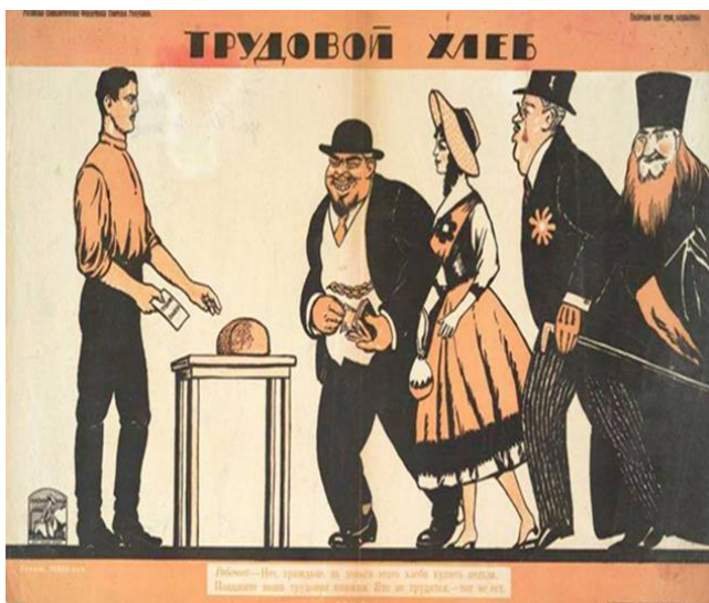
Трудовой хлеб. «Нет, граждане, за деньги этого хлеба купить нельзя. Покажите ваши трудовые книжки. Кто не трудится, — тот не ест». (1920) Pan ganado con el trabajo. "No, ciudadanos, no se puede comprar este pan con dinero. Muestran sus registros de empleo. Quien no trabaja - no come". (1920)

Durante los duros años del "comunismo de guerra" el problema de la prostitución perdió su filo. En un momento en que para toda la población la falta de mercancías era general, y en el que el dinero había perdido todo valor y era reemplazado por la cartilla de racionamiento, la clientela de la prostitución en general se redujo drásticamente. Al mismo tiempo, el poder soviético estableció la obligación general de trabajar. La primera Constitución soviética, adoptada el 10 de julio de 1918, afirmaba explícitamente: “La República Socialista Federativa de los Consejos (Soviets) de Rusia considera el trabajo como deber de todos los ciudadanos de la República y proclama esta divisa: ‘el que no trabaja no tiene derecho a comer.’” (p. 101) La obligación universal del trabajo vigente bajo el comunismo de guerra, presuponiendo la inexistencia del desempleo, se refleja claramente en el siguiente poster contemporáneo: