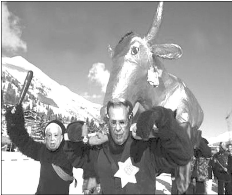
Abb. 3: Demonstration von Globalisierungskritikern in Davos 2003

„Das würde auch das Scheinproblem der ‚Anschlussfähigkeit‘ für rechtsradikale und antisemitische Positionen lösen, die – wie Attac so gerne beteuert – ja niemand verhindern kann: Einer Bewegung, die sich gezielt gegen die Ausbreitung des Antisemitismus in Europa, gegen Neonazis und antisemitische Terrorattentate richtet, werden sich nämlich weder Neonazis noch radikale islamische Gruppen anschließen.“ (Ebd., S. 83)