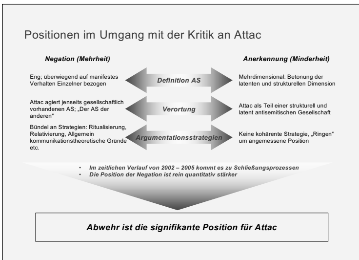
Abb. 2: Positionen im Umgang mit der Kritik an Attac

Innerhalb der Position der Anerkennung und Wahrnehmung (Abb. 2) wird die Kritik strukturell antisemitischer Affinitäten selbstreflexiv auf die eigenen Argumentationen und Handlungen bezogen. Attac verortet sich in dieser Perspektive als Teil einer latent und strukturell antisemitischen Gesellschaft und nicht jenseits davon. Dabei spielt argumentativ insbesondere die Referenz auf die langfristige historische Kontinuität jüdenfeindlicher Weltbilder innerhalb der christlich-europäischen Tradition, vor allem aber der Verweis auf den nationalen Bezugsrahmen der Shoah und die daraus resultierenden sekundär-antisemitischen Reaktionsformen eine prominente Rolle. Die Gründe hierfür dürften, so die Einschätzung, in allgemeinen zeithistorisch-politischen Kontexten zu sehen sein und im Besonderen in „[...] einem Nachholbedarf in der Auseinandersetzung mit der Geschichte und der Gegenwart des Antisemitismus [...]“ (ebd., S. 80) innerhalb Österreichs.