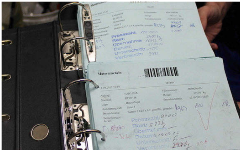
Abb. 17: Abgeheftete Materialscheine

Die Begründung für die Dauer des Aufbewahrens mit der Anzahl der Ordner wirkt spontan komisch. Sie impliziert, dass der Behälter den Prozess bestimmt und nicht umgekehrt und entspricht damit der These des medialen Apriori: „Das Werkzeug bestimmt, was als Zweck überhaupt gesetzt und erkannt werden kann, was als zu verfolgendes Ziel angebar ist, was in den Möglichkeitsgrenzen und Reichweiten liegt.“ (Engell 2000: 279) Das mediale Apriori stellt eine Gegenposition zur Material- und Objektvergessenheit des Anthropozentrismus dar, indem es den „Einfluss“ und die „Handlungsmacht“ der Werkzeuge hervorhebt (ebd.). Komisch wirkt das an einem Ort, der von der Vorstellung menschlicher Handlungsmacht und der Disziplinierung materieller Handlungsmacht geprägt ist. Die Firma N. – und laut Andrew Pickering das Ingenieurwesen insgesamt – ist ein Ort, der auf der Vorstellung basiert, dass Menschen allein aktiv sind, „while the material world is only passive, waiting for us to give it form and purpose“ (Pickering 2010: 198). Dass das Vorhandensein von Ordnern das Sammeln der Zettel bestimmt, steht im Kontrast zu einer auf menschliche Handlungsmacht fokussierten „command-and-control attitude“ (Asplen 2008: 166).