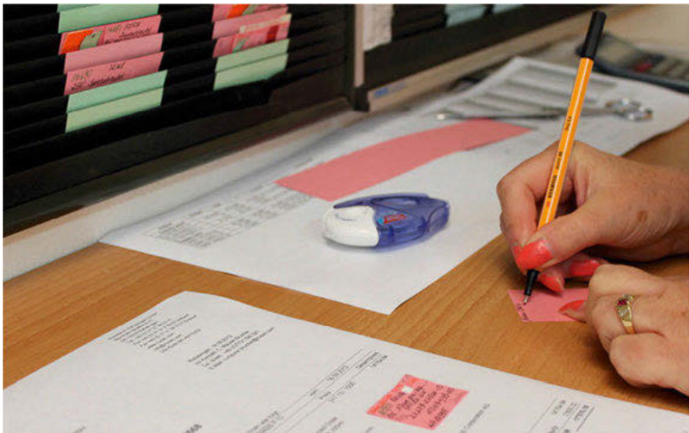
Abb. 8: Einen neuen Auftrag für die Plantafel erstellen

der Artikelnummer und der Bestellmenge die benötigten Materialien aufzeigen. Aber das System macht noch mehr: „Wenn wir einen Auftrag eröffnen, zieht das automatisch die Materialien, die dazu benötigt werden.“ Das System „zieht sich“ die Ressourcenliste heran und „löst für diese Materialien [...] den Bedarf im Einkauf aus“. Doch das betrifft nicht die Abteilung „Arbeitsvorbereitung“, sondern die Abteilung „Einkauf“. In der Abteilung „Arbeitsvorbereitung“ besteht der nächste Schritt in einer erneuten Inskription: Frau J. schreibt die vom System generierte FAR-Nummer wird auf eine pinke Karte, die von jetzt an in der Plantafel für den Auftrag steht. Auch die Artikelnummer, der Durchmesser, die Länge, die Menge und der Name des Artikels werden auf der Karte notiert.