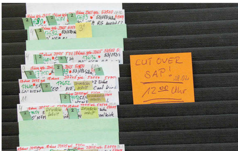
Abb. 20: Vermerk über den „Cut Over“ in der Plantafel

Für den 28.2.2013 ist in der Plantafel der „Cut Over SAP“ vorgesehen. Ich bin an dem Tag in der Firma N., denn ich denke, dass dieser kritische Moment interessant zu beobachten ist. Doch meine Beobachtung scheitert hinsichtlich zweier Aspekte: Erstens ist der Systemwechsel kaum zu beobachten, da er in den Computern stattfindet, die ihn verschleiern. Zweitens ist die Situation so angespannt, dass ich keinen Zugang zu den Ereignissen erhalte. Die Angestellten, die sich mit SAP auseinandersetzen, haben keine Zeit und keine Lust mir zu erklären, was gerade vor sich geht.