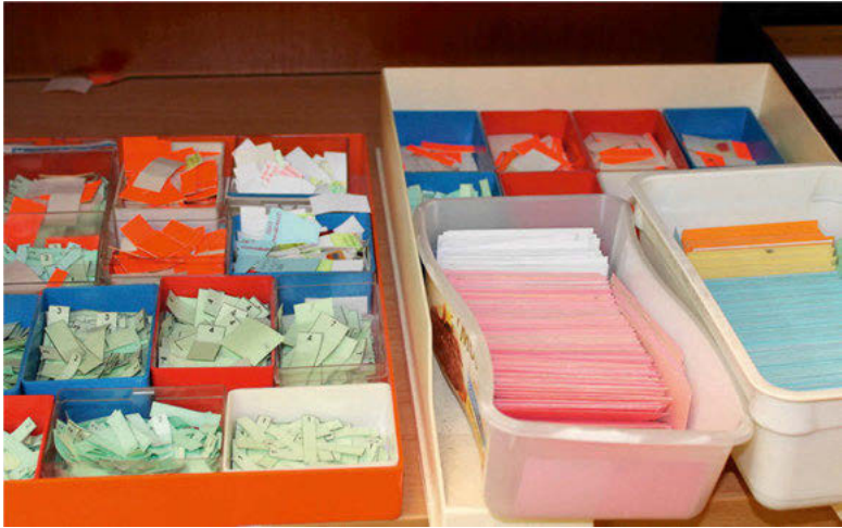
Abb. 9: Die Hardware; eines der Kästchen ist eine umfunktionierte Speiseeisverpackung

Es ist schwer, der Plantafel selbst einen Wert zuzumessen. Herr F. erklärt: „Wenn man den [Blick] natürlich nicht hat, sind das nur ein paar Kärtchen, die beschrieben werden müssen.“ Den verschiedenen Geschäftsführern fehlt der Blick für die Plantafel. Denjenigen, die nicht täglich mit ihr arbeiten, ist sie „ein Dorn im Auge“. Für sie ist die Plantafel kein zuhandenes Werkzeug, sondern ein vorhandenes Ding. Für die Geschäftsführer tritt sie als Ding an sich in den Vordergrund und präsentiert sich als eine Ansammlung von bunten, handbeschriebenen und teilweise abgenutzten Pappkarten in an die Wand montieren Stecktafeln.