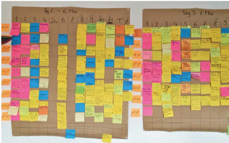
Abb. 12: Papierbasierte Planung bei der re:publica 2015

Den Ruf als veraltetes Medium hat das Papier wieder abgelegt. Ganz im Gegenteil: Im Kontrast zu den wuchernden und sich weiter ausdifferenzierenden elektronischen Endgeräten scheinen Papier und Stift einen neuen Reiz auszustrahlen. Ihre spezifischen Stärken zeigen sich in der Konfrontation mit der neuen Konfiguration von Bildschirm, Cursor und Tastatur. Beispielsweise sind Papier und Stift unübertroffen, wenn es darum geht, Skizzen anzufertigen oder um eine schnelle Notiz zu machen und sie mit sich herum zu tragen und an jemanden weiterzugeben. Diese spezifischen Qualitäten anerkennend, ist die Rhetorik vom Verschwinden und der vollständigen Ersetzung des Papiers durch digitale Technologien einer Rhetorik gewichen, die Koexistenz und Integration betont (vgl. Potthast 2008: 65).