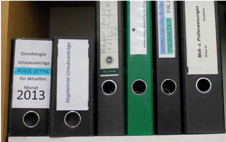
Abb. 23: Konventionalisierte und standardisierte Bezeichnungen

„blaue Zettel“ (Abb. 23), die klassisch funktionale Einteilung der Organisation (Einkauf, Verkauf, Planung, Produktion, Lager, Personal, Finanzen, etc.) oder die Arbeit mit Standardobjekten wie Tabellen, Karteikästen und Akten.