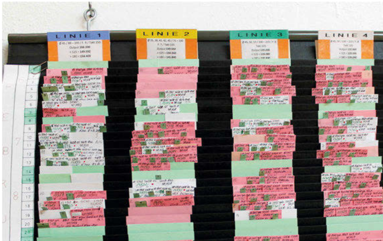
Abb. 25: Erneuerte Beschriftung der Spalten