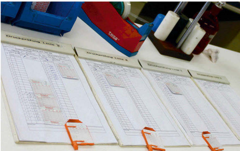
Abb. 18: Prüfdokumente der Qualitätssicherung

Eine zweite Art der Prüfung übernehmen die Mitarbeitenden der Qualitätssicherung. Jede Stunde nehmen sie Artikel aus der laufenden Produktion mit ins Prüflabor. Hier testen sie bestimmte Produkteigenschaften, die vorher mit den Kunden vereinbart worden sind, zum Beispiel die Wasserlöslichkeit der Lackierung erst ab einer bestimmten Temperatur oder die Verformung des Artikels erst ab einem bestimmten Druck. Die Ergebnisse der Prüfung materialisieren sich in Kurven auf einem Raster, die die Prüfanlage als Aufkleber ausgibt. Die Aufkleber mit den Ergebnissen der stündlichen Prüfungen werden auf die Prüfdokumente geklebt (Abb. 18). Nach Ablauf des Auftrags heftet Herr D. sie zusammen mit den „Eigen- und Selbstprüfungen“ in den entsprechenden Ordner ab.