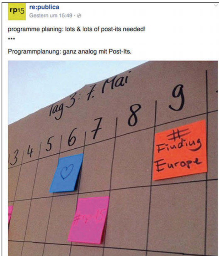
Abb. 11: Facebook-Eintrag der re:publica am 2.3.2015

nen jedweder Art. Seine Beständigkeit beschreibt das Magazin THE NEW YORKER als „one of the great puzzles of the modern workplace“ (Gladwell 2002: 1). Papier ist sogar in Bereiche zurückgekehrt, die sich eigentlich von ihm verabschiedet hatten: Die digital natives der Kreativwirtschaft hantieren mit bunten Blättern, Papierrollen, Pappkarten und Post-its. Zum Beispiel veröffentlichen die Organisator_innen der re:publica, einer jährlichen Konferenz zu Themen der digitalen Kultur, stolz ein Bild ihrer papierbasierten Arbeitsweise (Abb. 11). Ihre Planung und die Werkzeuge, die sie dabei verwenden (Papier, Tabelle, farbige Post-its), erinnern stark an die Plantafel in der Firma N. (Abb. 12).