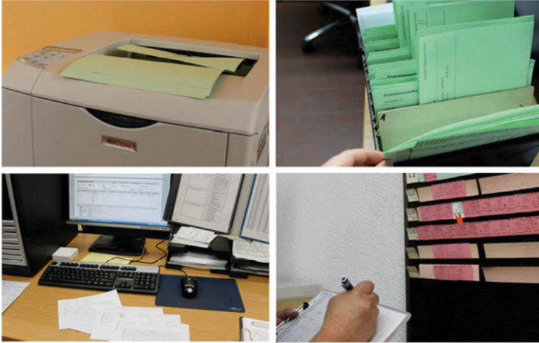
Abb. 24: Überbrückung und Integration