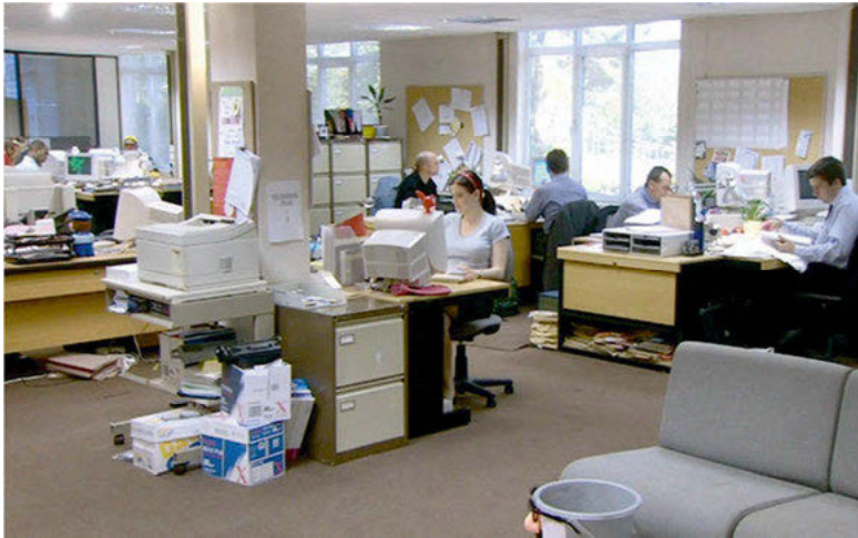
Abb. 1: Büroalltag; Standbild aus der Serie The Office (UK 2001-2003, Staffel 2, Episode 5, TC 22:52)

bungslos fügen sich die Angestellten ein. Die vorliegende Arbeit möchte dieser soziotechnischen Gemengelage ihre Alltäglichkeit und Selbstverständlichkeit nehmen und sie damit der Analyse und der reflexiven Praxis verfügbar machen.