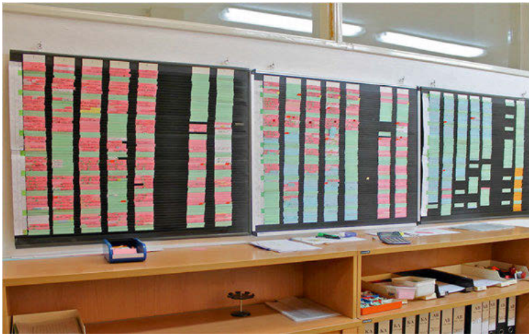
Abb. 5: Plantafel

Bei der Firma N. gibt es die Plantafel „schon immer“, also seit der Gründung der Firma in den 1950er Jahren. Im geräumigen und zentral gelegenen Büro der Abteilung mit dem Namen „Arbeitsvorbereitung“ hängt sie an der Wand. Der Ort bietet genug Platz für die spontanen Zusammenkünfte vor der Plantafel, bei denen Personen verschiedener Abteilungen den Stand eines Auftrags überprüfen und nächste Schritte abstimmen.