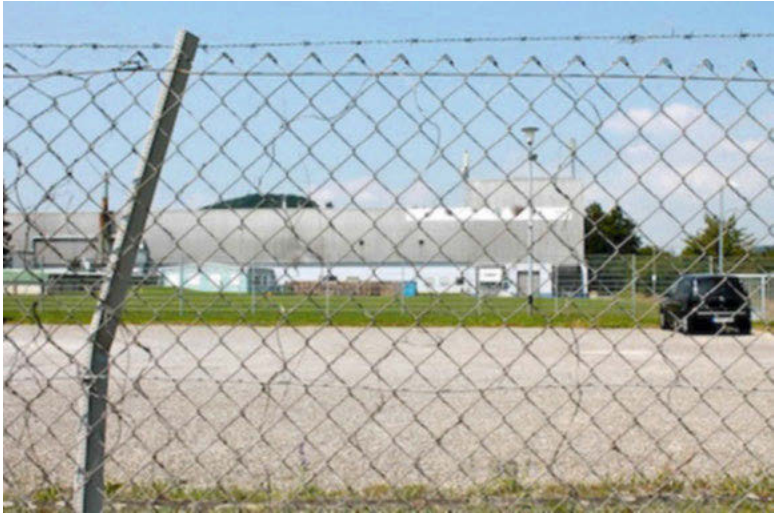
Abb. 4: Feldzugang

Die Firma N. ist ein metallverarbeitendes Unternehmen mit mehreren Standorten in Deutschland und in der Schweiz. Ich habe nur den Standort N. R. kennengelernt, der etwa 115 Angestellte, davon einen Großteil in der Produktion, beschäftigt. 3 Die Produktion ist automatisiert. Sie besteht aus sieben Produktionslinien, die jeweils vom Rohmaterial bis zur Verpackung des fertigen Produkts reichen. Daran angeschlossen sind Werkstätten und die Büros der Verwaltung und des Managements.