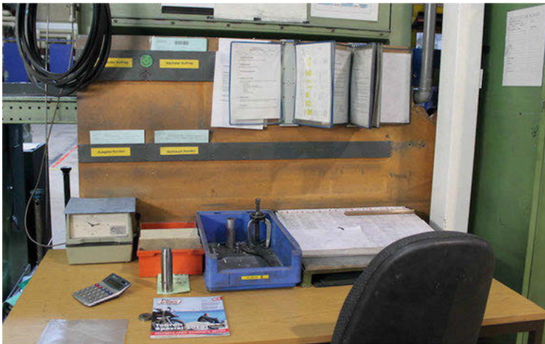
Abb. 13: Einer von ca. fünf Schreibtischen entlang einer Produktionslinie

ren Regalen, die vor idiosynkratisch beschrifteten Akten überquellen, und die Schreibtische mit ihren Ablagen voller Papiere, die noch darauf warten, in einen Aktenordner abgeheftet zu werden. Doch es gibt auch die weniger offensichtlichen Orte für Papiere. Überall entlang der Produktionslinien, die aus verschiedenen Stationen der Bearbeitung bestehen, befinden sich kleine Schreibtische (vgl. Abb. 13). Dort liegen Listen, die abgehakt oder mit Werten aufgefüllt werden müssen, Ablaufpläne, Übersichten und Zettel, die in großen Buchstaben warnen oder erinnern. Es gibt verschiedene Fächer für Fertigungsaufträge und Materialscheine. Klemmbretter erlauben, Papiere mitzunehmen und unterwegs Eintragungen zu machen. Herr S., ein leitender Angestellter in der Produktion, erklärt: „Papierarbeit macht hier jeder.“