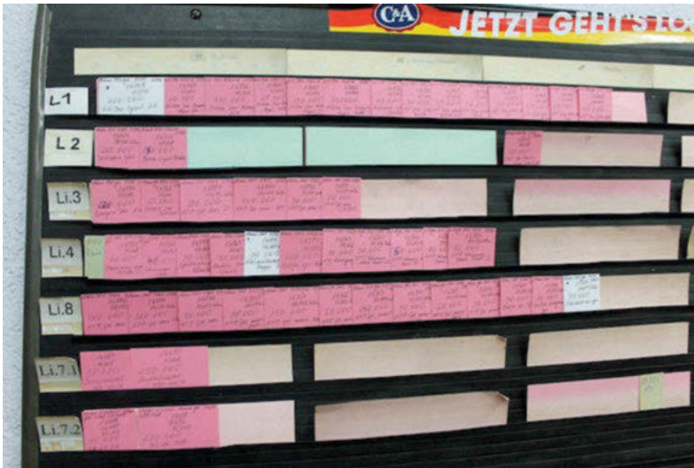
Abb. 10: Zweite Plantafel im Schichtführerbüro

In dieser Tafel sind die Achsen vertauscht. Die Produktionslinien sind in den Zeilen abgebildet, während die Spalten den jeweiligen Tagen zugeordnet sind. Es werden nur die kommenden vier Wochen angezeigt und entsprechend weniger eng sind die Aufträge nebeneinander gesteckt. Die für die jeweiligen Produktionsschritte verantwortlichen „Werker“ kommen an die Plantafel im Schichtführerbüro, um nachzusehen, welche Aufträge in welcher Reihenfolge zu bearbeiten sind. Je nach Anforderung des Auftrags müssen sie Vorbereitungen treffen, Teile besorgen oder Einstellungen an den Maschinen vornehmen. Aus den täglichen Gängen zur zweiten Plantafel zieht Frau J. ihr Wissen über den Produktionsprozess, das sie bei der Planung einsetzt: „Mit der Produktion habe ich sehr viel zu tun, weil wir bringen ja laufend die Aufträge raus.“ Wenn sie die kleinere Plantafel bestückt, wird auch sie mit relevanten Informationen ausgestattet. Zur Plantafel gehören nicht nur das System, Frau J. und ihre Fähigkeiten, sondern auch eine zweite Plantafel. Ohne diese zweite Plantafel, die ihre Anordnungen in den neuen Kontext des Schichtführerbüros übersetzt, hätte sie nur geringen Nutzen.