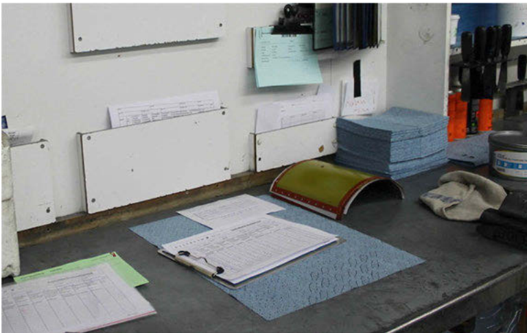
Abb. 16: Schreibtischordnung: Fächer für „Klassifizierbares“; die Fläche für das, was sich in der Bearbeitung befindet

hender Tätigkeiten. Die zitierten Aussagen der von Kidd interviewten Personen verdeutlichen, dass es um die visuelle und haptische Qualität des Papiers auf der vertikalen Fläche geht: „I think it's a visual thing.“ „I think a key thing for me is that I like information to be tangible [...]. I can actually touch it and move it around as I want.“ (Kidd 19994: 187 f.) Zettelordnungen auf Schreibtischen verfügen demnach über einen Informationsgehalt. Ihr Beitrag in der Bearbeitung von Aufgaben ist nicht zu unterschätzen. Was Kidd nicht explizit erwähnt, ist die Rolle des Tisches. Als vertikale Fläche liegt er zwischen Informationseingang und -ausgang und ist damit der unerlässliche Träger der sich gerade in der Verarbeitung befindlichen Prozesse (vgl. Seitter 2002: 86).