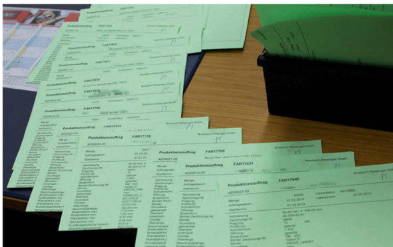
Abb. 21: Vorbereitete Produktionsaufträge

gen Erfahrungen hat man sich ein Verfahren überlegt, um den Übergang besser meistern zu können: Im alten System werden Produktionsaufträge für zwei Wochen im Voraus erstellt. Die entsprechenden Papiere, die die Produktion dafür braucht, werden ausgedruckt. In der Plantafel werden die Aufträge den Produktionslinien zugeordnet. Die Umstellung besteht jetzt darin, diese Aufträge nacheinander in „SAP-Aufträge“ umzuwandeln und sie in der elektronischen „SAP-Plantafel“ anzuordnen. Dies kann dann mit weniger massivem Zeitdruck geschehen, denn notfalls lässt sich parallel mit den Ausdrucken aus dem alten System und der Plantafel weiterarbeiten. Stillstände der Maschinen und Fehlproduktionen sollen vermieden werden. Man „bewaffnet sich“ mit Papieren und begegnet dem Systemwechsel mit umfangreichen Listen und Ausdrucken aus dem alten System.