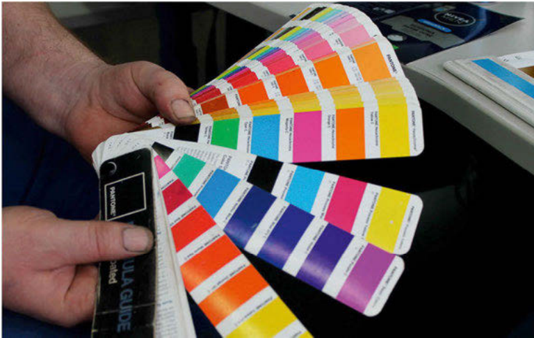
Abb. 2: Ausgebreiteter Pantone-Fächer in der Repro-Abteilung der Firma N.

Gemenge zu untersuchen bedeutet für Serres, „geduldig und mit respektvollem Fingerspitzengefühl der komplizierten Anordnung der Hüllen und Zonen, der tiefen Staffelung der benachbarten Räume, dem Talweg ihrer Nähte zu folgen und sie, sofern möglich, auseinanderzubreiten wie das Rad eines Pfaus oder einen Spitzenrock“ (Serres 1993: 105).