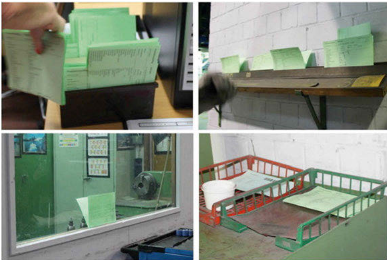
Abb. 14: Zirkulation der grünen Zettel

Kapitel 4.1) und anschließend mehrfach auf dem dafür vorgesehenen hellgrünen Papier ausdruckt. Sie bringt die „grünen Zettel“ ins Schichtleiterbüro, das den Ausgangspunkt der Zirkulation der Zettel bildet. Wenn Frau J. an die dort aufgehängte zweite Plantafel geht und die pinken Kärtchen an die für sie vorgesehenen Positionen steckt, hat sie pro Auftrag sechs Ausdrücke auf grünem Papier dabei. Im Schichtleiterbüro sortiert sie die Papiere in einen Karteikasten. Im Verlauf des Tages und besonders zu Beginn einer Schicht kommen Personen aus den verschiedenen Bereichen ins Büro und lesen an der Plantafel ab, welcher Auftrag an ihrer Linie als nächstes zu bearbeiten ist. Das pinkle Kärtchen, das für den Auftrag steht, und der zugehörige grüne Zettel sind über die FAR-Nummer miteinander verbunden. Die „Werker“ suchen im Karteikasten nach dem grünen Zettel für ihren nächsten Auftrag und bringen ihn an die jeweilige Position entlang der Linie. So verteilen sich die grünen Zettel über die verschiedenen Bereiche der Produktion (vgl. Abb. 14).