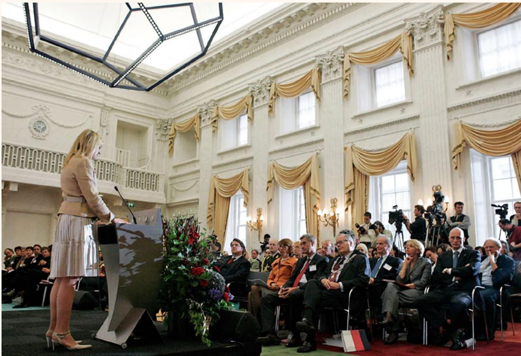
H.K.H. Prinses Máxima spreekt bij de presentatie van het rapport Identificatie met Nederland

Behalve de kwaliteit van rapporten is ook de publieke presentatie daarvan uiterst belangrijk, zeker nu wetenschappelijk gezag niet meer vanzelfsprekend is. Horzelsfunctie, stenen gooien in de Hofvijver en vele andere metaforen zijn al gebruikt om aan te geven wat velen als een kernfunctie zien van de WRR: aanzetten tot nadenken, ter stimulering van het leervermogen van overheid en samenleving. Terecht beklemtoonde de evaluatiecommissie in dat kader de eigen actieve deelname van de raad aan het publieke debat, ondanks “intense reacties vanuit de media of vanuit