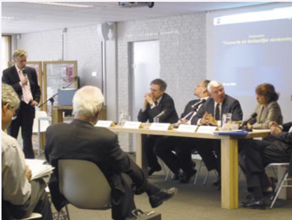
Samen met het ministerie van Financiën werd een symposium georganiseerd ter gelegenheid van het verschijnen van de Verkenning van prof. Dik Wolfson: Transactie als bestuurlijke vernieuwing .

te maken in de vorm van een transactie. Nu doorbreken overheidsinterventies de voor de markt karakteristieke band tussen beslissen en betalen. Hierdoor wordt het zicht ontnomen op de wederkerigheid van nut en offer, waardoor vitale informatie verloren gaat. Een rechtstreekse koppeling van rechten en plichten dwingt burgers, uitvoerders en beleidsmakers het achterste van hun tong te laten zien. De transactiestaat formuleert rechten en slaat de kosten van wat de overheid levert hoofdelijk om. Daartegenover staan afspraken met alle betrokkenen om de kwaliteit van publieke voorzieningen te verhogen en het beroep erop tot het noodzakelijke te beperken. (aldus enkele citaten uit de studie).