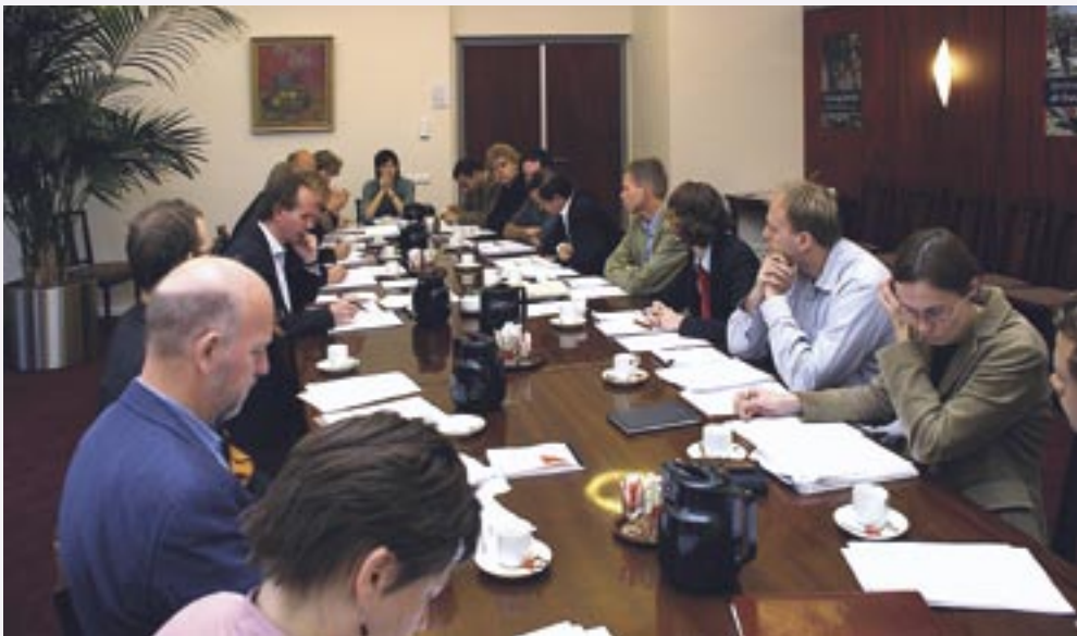
Vergadering van de wetenschappelijke staf van de WRR, als voorbereiding van de vergadering van de raad.