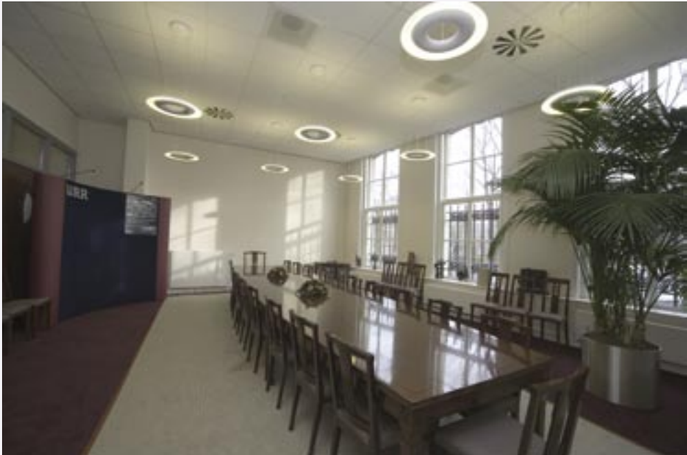
De vergaderzaal van de raad in het nieuwe pand.

lerende overheid. Aan de hand van dit perspectief wordt toegewerkt naar aanbevelingen. Deze laten de overheid (centraal, maar zeker ook lokaal) beter beslagen ten ijs komen op de terreinen waar zij geconfronteerd wordt met complexe, sectoroverstijgende problemen, die in hun oplossingsrichting om maatwerk vragen. Daarnaast vergen ze een sterke inhoudelijke betrokkenheid van ambtenaren, professionals en hun organisaties.