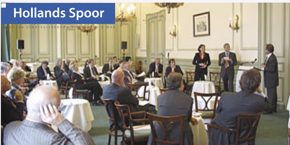
De eerste bijeenkomst van Hollands Spoor , een reeks debatten tussen wetenschappers en beleidsmakers over actuele zaken, georganiseerd door de WRR in samenwerking met het Strategieberaad Rijksbreed.

Workshops, expert meetings, author-meets-critics -colloquia (samen met de Raad van State georganiseerd), en de WRR-lecture, zijn allemaal bedoeld als food for thought voor beleid. Hetzelfde geldt voor de Hollands Spoor-bijeenkomsten, een