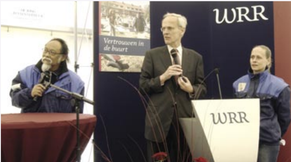
De presentatie van Vertrouwen in de buurt in Schiedam, samen met de buurtwacht

Naast de aandacht voor het plaatselijke niveau is er ook een belangrijke – ondersteunende – rol voor het rijk. Sterke buurten en betrokken burgers vragen om een forse verandering in de bestuurlijke cultuur en om een ambitieuze en vernieuwende lokale democratie.