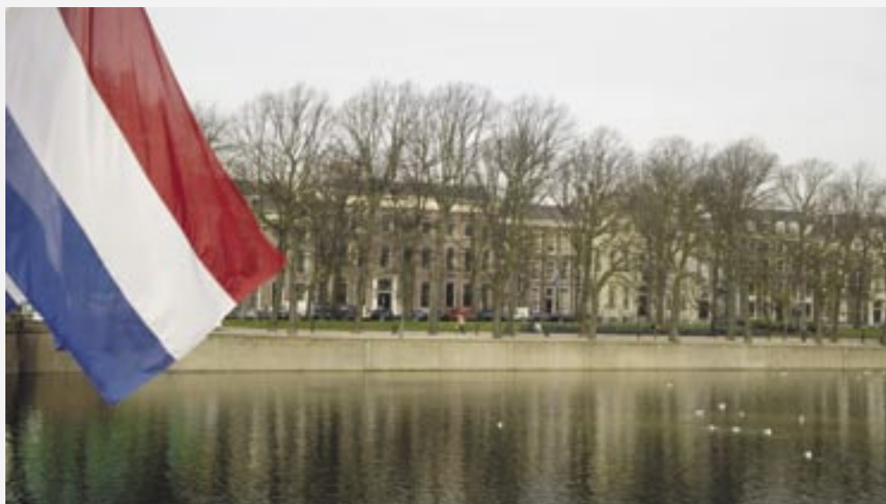
Sinds 1 juli 2004 is de WRR gevestigd aan de Hofvijver in het gerenoveerde pand Lange Vijverberg 4-5 in Den Haag.

Het voeden van beleid met (wetenschappelijke) kennis over de samenleving kan bijdragen tot een scherpere analyse van deze verhouding en kan ook bijdragen aan het herstellen van de verbinding. Nieuwe empirische en theoretische inzichten over hoe de arbeidsmarkt werkelijk functioneert helpen om beleid te voeren dat de Nederlandse economie toerust voor de toekomst. Empirische en wetenschappelijke kennis schrijft geen politieke keuzen voor, maar kan wel helpen beter