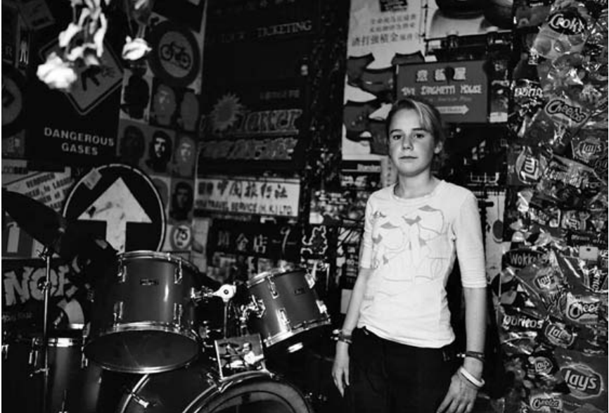
Boeken in Tijden van Subculturen. Zie voor meer afbeeldingen bij de blogs: www.constantvzw.com/soetaert .