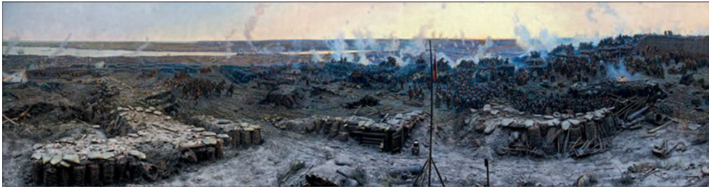
Abb. 9: Die Verteidigung von Sevastopol' 1854 – 1855, Panoramagemälde von Franz Rubo, 1904

Einsatz moderner Waffensysteme alle damaligen Teilstreitkräfte involvierte. 15 Gleichzeitig, und dies mag erstaunen, war der Krimkrieg über lange Strecken und von allen Beteiligten ein hinsichtlich der zugrundeliegenden Strategien und der allfälligen Vorbereitungen (z.B. im Bereich der Verproviantierung und des Nachschubs im Allgemeinen) ein sehr schlecht geführter Krieg. 16 Die Betonung der ideologischen Dimension auf Seiten Englands und Frankreichs – nämlich als Kampf gegen das autokratische Russländische Imperium – als Ursache und nicht als nachträgliche Begründung für den Krieg überzeugt hingegen weniger. Diese Interpretation ignoriert die wirtschaftlichen und machtpolitischen Interessen der Verbündeten der Hohen Pforte. Das Osmanische Reich wurde von den Großmächten – und eben auch von St. Petersburg – vielfach als eine Art kolonialer Ergänzungsraum betrachtet, auf den man Einfluss haben wollte. Dass der Krimkrieg vor allen Dingen ein Konflikt zwischen zwei zivilisatorischen Polen (West versus Ost, d. h. Russland) gewesen sei, ist nicht stichhaltig. 17