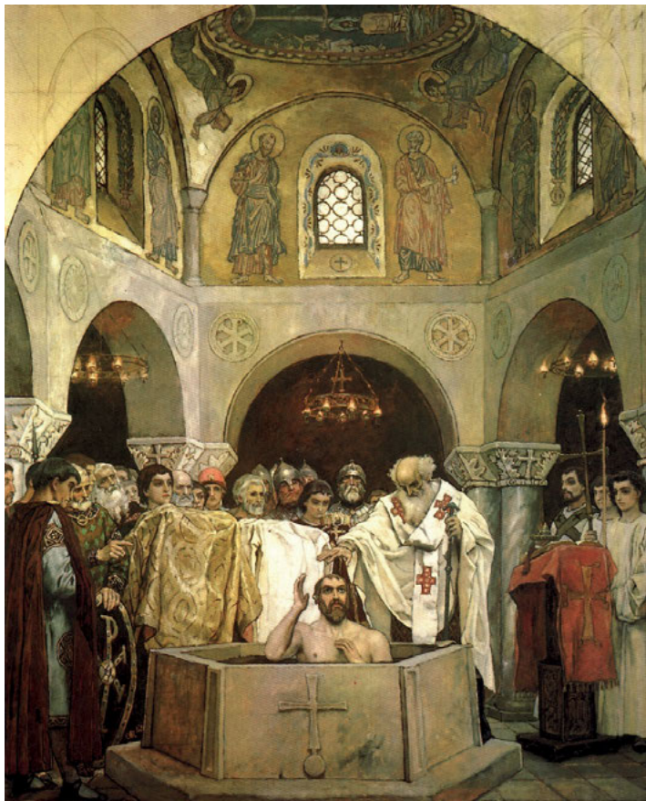
Abb. 5: Taufe Vladimirs, Gemälde von Viktor Vasnetsov, 1890

Gottes um Beistand an – und er „schlachtete den Rededja.“ 11 Diese der Quelle zufolge mit göttlichem Beistand erlangte Herrschaft über Tmutarakan' währte allerdings nicht lange, denn schon im 12. Jahrhundert wurde durch das Vordringen der Kumanen (siehe Kapitel 10) der Niedergang des Fürstentums eingeleitet. 1094 wird es letztmalig in russischen Chroniken erwähnt. In der Folge geriet es unter unterschiedliche Herrschaften. 12 Die Konstellation – sporadisches und streckenweise erfolgreiches Vordringen der Rus' nach Süden, die Existenz Tmu-