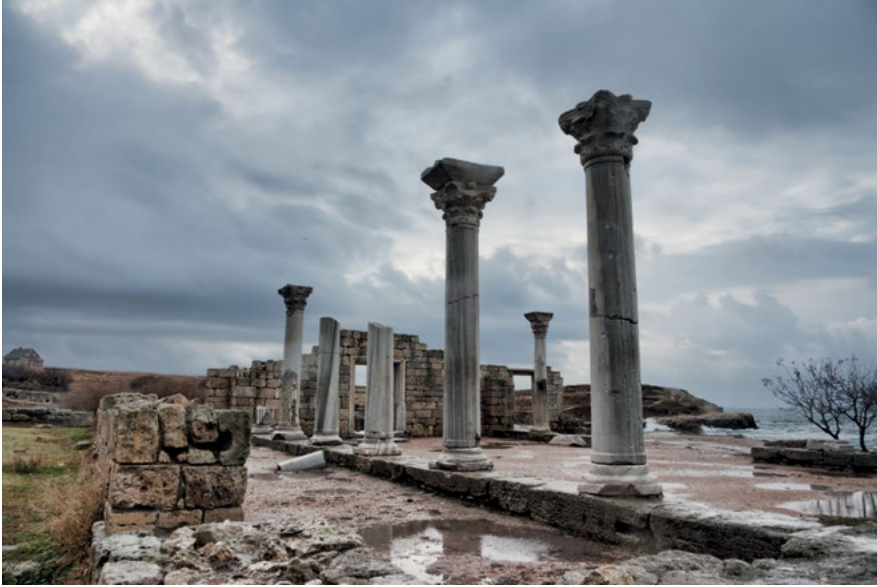
Abb. 4: Ruinen von Chersones

über die antike griechische kollektive Identität. 18 Die Migration in die Gebiete außerhalb des hellenischen Kernlandes formten diese zu einem komplexen Siedlungsmythos, der den Glauben an die eigene Überlegenheit gegenüber der autochthonen Bevölkerung zu verfestigen half. Unabhängig davon, ob die jeweiligen Geschichten die Gründung einer griechischen Kolonie auf der iberischen Halbinsel, im Mittelmeer oder eben auf der Krim erzählten, weisen sie eine recht ähnliche Grundstruktur auf: Eine Mutterstadt entsendet eine beträchtliche Zahl von KolonistInnen in die Fremde, wo diese eine griechische Siedlung gründen, welche von der indigenen Bevölkerung hart bekämpft wird. Selbstverständlich obsiegen die überlegenen Hellenen am Ende über die Barbaren. 19 Der realen Auswanderung aus dem Mutterland vorausgegangen waren – und dies ist der historische Hintergrund der griechischen Kolonistenbewegung – zumeist soziale und/oder politische Spannungen in der Metropole. In den legendisierten Erzählungen heißt es hingegen zumeist, Ausreisewillige hätten sich an das Orakel von Delphi gewandt, welches den Ratsuchenden die Auswanderung mit der Zustim-