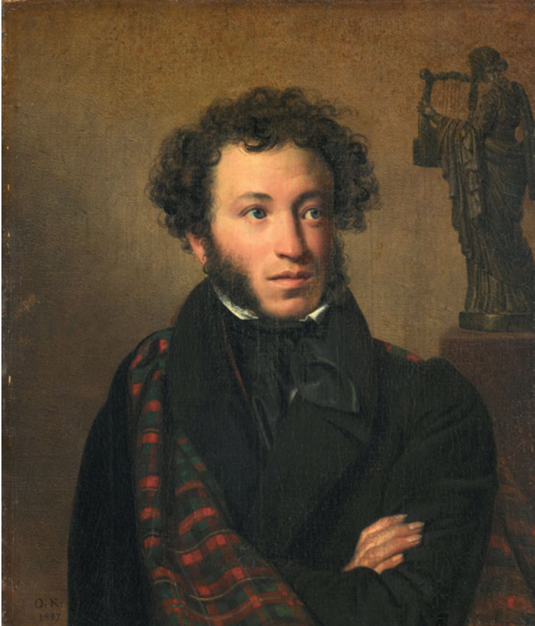
Abb. 1: Portrait Alexander Puškin, Gemälde von Orest Kiprenskij, 1827

zuführen ist. 53 Die Fluidität und Flexibilität von Mythenbeständen über sprachliche und kulturelle Grenzen hinweg zeigt sich hieran anschaulich, kann dieser Mythos doch sowohl als russischer, krimtatarischer als auch (wie noch anzusprechen ist) polnischer und ukrainischer Mythos gelten.