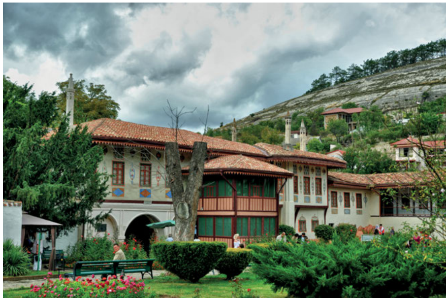
Abb. 6: Chan-Palast von Bağçasaray