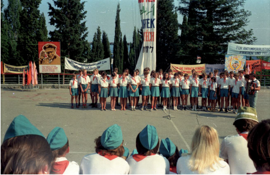
Abb. 14: Pionierlager Artek, 1986

ternationalen Kinder- und Jugendaustausches. Die Pionierlager waren Teil einer möglichst früh, also im Kinder- und Jugendalter greifenden und der Kleinfamilie entzogenen Erziehung zum sog. Neuen (= sozialistischen) Menschen. Die ideologische Indoktrination durch Erziehung war zum Teil durchaus kindgerecht 32 , junge Talente wurden gesucht und gefördert, berühmte Persönlichkeiten wie der Kosmonaut Jurij Gagarin (1934–1968) oder in- und ausländische Staatschefs wie Walter Ulbricht (DDR, 1893–1973), Georgi Dimitrov (Bulgarien, 1882–1949) oder Ho Chi Minh (Vietnam, 1890–1969) besuchten „Artek“. Die weitläufige, aus mehreren Haupt- und Nebenlagern bestehende Anlage setzte auch architektonisch Maßstäbe, besonders der Ausbau zwischen 1957 und 1966, der zudem die Kapazitäten so erhöhte, dass ab Mitte der 1960er Jahre jährlich über 20.000 Kinder und Jugendliche gleichzeitig dort Ferien machen konnten. 33