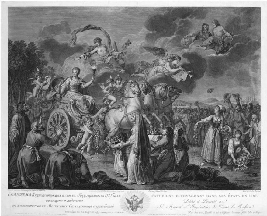
Abb. 7: Katharinas Triumph. Allegorie auf die Reise der Kaiserin Katharina II. auf die Krim, Gravur von Jean Jacques Avril dem Älteren, 1790

gestellten BesucherInnen durch ein Spalier kostbar ausgestaffierter krimtatarischer Reiter beileibe keine spontane Ehrenbezeugung, sondern eine administrativ koordinierte Inszenierung gewesen ist. Die Huldigungen tatarischer Würdenträger, welche die Kaiserin so erfreuten, waren von der russischen Vorhut sorgfältig geplant worden. 21