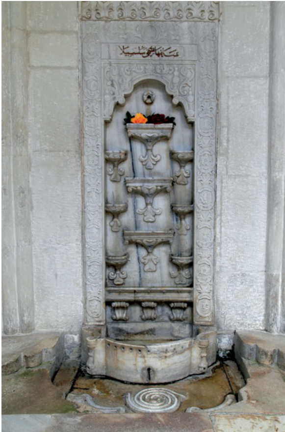
Abb. 2: Tränenbrunnen im Chan-Palast von Bağçasaray

tiefen Eindruck gemacht hatte und die Auffassung nährte, die Halbinsel sei ein Ort, in dem die nur unklar fixierte ‚russische Kultur‘ fest verwurzelt sei.