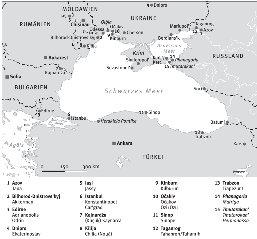
Karte der Schwarzmeerregion