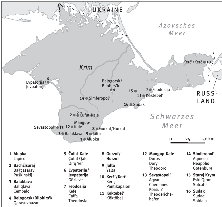
Karte der Krim