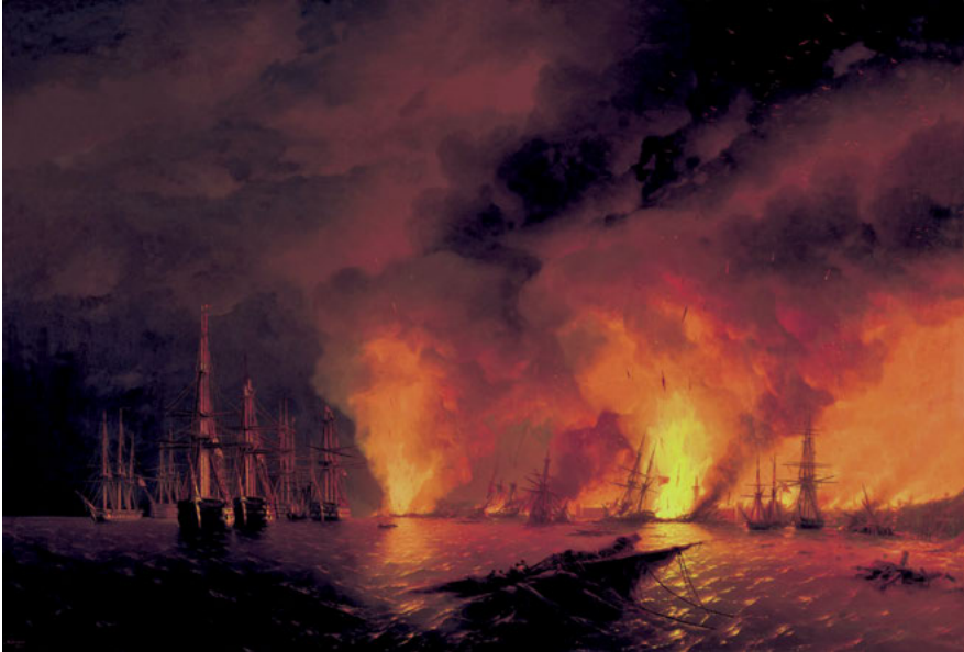
Abb. 8: Die Schlacht von Sinope am 18. November 1853 (Nacht nach der Schlacht), Gemälde von Ivan Ajvazovskij, 1853

Unbeteiligte ‚nachspürbarer‘. Vorreiter waren die „London Times“ und Akteure wie William Howard Russel (1820–1907) 12 , Roger Fenton (1819–1869) 13 oder James Robertson (1813–1888). Sie alle trugen dazu bei, dass der Konflikt untrennbar mit einem seiner Schauplätze, nämlich der Krim, verbunden und assoziiert wurde, wurde doch von dort viel berichtet. Photographien vom Schauplatz fanden schnell ihren Weg in das übrige Europa. Kriegs- und Heimatfront wurden und konnten dadurch leichter ‚zusammengedacht‘ werden, was insbesondere russischerseits im Kontext der 349 Tage von den Alliierten belagerten Stadt Sevastopol’ der Fall war. Dort – und darauf wird noch zurückzukommen sein – wurden Männer, Frauen und sogar Kinder AkteurInnen im Kriegsgeschehen.