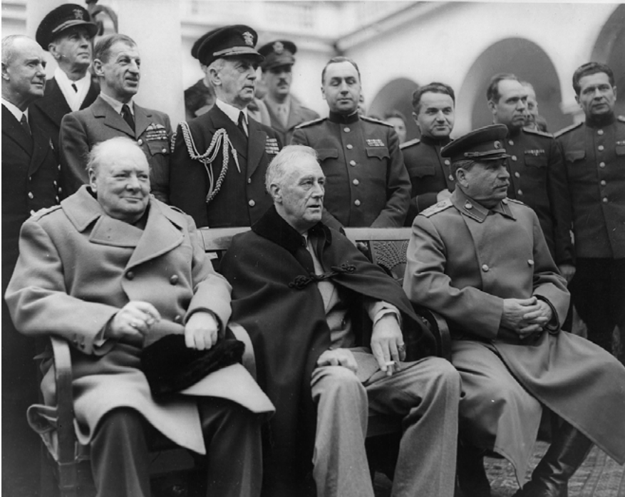
Abb. 13: Gruppenfoto bei der Konferenz von Jalta, 1945 (von links: Winston Churchill, Franklin D. Roosevelt und Josef Stalin)

Rus' als eine Wiedervereinigung zwischen ‚Groß-‘ und ‚Kleinrussen‘ (= Ukrainer). 8 In jedem Fall wurde 1954 der Transfer der Krim als eine Art Unterpfand für die ‚unverbrüchliche Freundschaft‘ zwischen diesen beiden zahlenmäßig größten Nationalitäten der Union präsentiert.