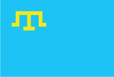
Abb. 15: Flagge der KrimtatarInnen

Meclis nicht offiziell an. Erst unter dem Präsidenten Leonid Kučma (*1938, Präsident 1994–2005) wurde ein „Rat der Repräsentanten des krimtatarischen Volkes“ installiert, der mit den Mitgliedern des Meclis ident war; ob dies aber nun die rechtliche Anerkennung bedeutete, wurde kontrovers diskutiert. 15