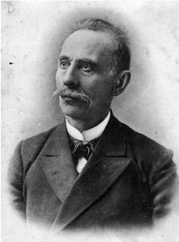
Abb. 10: İsmail Gaspiralı (Ismail Gasprinskij)

russifizierenden Politik – die Verbundenheit der RusslandmuslimInnen mit dem Imperium, ihm schlug aber gerade seitens nationaler und orthodoxer russischer Eliten, die in jedem Muslim einen religiösen Fanatiker sehen wollten, immer wieder ein kalter Wind entgegen. 28 Nach der Russischen Revolution von 1905 zeigte sich, dass der Djadidismus auch innerhalb der muslimischen Gemeinschaft kritisiert wurde: Seitens der sich zunehmend national als tatarisch oder ethnisch-türkisch definierenden sog. Jungtatarischen Bewegung 29 regte sich ebenso Widerstand wie seitens der traditionellen muslimischen Geistlichkeit, die von russischen Stellen weiterhin bevorzugt wurde. Am Beispiel der von Gaspiralı ge-