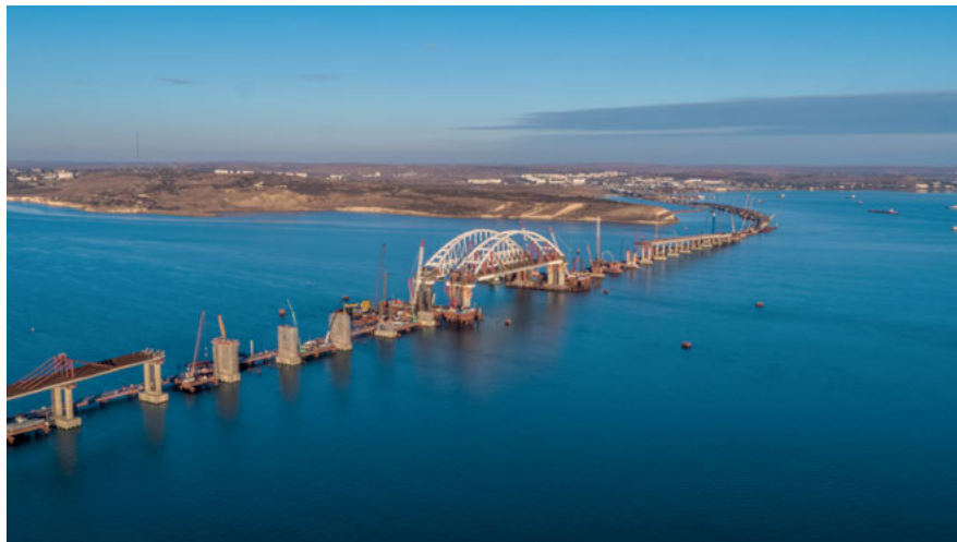
Abb. 16: Bau der Krim-Brücke, 13. Oktober 2017

sentieren wollte. 35 Die Wahl des neuen Präsidenten Volodymyr Zelenskyj (*1978) im Mai 2019 zeigte, dass diese Strategie beim Wahlvolk nicht verfiel. 36