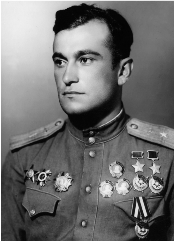
Abb. 12: Amet-Han Sultan – zweimaliger Held der Sowjetunion, Fotografie von 1945