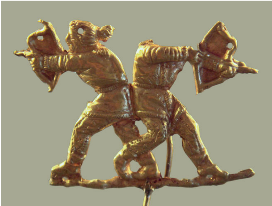
Abb. 3: Skythische Bogenschützen, Pantikapaion, 475–450 v. Chr.

traten mit diesen nicht nur in ökonomische, sondern in umfassende lebensweltliche Beziehungen, was dazu führte, dass die Barbaren und die Griechen sich über die Zeit partiell wechselseitig anverwandelten. Die Voraussetzung dafür war das Einströmen einer größeren Zahl griechischer Kolonisten in das Gebiet. Für den Schwarzmeerraum und damit auch für die Krim war sowohl die sog. „Ionische“ (11./10. Jahrhundert v. Chr.) als auch die „Große Kolonisation“ (8. bis 6. Jahrhundert v. Chr.) von Bedeutung. In deren Folge entstanden auf der Halbinsel zahlreiche griechische Pflanzstädte (griech. Apoikien) – u. a. Chersones, das ursprünglich eine ionische Gründung und später eine dorische Neugründung war, bevor die heutige Ruinenstadt Teil eines Vororts von Sevastopol’ geworden ist. Theodosia, das heutige Feodosija (russ./ukr.; krimtat. Keŕe; auch Caffa oder Kaffa genannt), war eine Milet-Gründung, und Pantikapaion, vermutlich ebenfalls eine Milet-Gründung, ist in unserer Zeit das ganz im Osten der Halbinsel gelegene Kerč’ (krimtat. Kerıç; ukr. Kerč’).