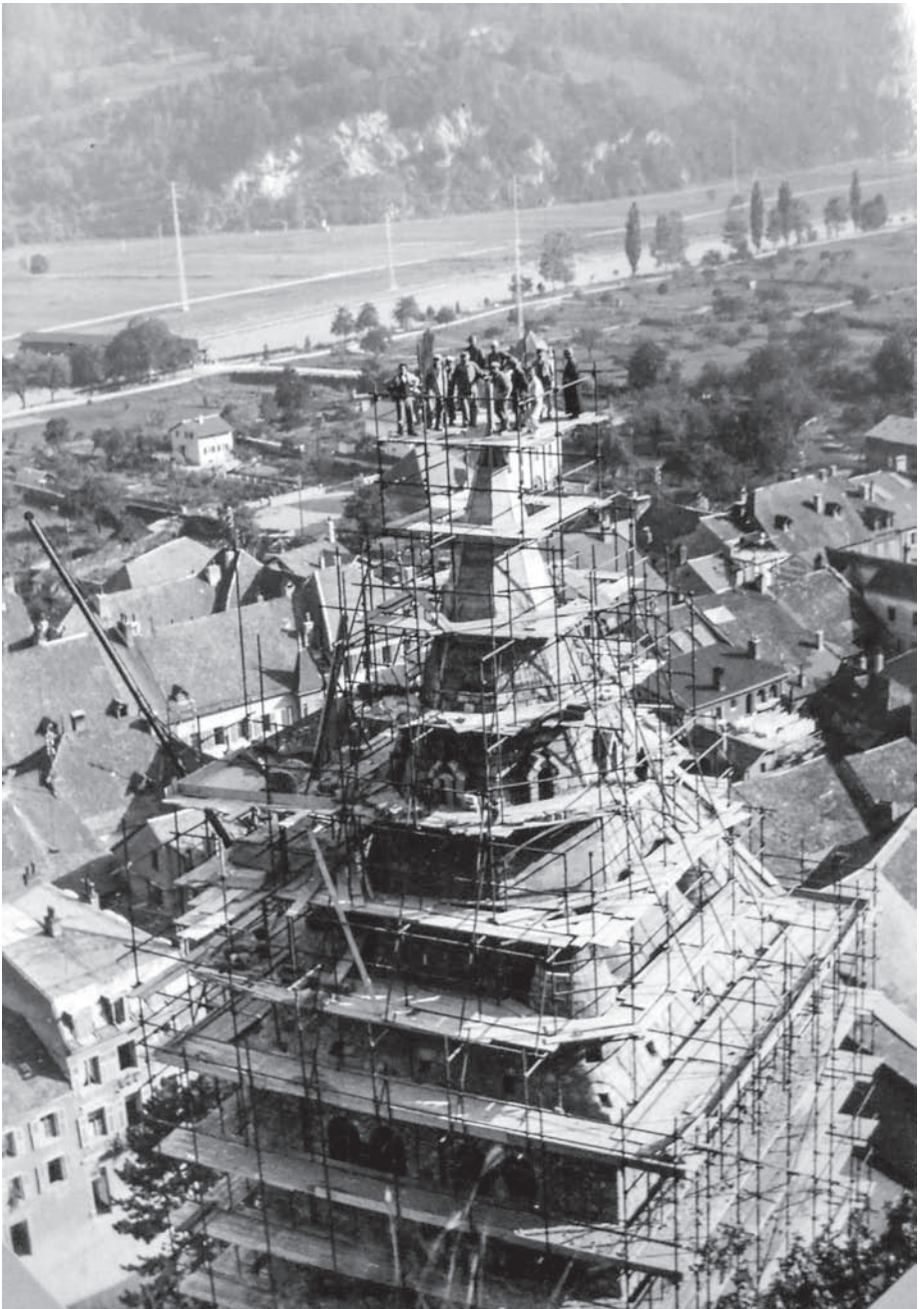
La reconstruction de la tour romane (1946-1949).