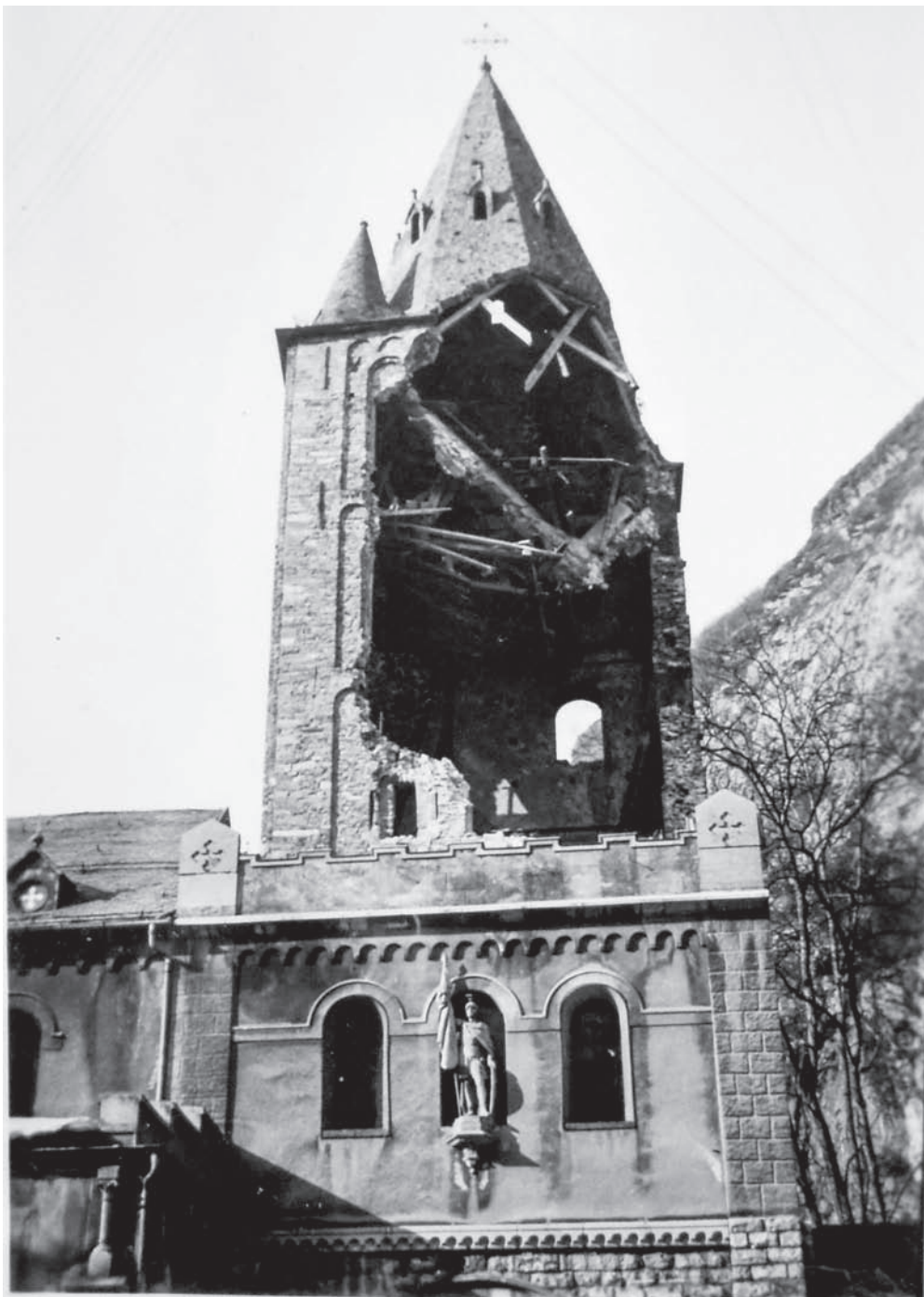
La tour de l'abbatiale, détruite par l'éboulement du 3 mars 1942.