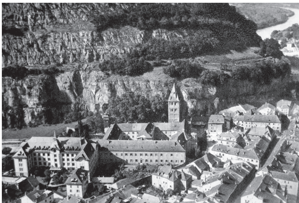
Vue aérienne de l'abbaye et du collège de Saint-Maurice d'Agaune en Suisse.