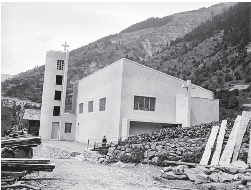
La première église moderne du Valais: Notre-Dame-du-Bon-Conseil de Lourtier, conçue par l'architecte Alberto Sartoris, 1933 (© Emil Hess, Médiathèque Valais – Martigny).