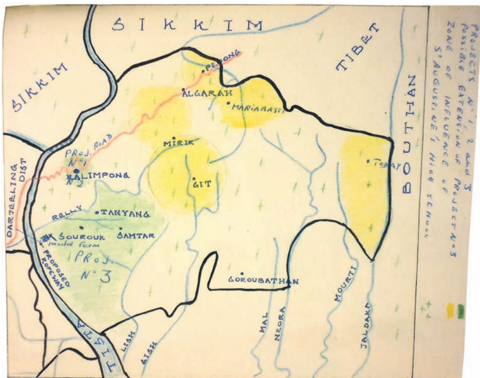
Dessin de 1963 de la région de Kalimpong avec les trois projets de développement imaginés par les chanoines: la construction d'une nouvelle école (1) et l'extension d'une ferme modèle (2) à Kalimpong, ainsi qu'un téléphérique sur la Tista (3).