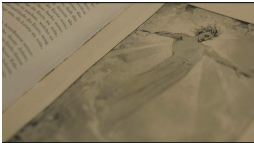
Fig. 12: Imagen de Wakolda .

momentos, estaba buscando a Adolf Eichmann y al médico alemán —Josef Mengele—. Mengele/alias Gregor, finalmente consigue persuadir al padre Enzo, para que fabrique muñecas en serie.