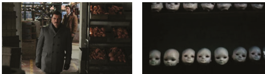
Fig. 14/15: Imágenes de Wakolda .

masiva de individuos, promovida por el nazismo” (Heffes/Bertone 2015: 120) ya que “la imagen plasmada en esas muñecas perfectas, rubias y de ojos celestes, representa [...] el imaginario anatómico que identifica a los pueblos arios” (Heffes/Bertone 2015: 131). 15