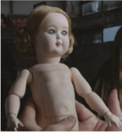
Fig. 6: Imágenes de Wakolda : prototipo de una muñeca aria/Herlitzka.