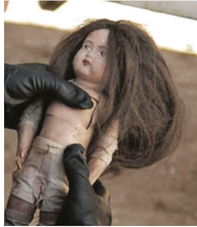
Fig. 7: Imágenes de Wakolda : la muñeca mapuche Wakolda.

Ya el título de la película Wakolda indica el tema de la otredad, de lo marginal, de lo no normal, el tema de la rebeldía contra las normas e ideas (eugenésicas) supuestamente normales pero/y en este caso pervertidos. Se refiere también a una mujer indígena, compañera de un líder guerrero del pueblo mapuche: