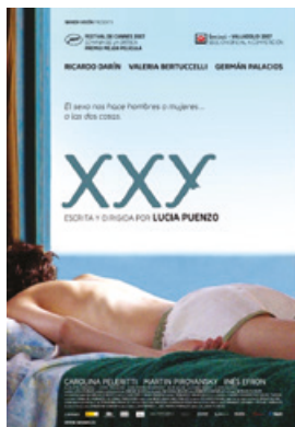
Fig. 3: Cartel de la película XXY .