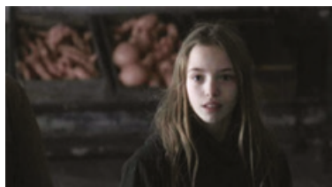
Fig. 9: Imágenes de Wakolda : Lilith.