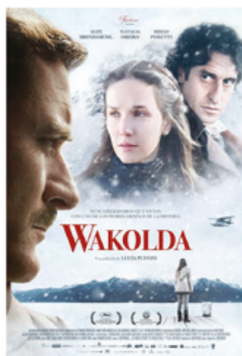
Fig. 5: Cartel de la película Wakolda .