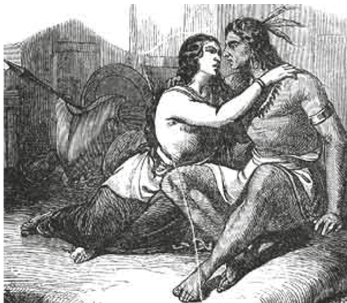
Fig. 8: Ilustración de D. Alonso de Ercilla y Zúñiga: La Araucana , Madrid 1884.

cabeza hacer una muñeca con un corazón mecánico, le gustaba que fueran todas distintas. ¡A mí también! Por eso elegí a Wakolda, era la más rara de todas, igual que yo” (Puenzo 2013a). Aquí, Puenzo nos presenta un elogio humano de la diferencia, de la diversidad, de la individualidad.