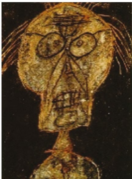
Fig. 1: Jean Dubuffet: Dhôtel nuancé d'abricot , 1947.