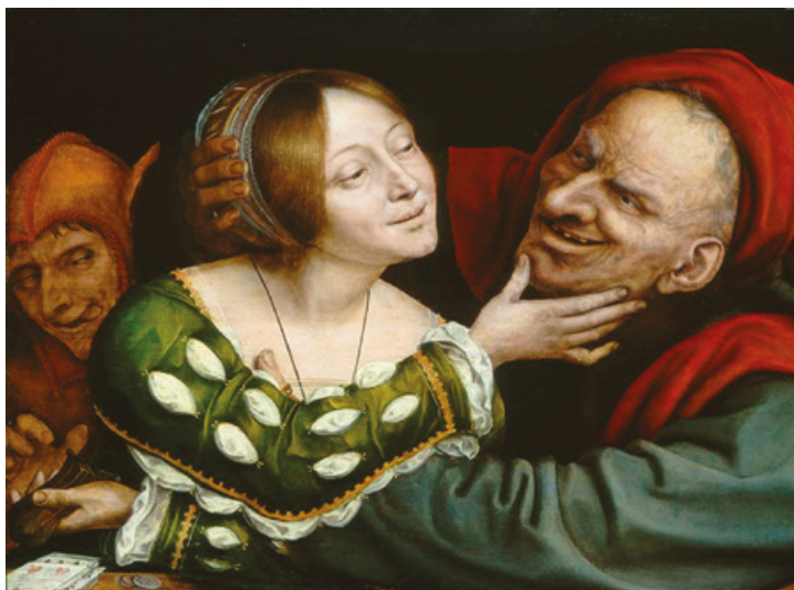
Fig. 13: Quentin Massys, Matched Lovers (ca.1520–25).

de la fealdad empezando con la obra temprana de Karl Rosenkranz ( Ästhetik des Häßlichen , Königsberg 1853) pero pocos estudios académicos sobre la relación entre estética y discapacidad. La presentación de la fealdad y de lo grotesco, la figura discapacitada o deformada, en el arte se utilizaba en primer lugar para resaltar la belleza del protagonista, 13 para “causar temor o sumisión” y “marcar un aspecto que se salía de la cotidianidad” (Senent Ramos 2010: 36).