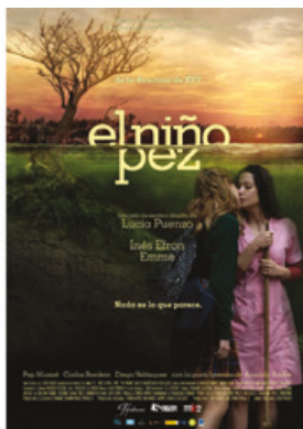
Fig. 4: Cartel de la película El niño pez .