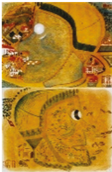
Fig. 2: August Natterer: Hexenkopf , aprox. 1915.

como mano de obra, ahora serán elogiados por su ser diferente. En la historia de la diversidad funcional esto significa una cesura de gran importancia en un sentido estético, social y cultural.