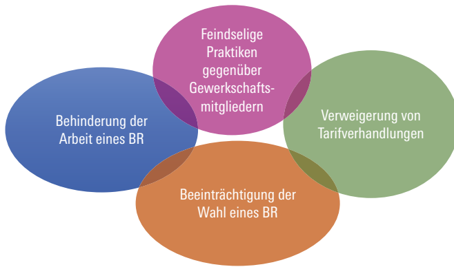
Abbildung 1: Schwerpunkte der Behinderung der Mitbestimmung im Betrieb