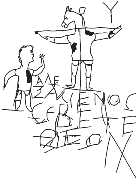
Abb. 2. Spottkruzifix vom Palatin. Nachzeichnung

verspotten. Es gibt eine doppelte blasphemische Spitze dabei: die Anbetung eines Gekreuzigten und die Anbetung eines Eselsköpfigen. Im deutschen Sprachgebrauch ist oft die Rede vom ‚Spottkruzifix‘, in anderen Sprachen ist es als ‚blasphemische Kreuzifix‘ bekannt. Um Missverständnissen und Enttäuschungen vorzubeugen: Ich möchte mich im vorliegenden Beitrag keineswegs gegen die geläufige Interpretation wenden. Vielmehr möchte ich versuchen, dem beschriebenen Graffito durch sorgfältige Kontextualisierung neue – im Sinne von: mehr – Aussagen abzugewinnen. Das Graffito wird, wie schon gesagt, sehr häufig abgebildet und angesprochen, aber fast immer im Umfang von wenigen Zeilen und kaum je mit irgendwelcher Kontextinformation – außer vielleicht einem Datierungshinweis. Die communis opinio setzt die Kritzelei meist ins 3. Jahrhundert, oft eher zu dessen Beginn als an dessen Ende.