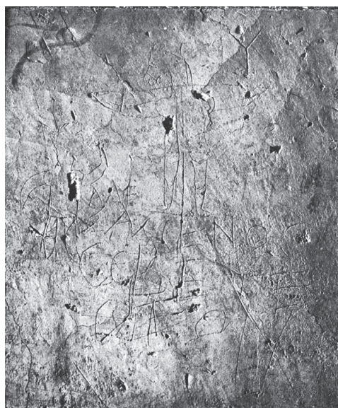
Abb. 1. Spottkruzifix vom Palatin. Fotografie mit Seitenlicht

fälschung ist dann schnell überschritten 2 . Besser sollte man, wie schon in der Erstpublikation von 1856, mit Nachzeichnungen arbeiten (Abb. 2) 3 . Sie lassen gut erkennen, worauf es ankommt, und sind doch eindeutig im Blick auf ihren Status.