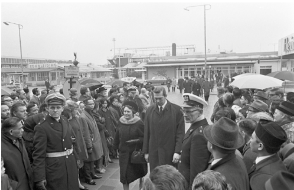
Het stoffelijk overschot van Sutan Sjahrir wordt op 16 april 1966 met een tussenstop op Schiphol naar Jakarta overgevlogen. Vele Nederlanders, zoals premier Barend Biesheuvel, krijgen zo de gelegenheid hem op de luchthaven de laatste eer te bewijzen.

Ook andere kranten onderkenden met terugwerkende kracht de betekenis van deze 'grote Indonesische zoon en waarachtig vriend van Nederland'. 33 Zo schreef De Tijd : 'Vandaag begrijpt menigeen dat Sjahrir gelijk had en dat Nederland heeft verzuimd zijn geestverwanten aan te bieden wat Nederland later na het geweld eenvoudig is afgedwongen'. 34 Sjahrir overleed in Zwitserland waar hij na zijn vrijlating uit de Indonesische gevangenis was gaan wonen. Het vliegtuig dat hem naar Jakarta zou brengen maakte op Schiphol een tussenstop. Vele Nederlanders, onder wie vicepremier Barend Biesheuvel (ARP), ministers Joop den Uyl (PvdA) en Ivo Samkalden (PvdA) en tal van Kamerleden, namen geëmotioneerd afscheid van een man die bij het sluiten van het akkoord van Linggadjati in Nederland diep werd gewantwoord. De belangstelling was zo groot dat de meeste aanwezigen buiten in de regen moesten wachten. 35