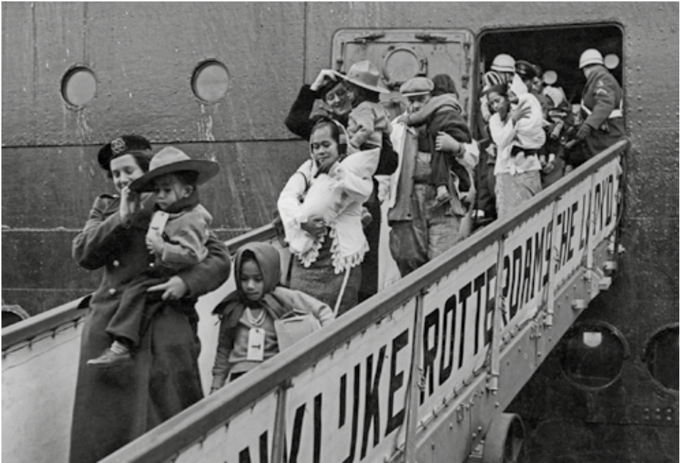
Molukse gezinnen komen op 21 maart 1951 aan met het schip de Kota Inten in het koude Nederland in de overtuiging dat zij ooit weer terug naar de Molukken zullen gaan.

de kwestie in een onverwachte richting duwde. In een kort geding, aangespannen door Molukse militairen op Java en financieel gesteund door Nederlanders die zich tegen de Indonesische onafhankelijkheid bleven verzetten, werd een verbod gevraagd op hun demobilisatie in Indonesisch gebied indien zij dat niet wensten. Dit leverde volgens hen levensgevaar op voor de militairen en hun gezinnen. De Haagse rechter stelde de eisers in het gelijk. Dat vonnis werd een maand later door het hof bevestigd en de Hoge Raad wees op 2 maart 1951 het beroep van de staat af.