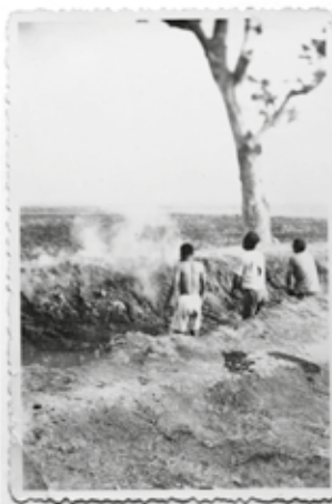
Drie Indonesiërs worden beschoten. Rechts: doden in een greppel, twee Nederlandse soldaten kijken toe.

De geraspioneerde historici twifelen niet aan de echtheid. De exacte plaats noch de toedracht van de exe-