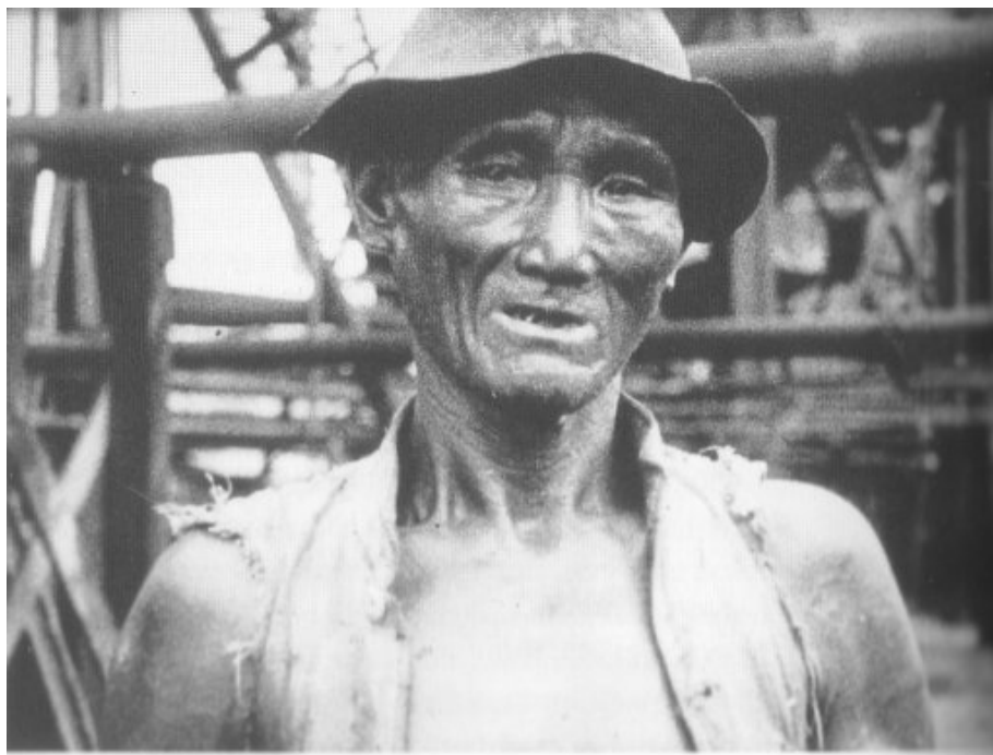
Szene aus Moeder Dao .

An verschiedenen Stellen tauchen Verkündiger des Wortes Gottes auf, beeindruckende Priester und Missionare, hinausragend über heidnische oder gerade erst bekehrte Seelen; zu sehen sind ein Atelier von Heiligenbildern im Urwald und ein kleines Missionsorchester. Und ab und zu ganz plötzlich die koloniale Familienszene, eine Teerunde im Garten, fröhlich lachende weiße Menschen und hüpfenden Kindern – ein Bild, welches im niederländischen visuellen Gedächtnis so prominent vertreten ist, dass wir vergessen haben, dass dies nicht das Zentrum, sondern ein beschützter, entlegender Winkel der kolonialen Gesellschaft war. Die Bilderflut ist groß – viele Details, die man so leicht nicht vergisst, wie eine Krokodiljagd, einen weißen Mann, der von seinem Esel ins Wasser fällt, einen Missionar, der auf einem hohen Stein stehend die Wahrheit verkünden kommt, das zweijährige Kind an der Brust einer Mutter, die plötzlich in die Kamera blickt und an einer Zigarette zieht.