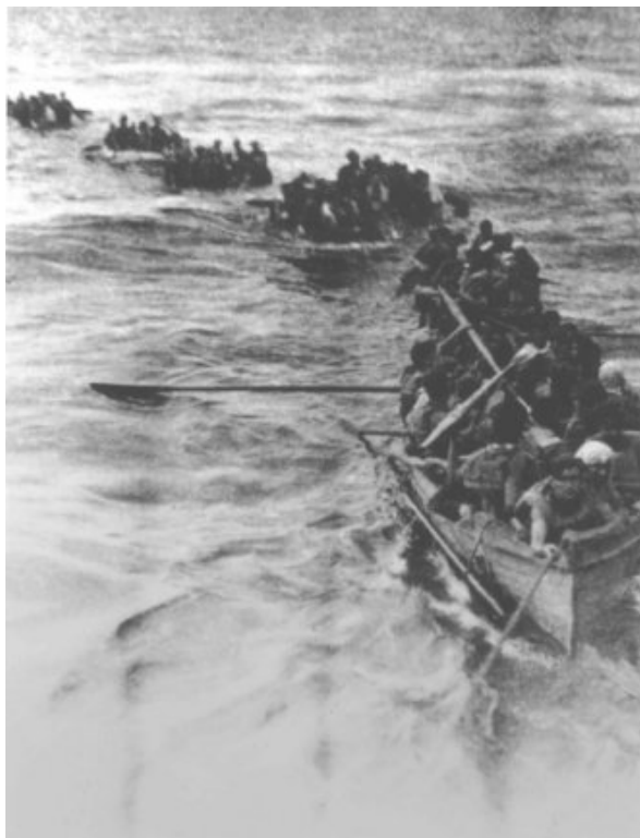
Szene aus dem Film De Slag in de Javazee , 1995, Regie: Niek Koppen.

Besatzung widmet. Zwei weitere Beispiele stellen die zweiteiligen Sendung Veertig jaar na dato: Nederlands-Indie (1985) (Vierzig Jahre nach dato: Niederländisch-Indien) und die Dokumentation De Slag in de Javazee (1995) (Die Schlacht in der Javasee) von Niek Koppen dar.