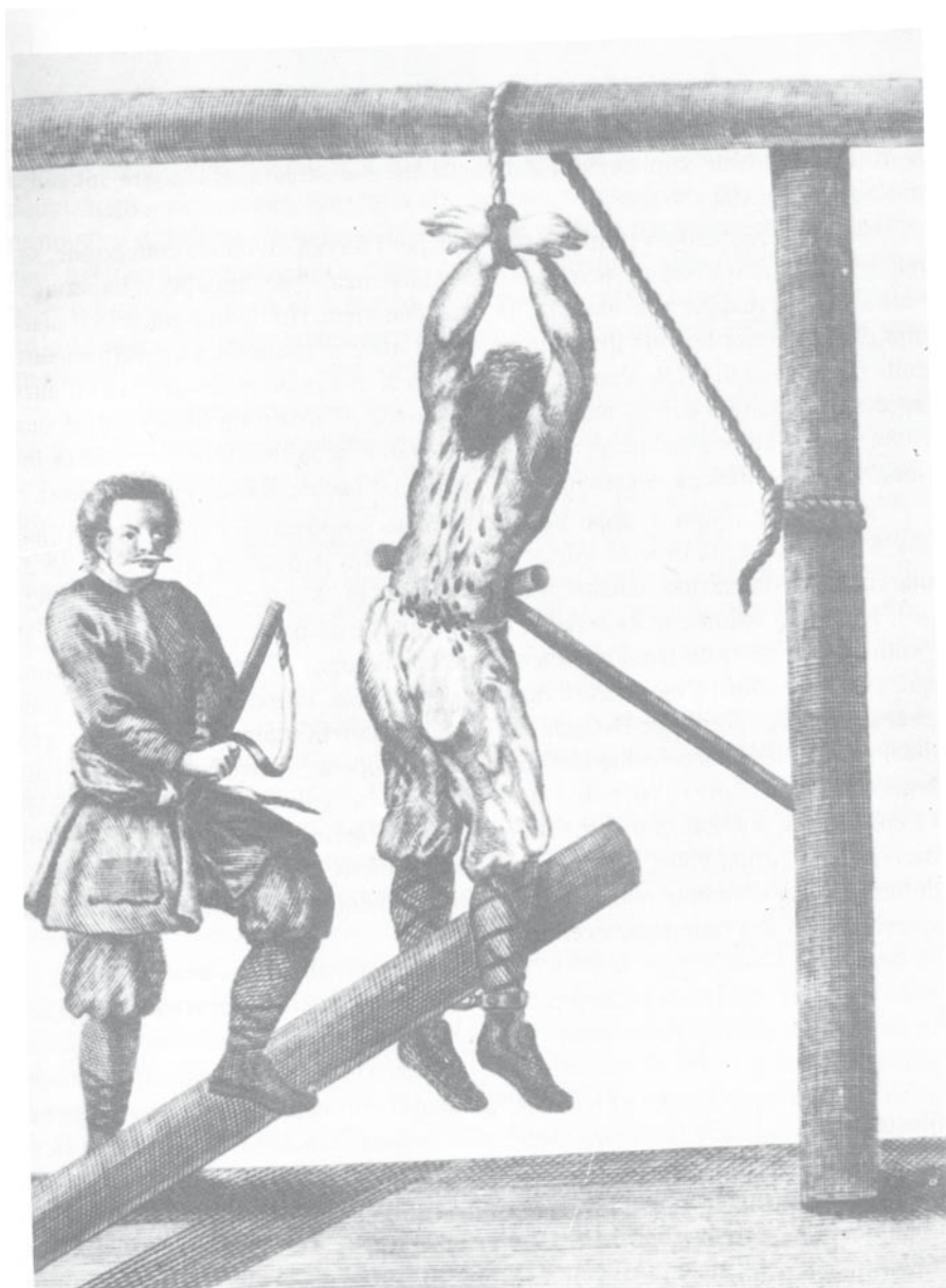
1. Knut