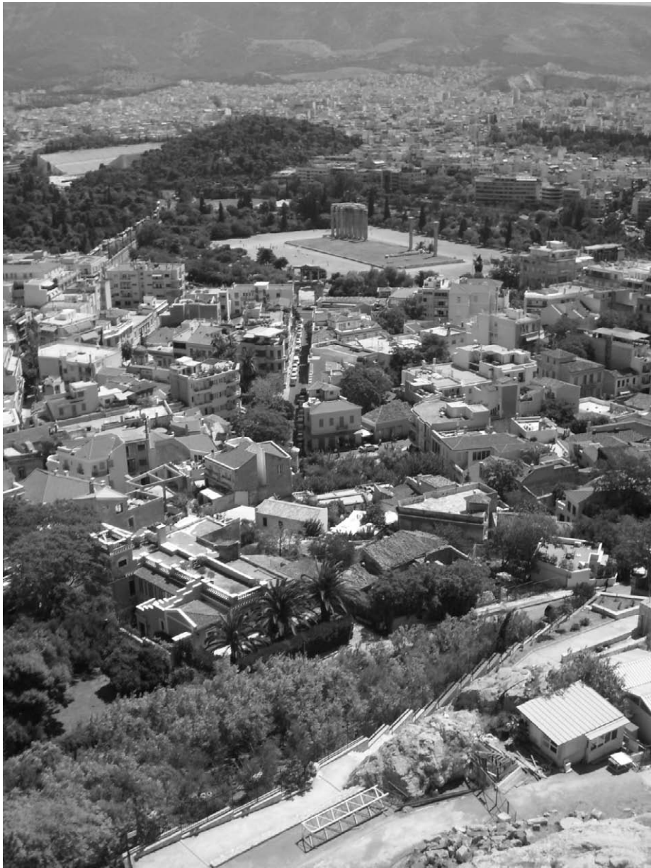
Fig. 13. Alineación acrópolis, arco de Adriano, Olimpieion, Ilissos, demos de Adrianois.