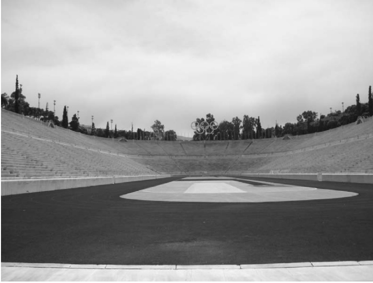
Fig. 8. Ubicación del estadio del Panatenaico construido por Herodes Ático. Atenas