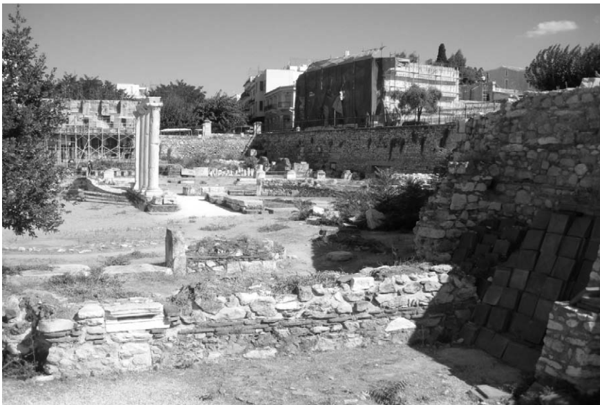
Fig. 17. Biblioteca de Adriano. Atenas.