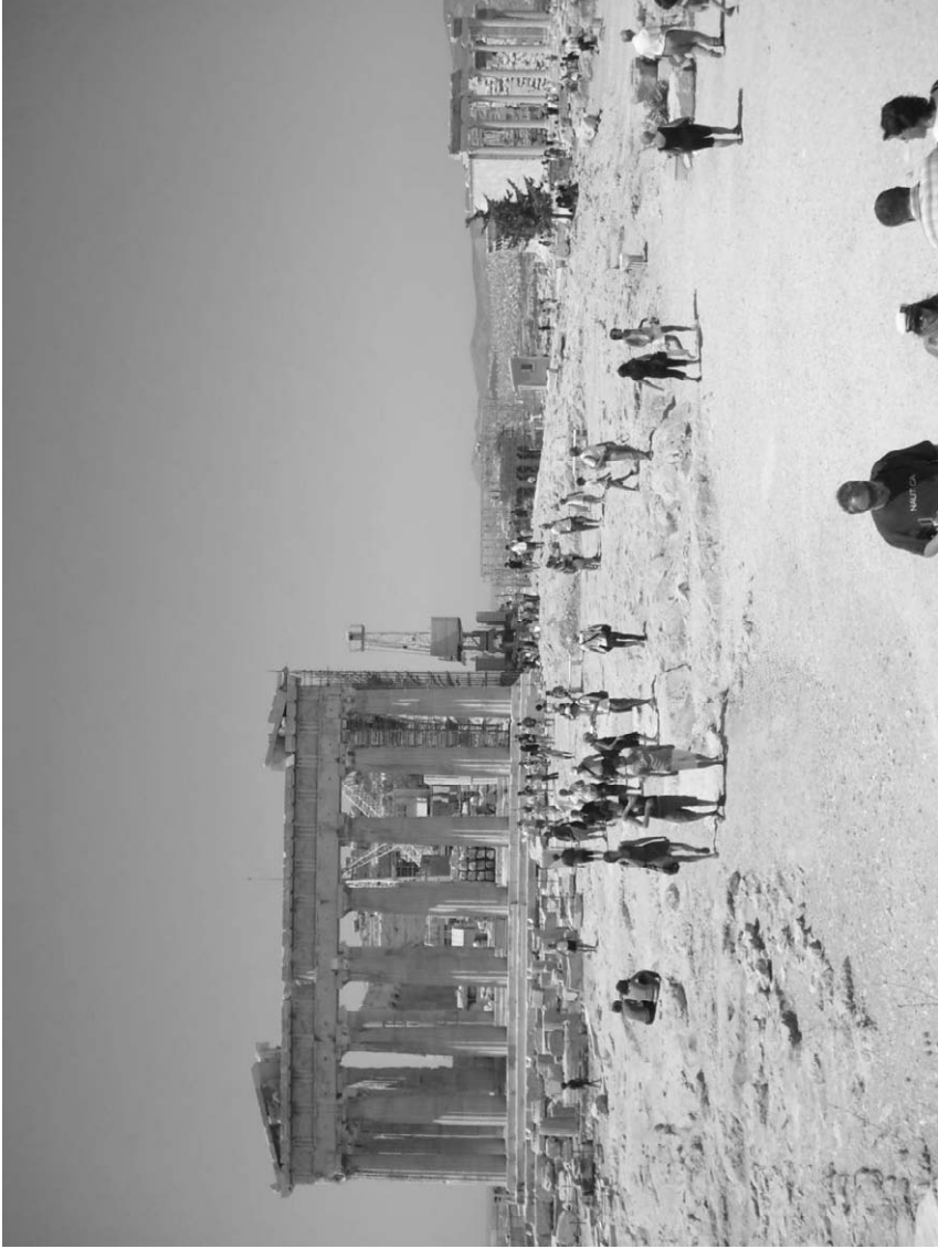
Fig. 12. Acrópolis de Atenas. Partenón, Erecteion y templo de Augusto y Roma.