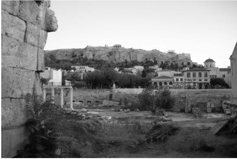
Fig. 18. Situación de la biblioteca de Adriano. Atenas.