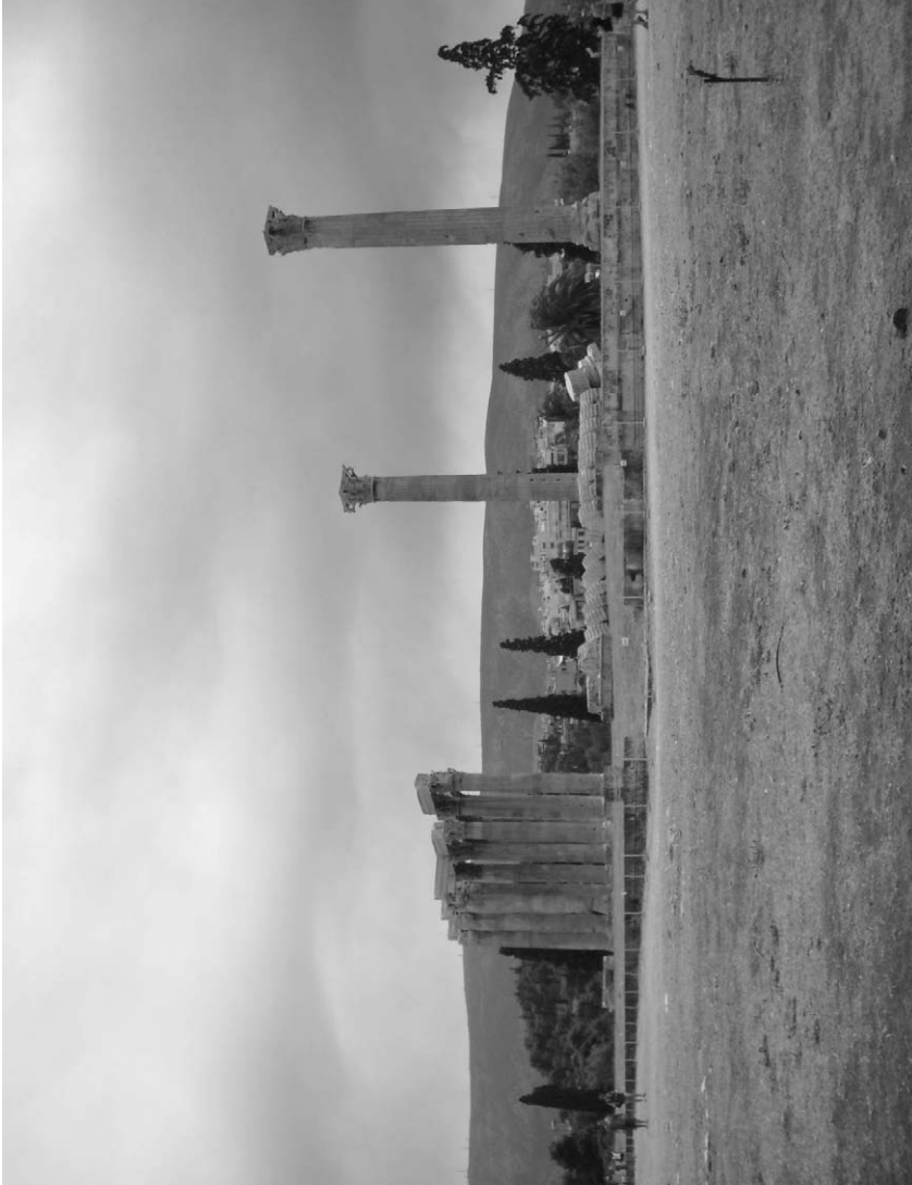
Fig. 5. Olimpieion, Atenas.