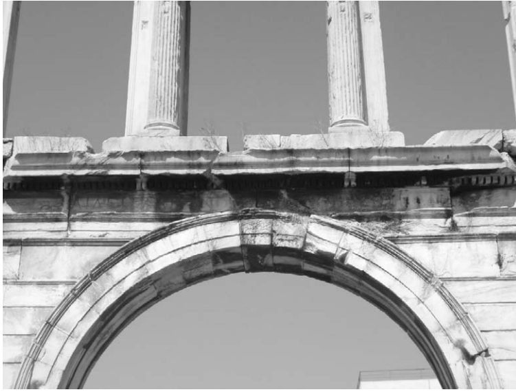
Fig. 2. Detalle del friso oriental. Inscripción de referencia a Adriano.