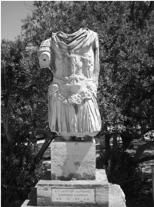
Fig. 15. Toracata de Adriano. Ágora antigua.