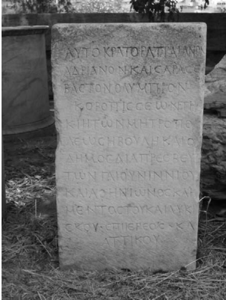
Fig. 6. Basa de dedicación a Adriano asociado a Zeus Olímpios. Olimpieion. Atenas.