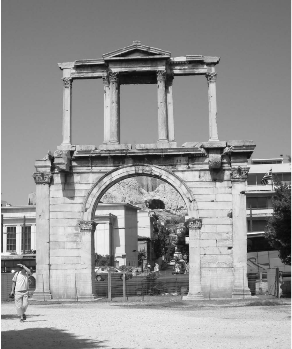
Fig. 1. Arco de Adriano. Atenas.