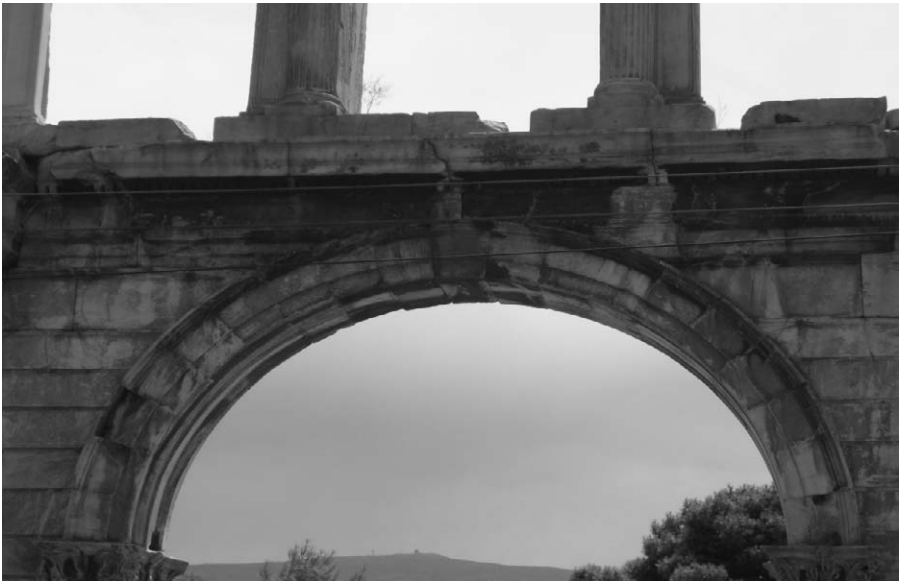
Fig. 3. Detalle del friso occidental. Inscripción de entrada al nuevo demos de Adriano.