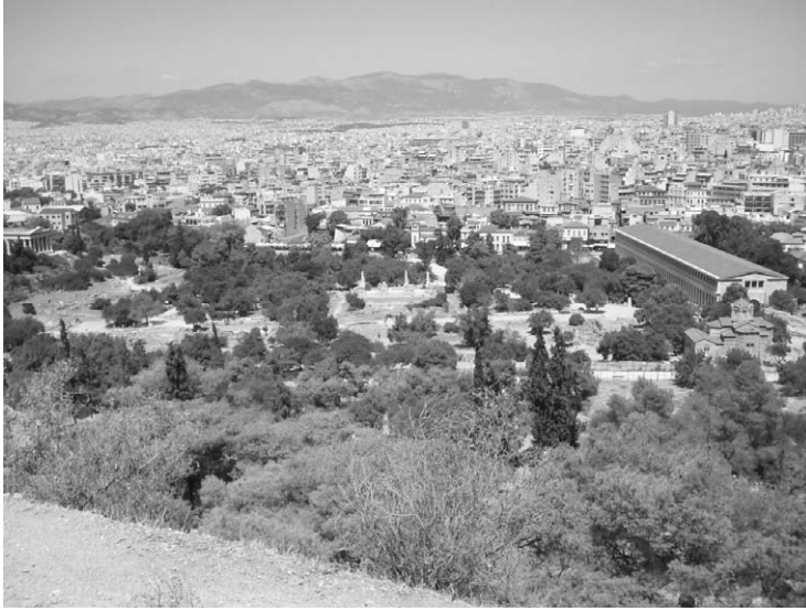
Fig. 14. Vista panorámica del ágora antigua de Atenas.