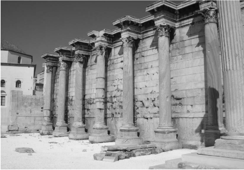
Fig. 16. Biblioteca de Adriano. Atenas.