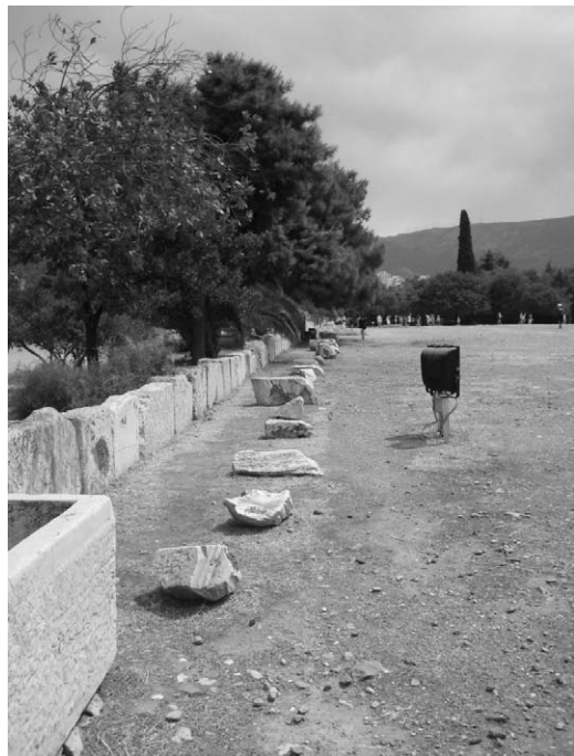
Fig. 7. Peribolos del templo de Zeus Olímpico.