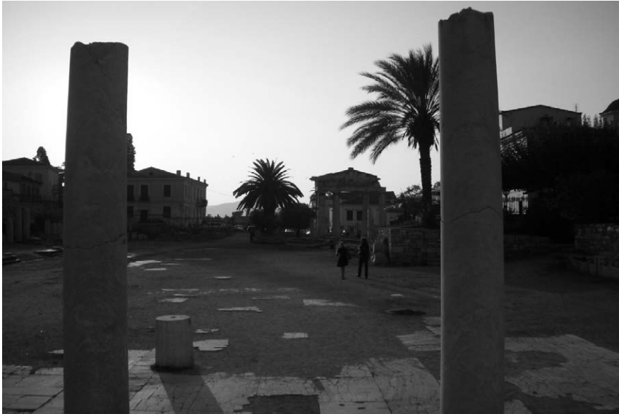
Fig. 19. Ágora romana. Atenas.