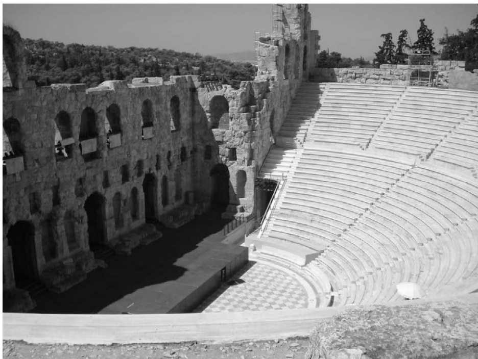
Fig. 10. Interior del teatro de Herodes Ático.