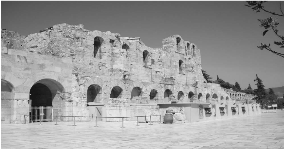
Fig. 9. Fachada del teatro de Herodes Ático.