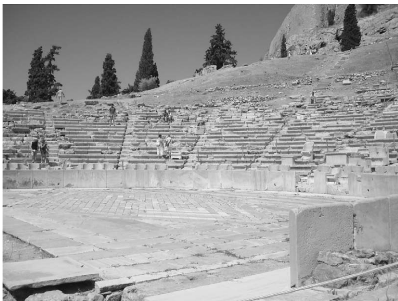
Fig. 11. Teatro de Dionisos. Atenas.