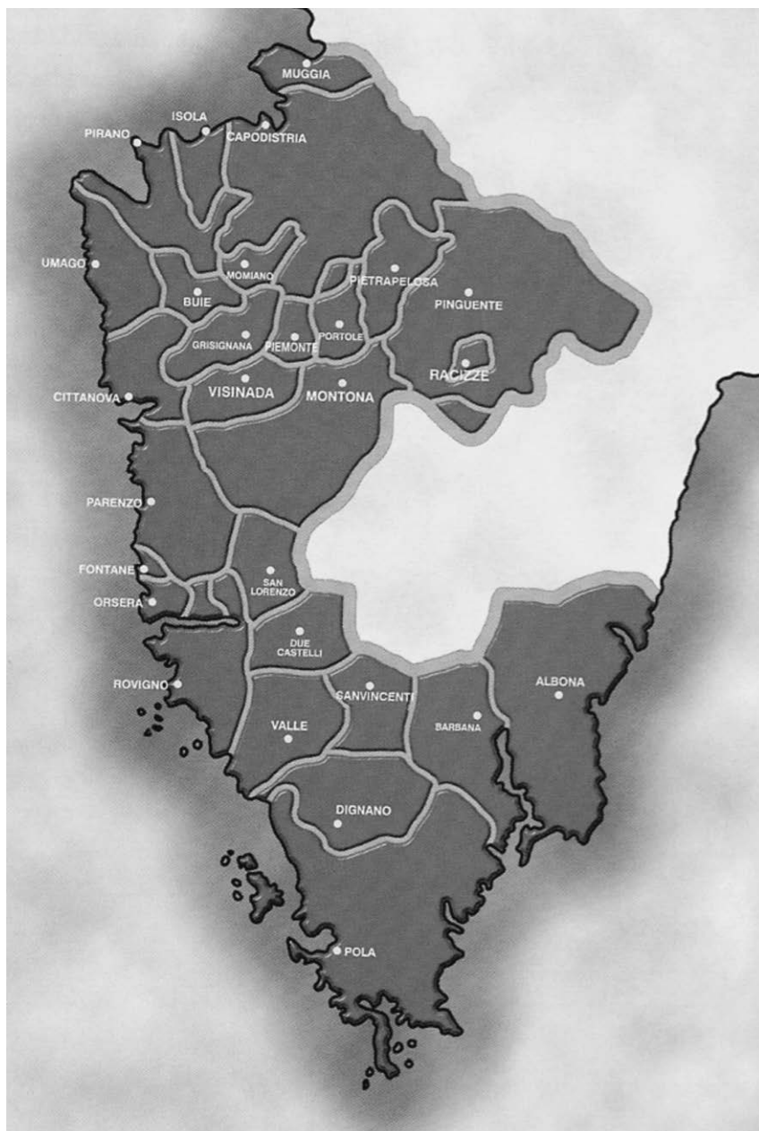
Fig. 2. L'Istria veneta e asburgica (parte chiara) post 1535 (da Istria nel tempo , p. 317).