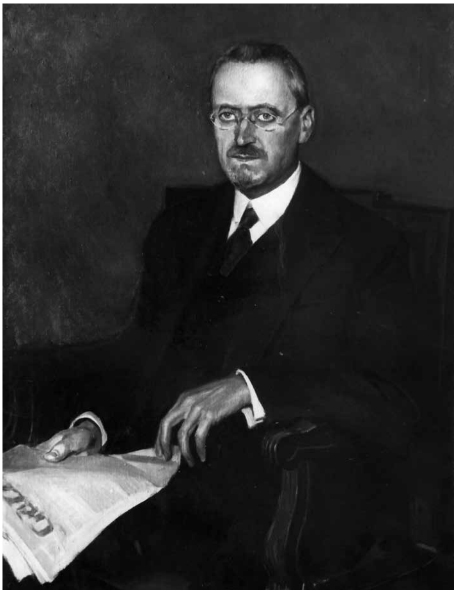
Fig. 3. Ritratto di Luigi Schiaparelli del pittore Guglielmo Ghini, 1933.

389, del 26 ottobre del 1915, in cui Cipolla diede un sunto dell'ultimo corso che aveva tenuto a Firenze dettandolo alla figlia, come si evince da un confronto con la grafia della lettera che chiude l'epistolario (n. 414 del 18 novembre 1916), in cui quest'ultima comunicò allo Schiaparelli che il padre pochi giorni prima