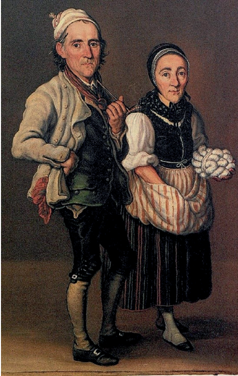
Abb. 2: Ulrich Bräker und Salome Ambühl; Bildquelle: Bernisches Historisches Museum, Bern.

Streitbeziehung, was er nicht zuletzt an ihrem Unverständnis für sein Interesse an Dichtung und Literatur auf Kosten von Erwerb und Arbeitszeit festmacht. Aus den beiden sollte kein ‚Bildungspaar‘ werden.