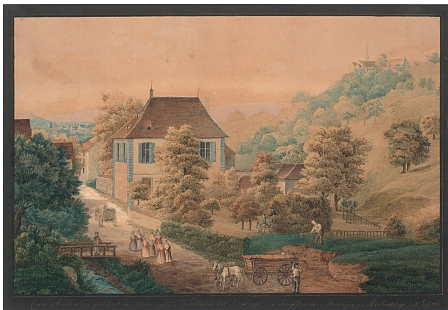
Abb. 12: Anonymus: Pfarrhaus Binningen 1842; Bildquelle: Kantonsmuseum Baselland, Liestal.