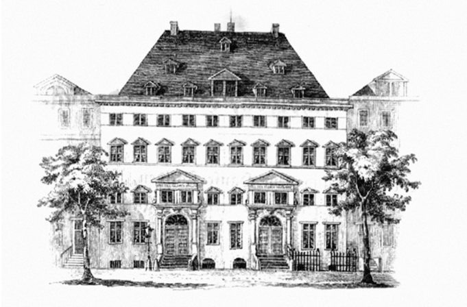
Abb. 9: Wohnhaus der Familie Beneke (rechte Hälfte), Hamburg, Holländischer Brook 67; Bildquelle: Otto Beneke, Liederkranz zum Andenken an das alte Beneke'sche Haus, Hamburg 1849.