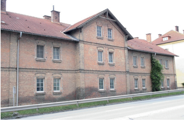
Abb. 20: Wien-Inzersdorf, Triester Straße 16–20, Arbeiterhaus vor dem Abriss 2016

von den Notwendigkeiten der Subsistenz bzw. der Existenz bestimmt. Die Kinder sind zuerst und primär Arbeitskräfte.