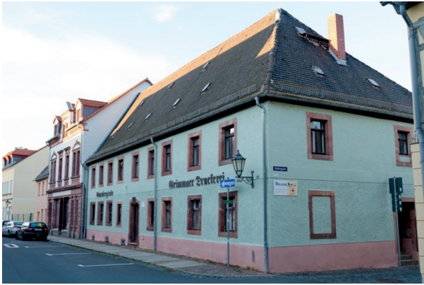
Abb. 14: Das Gebäude der Druckerei in Grimma, Frauenstraße, heute