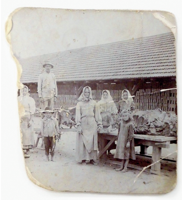
Abb. 19: Ziegelschlägerfamilie in Vösendorf, barfuß bei der Arbeit