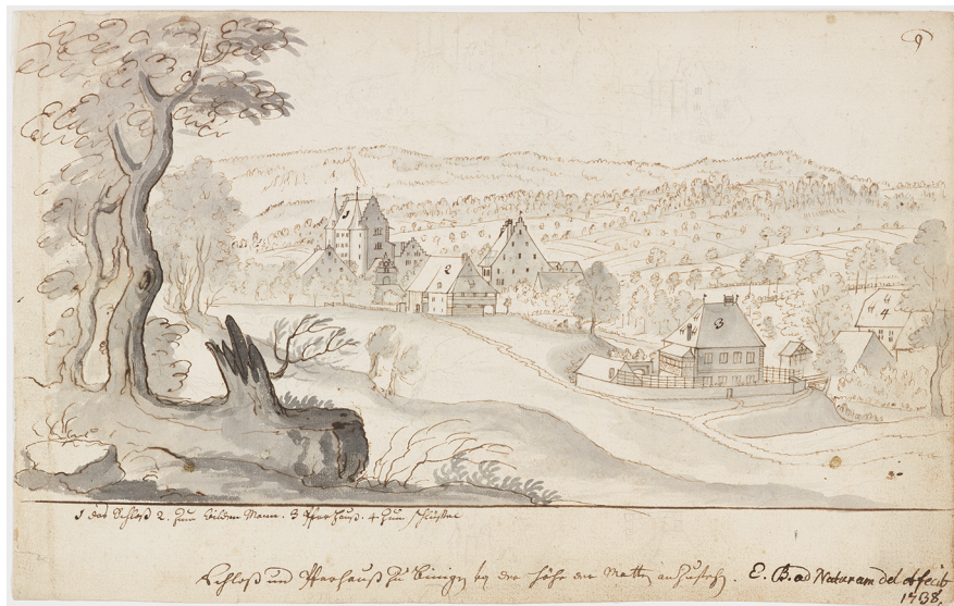
Abb. 11: Emanuel Büchel: Schloss und Pfarrhaus (Nr. 3) Binningen 1738; Bildquelle: Staatsarchiv Basel-Stadt, Bild_Falk_Fb_2,7.