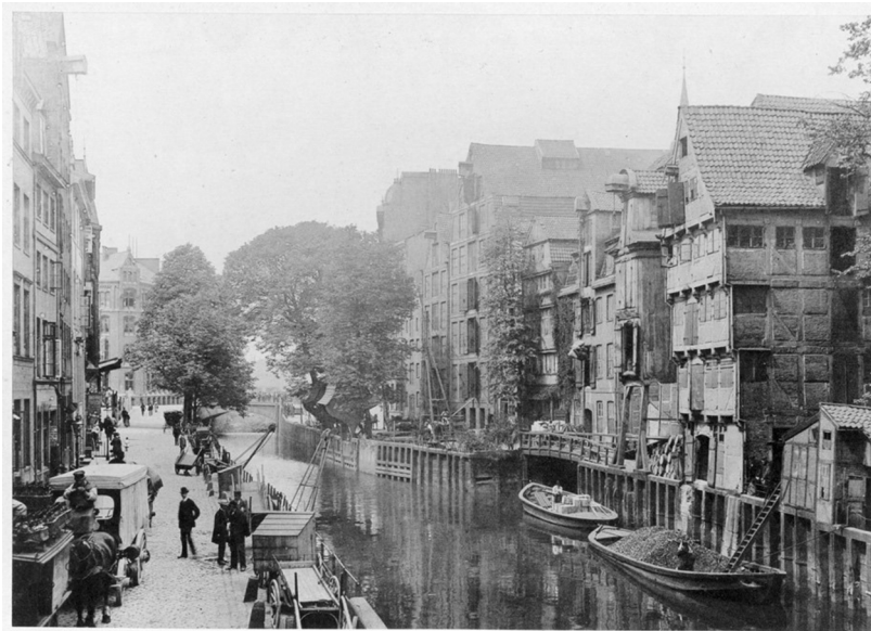
Abb. 10: Holländischer Brook nach Westen; Benekes Wohnhaus befand sich auf der linken Seite; Bildquelle: Bernd Nasner.