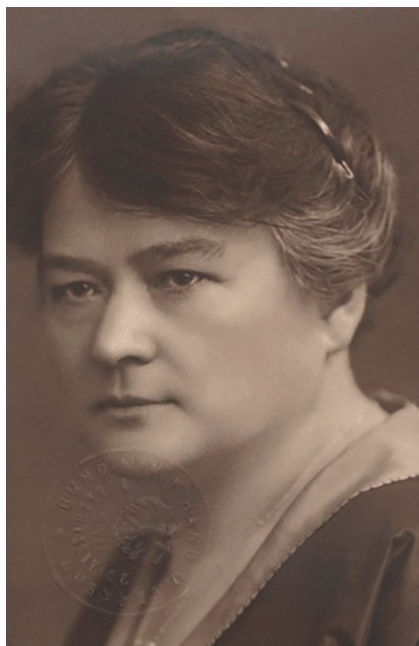
Abb. 18: Adelheid Popp, geb. Dwořak; Bildquelle: Wikimedia Commons.

den. 24 Die Taufpaten der Dwořak-Kinder sind Weber. Auch Adelheids Taufpatin ist eine Weberfrau mit böhmischen oder slowakischen Wurzeln, die nicht ihren Namen schreiben kann. 25 Sicher ist zudem, dass Adelheid Dwořak in Verhältnissen aufwächst, die man keinem Menschen wünschen möchte. Die Wiener Textilindustrie befindet sich seit Mitte der 1850er Jahre in einem schnellen Niedergang. Durch die bauliche Stadterweiterung boomt aber die Ziegelproduktion. Die Ziegelfabrik des Vororts Inzersdorf (Vösendorf) am Wienerberg ist mit Abstand die größte im Raum Wien. 26 Sie beschäftigt mehrere tausend Arbeiterinnen und Arbeiter. Vielleicht hoffte das Ehepaar Dwořak, in der Ziegelfabrik Arbeit zu finden und zog deswegen nach Inzersdorf. In dem kleinen Ort treffen zwei Welten aufeinander: auf der einen Seite ein ländliches Idyll und Ausflugsziel der Wiener Gesellschaft, auf der anderen Seite die Quartiere der schlecht beleumundeten Arbeitsmigranten. Die enorme Expansion der Ziegelfabrik wird flankiert durch den Bau billiger Arbeiterbehausungen. Alteingesessene ‚Dörfler‘ und zugezogene ‚Ziegelböhmi‘ leben in direkter Nachbarschaft und nehmen doch kaum Notiz