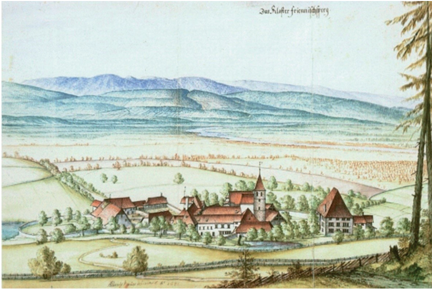
Abb. 7: Amtssitz der Landvogtei Frienisberg (Bern) um 1670