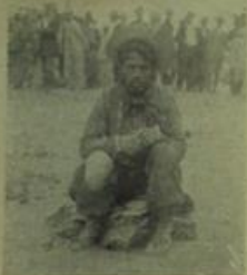
Alberto Martí, bandoleero chileno, celebra en su país y en el nuestro