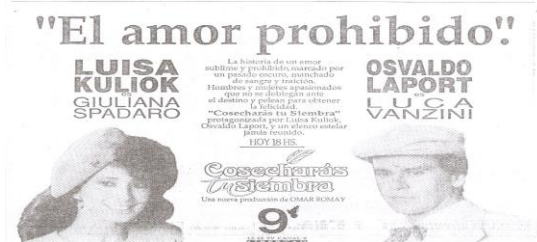
Imagen 1. Publicidad en sección “Política” del diario Clarín , (2/9/1991: 11)

En Italia, fue doblada y emitida en 1992 a través de la cadena de televisión privada Rete 4 en un momento en el que el género se encontraba en franca decadencia: