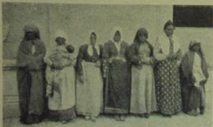
El feminismo de la partida