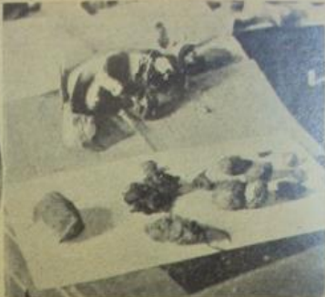
Cabera de toros, que el capitanejo Vila pretendía hacer pasar por cabera de guanaco