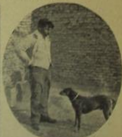
El perro del comisario Torino, que no habla francés, pero francés en la ronda