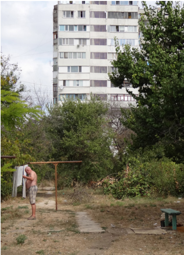
49 Mann mit Wäsche, Tatjana Hofmann 2015.

Wie aufgeschlagene Seiten im Ausmalbuch, die darauf warten, dass sich jemand ihrer annimmt. Topoloroides Kolorit.