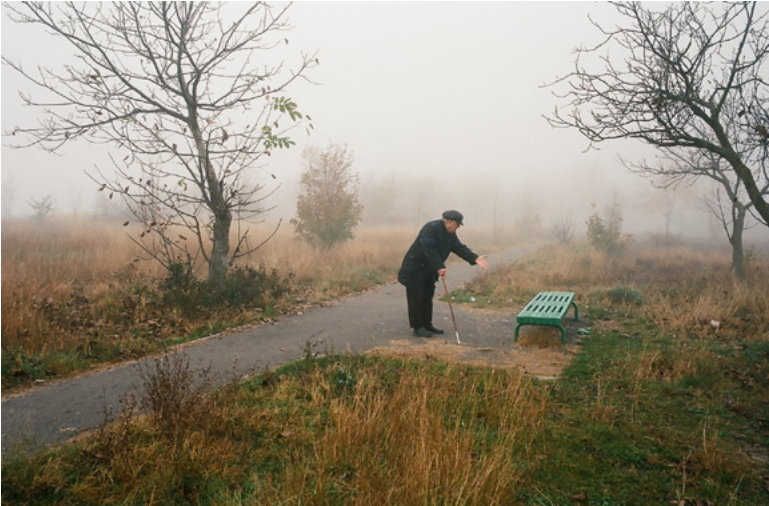
50 Mann und Bank, Tschatyr-Dag, Alexander Barbuch 2015.

Nein, mit jedem Schritt eignest du dir deine Pappelstadt an, in deiner kleinen Chronologie. Eine Stadt auf dem Kühlschrankschrankmagneten, neben anderen, obwohl deine Reise diese Zone, diese Insel, nicht vor- sieht. Einfacher wäre es, sie zur verschlossenen Stadt zu erklären.