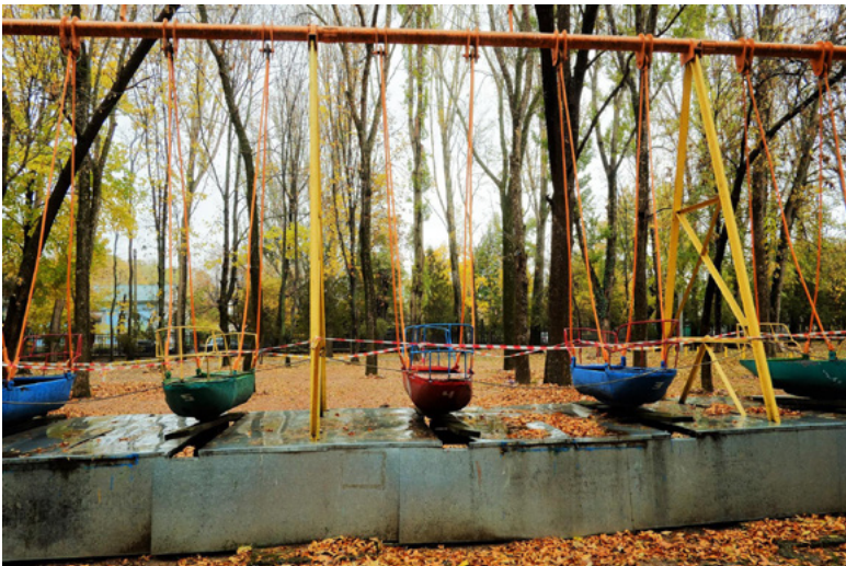
7 Kinderpark im Herbst, Simferopol, Alexander Barbuch 2017.

Cyril hatte verschiedene Objekte dabei. Gefilmt hat er mit einer unauffälligen Kamera, die für einen Fotoapparat gehalten wurde. Wenn die Polizei uns auf der Straße anhält, dann, haben wir vereinbart, texte ich sie zu, ich sei von da, von hier, ich zeige ihm meine Heimat.