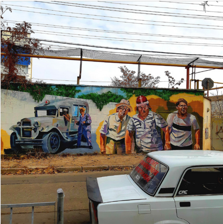
9 Graffiti mit einer Szene aus der Komödie Havkazskaja plennica (1967), eine Episode wurde neben dieser Wand gedreht, Simferopol, Alexander Barbuch 2020.

der Krimtataren, Deutschen, Schweizer, Bulgaren und anderer? Auch die Nichtdeportierten litten an seinen Maßnahmen, es gab von ihnen genug für alle in der gesamten Union. Unabhängig von ihrem Wohnort waren Sowjetbürger von Repressionen betroffen und waren zum Teil auch Teil des ausführenden Systems. Nachträglich Schuld und Verantwortung nach der Ethnie, der aktuellen Staatsangehörigkeit oder der Primärsprache auseinanderzuidividieren, in Opfertataren, Opferukrainer und Täterrussen einzuteilen, das finden einige fair und einige nicht.