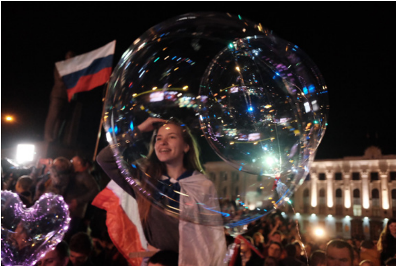
2 Feier des ersten Jahrestages des »Krimfrühlings«, Simferopol, Alexander Barbuch 2015.

Wie war das noch mal? Die Bevölkerung proklamierte 2014 mehrheitlich ihre Unabhängigkeit von der Ukraine. Dies drückte sie bei einem Referendum aus, dem ein freier Charakter von vielen Kommentatoren abgesprochen wurde. Vor dem Referendum entsandte Moskau zusätzliche Soldaten auf die Krim. 1 Eine öffentliche Diskussion über das Ob und Wie des Übertritts zur Russischen Föderation, ein Abwägen der Argumente dafür und dagegen, hat gefehlt. Ich lese: Im Resultat waren 97 Prozent für eine Angliederung an Russland, obwohl viele irregularities gemeldet wurden. Daraufhin hatte das Parlament in Simferopol den Antrag auf Aufnahme der Krim in die Russische Föderation gestellt, erfolgreich.