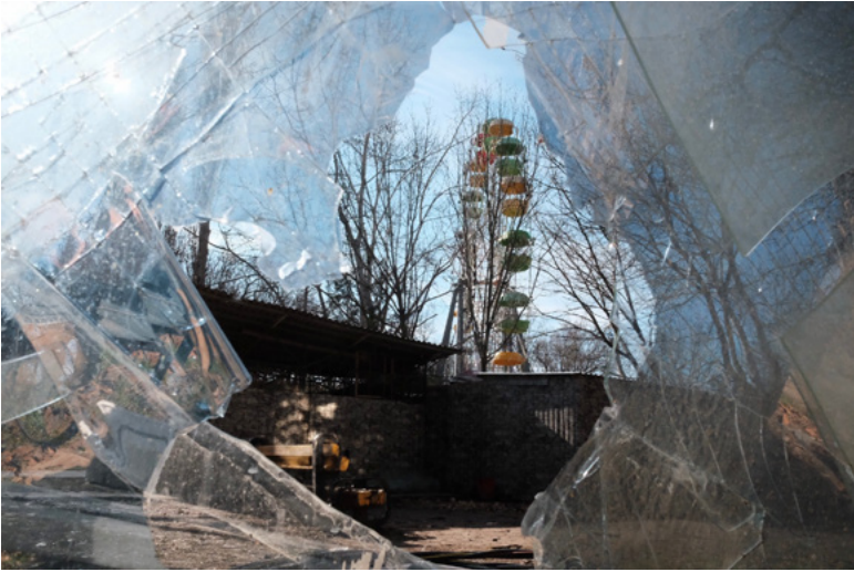
6 Das »Glücksrad« im Gagarinpark, Simferopol