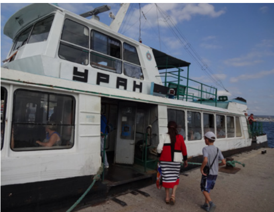
51 Schiffsverkehr, Tatjana Hofmann 2015.

G esagt – getan. Die Beine erweisen sich mal wieder klüger als der Kopf. Sie weisen den Weg zum Nachimow-Platz, hin zum Kosinäkiosk, schräg gegenüber vom berühmten Säulentor, hinter welchem die Treppe zum Meer führt. Fotos von der Treppe werde ich mir später anschauen, mein Vater steht auf einer der Stufen, diese Turnerfigur hat er noch mit über 70. Den Riegel in der einen Hand, das Herz in der anderen, hin zum Kutter, Metallwunder aus den 1990ern, obwohl schon damals alt. Wie die bauchigen Busse kursieren diese Schiffchen ohne Altersbegrenzung hin und her. Jedes von ihnen trägt einen Planetennamen, jedes heult los vor der Abfahrt. Jedes muss auf dem Pier am schwarzen Hocker von schnellen Händen an- und abgebunden werden. Der Schritt über den Spalt zwischen Anlegestelle und Bord, in dem das Meer dir in die Fersen beißen möchte, fällt mir diesmal kinderleicht.