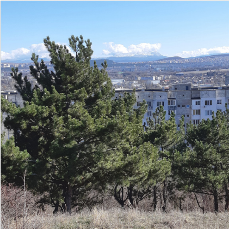
18 Sicht auf Tschatyr-Dag, Simferopol, Alexander Barbuch 2016.

europäische Ideengeschichte philosophiert, als ob sein Plattenbau in ihrem Mittelpunkt stünde.