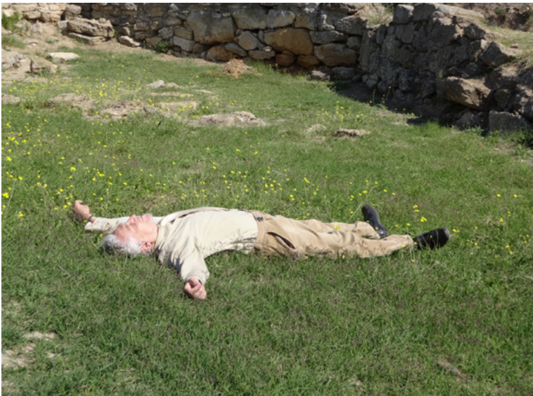
20 Ein Teilnehmer des Bosphorusforums im Gras, Tatjana Hofmann 2015.

Durch das mühsame Unterwegssein dorthin dämmerte mir: Ja, für solche Projekte braucht man Fantasie, Standhaftigkeit, Idealismus, plus eine Prise pofigizm : Pfeif darauf, was die anderen sagen, pfeif auf die Schlaglöcher. Rück nicht vom Fleck, auch wenn es ruckelt. Glaub an die Sinnhaftigkeit der Präsenz, auch wenn der Kopf sich umso mehr leert, je weiter wir vordringen.