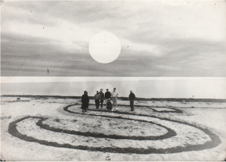
31 Geoglyph S, Andrej Kanischew 1993.