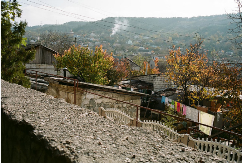
15 Herbstlandschaft mit Wäsche, Bachtchissaraj, Alexander Barbuch 2018.

geschirmtheit einer Bibliothek über die Krim lese, sondern die Krim lesen sollte, auf ihr, in ihr. So lange, wie die Auseinandersetzung damit laufen (stehen, kriechen, keuchen) möge.