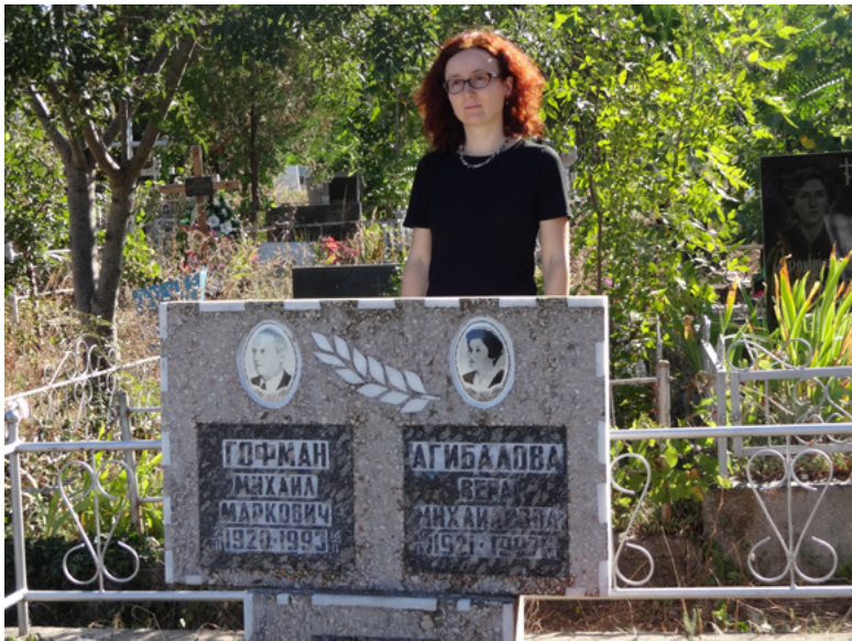
53 Am Großelterngrab, »privat« 2015.

lin bin ich auch gern gewesen. Unorte, große Parkanlagen mit vielen Geschichten, wenig Lärm und Müll, ob mit der besten Freundin oder mit dem Kinderwagen und der Geschichte der Ukraine von Andreas Kappeler oder mit dem schon großen ersten Sohn, der noch nicht Fahrradfahren gelernt hat und es auf den Alleen zwischen Gräbern auf einem Damenvelo übt. Auf dem Friedhof hätte ich meine Großeltern allein nicht gefunden zwischen all den Denkmälern für Generale, Offiziere, Soldaten. Auf Schritt und Tritt die Fichten, die nichts mehr ausfechten müssen. Vielleicht sehen so die Kerzen aus, die die Natur auf Ruhestätten platziert, als Denkmäler für nicht stattgefundene Gespräche.