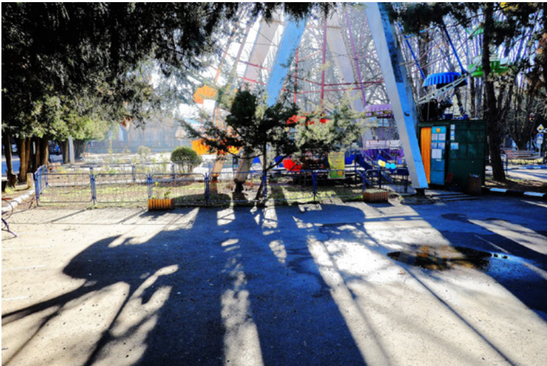
8 Das »Glücksrad« im Hinderpark, Simferopol, Alexander Barbuch 2019.

uns passende Daten und Fakten aus dem Ärmel schütteln, Schweine- reime auf die Gegenwart. Wir sind Raum- und Zeitprojektoren. Uns verbindet die Verbundenheit mit der konkret erlebten, gelebten, ge- liebten Krim und mit abstrakten kulturellen Konstrukten. Das krimi- ge und das russige Gefühl, so selbstverständlich wie das im August versengte Gras, das kannst du nicht in den Mund nehmen, es gilt als fatal bis fäkal. Verwirf diese Verwerflichkeit. Vergiss, dass Menschen, die du auf und von der Krim antriffst, die Ukraine auch mal »Formali- tät« nennen. Das alles kann man so nicht sagen.