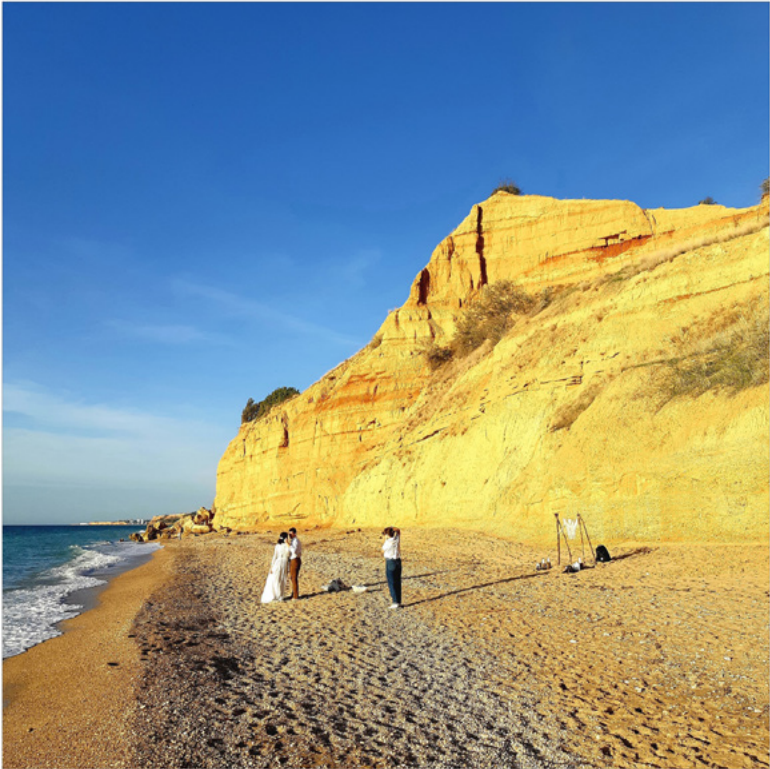
5 Ein frisch verheiratetes Paar am Strand nahe Hatscha, Alexander Barbuch 2016.

seien nichts als Lückenbüßer fürs Vakuum, das entstanden ist, nachdem die Krimtataren vertrieben worden sind. Die Zugehörigkeit der russischsprachigen Folgefamilien zur Krim sei absurd, illegal, künftig dem Verfall geweiht – ungefähr so der Sound, ähnlich wie von der Tramtreppe am Paradeplatz.