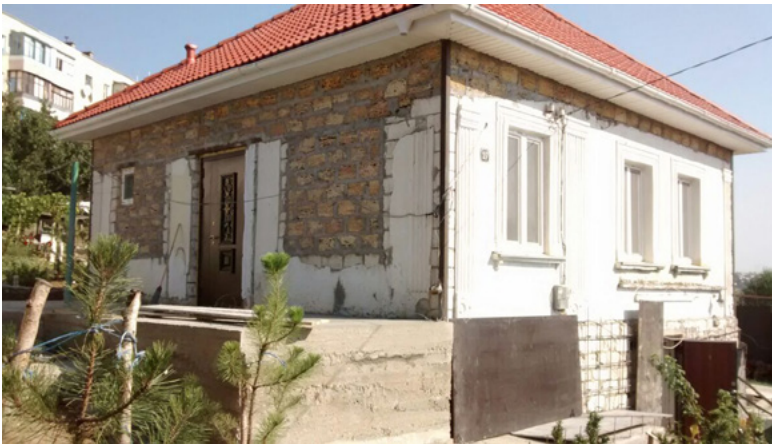
54 Großelternhaus im Umbau, »privat« 2015.

Habe ich mich von meiner turkmenisch-tatarischen Oma in der Nordbucht jemals verabschiedet? Ich erinnere mich nicht an eine letzte Szene, außer an das Bild, als wir erfahren haben, dass sie an einem Schlaganfall gestorben ist, in ihrem Haus, vielleicht auf der Holzbank vor ihrem Haus. Wir waren gerade am Mittelmeer, am Krimersatzstrand.