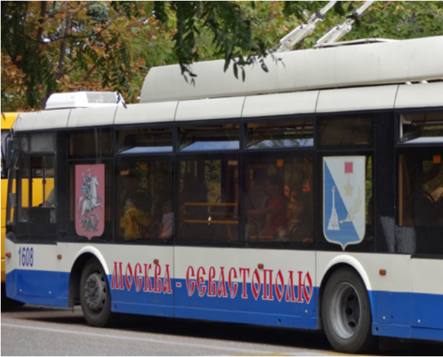
41 »Von Moskau für Sewastopol«, Tatjana Hofmann 2015.

Andere Trolleybusse wirken zeitgenössisch, wie die Busse in Deutschland, nur in Russlandfahnenfarben. Das sind Busse aus Deutschland, stelle ich in einem von ihnen fest, offenbar am Handelsboykott vorbeigefahren. Dieses Fleckenmuster auf pseudogeplüschten Sitzbezügen, diese steril glänzenden Metalloberflächen.