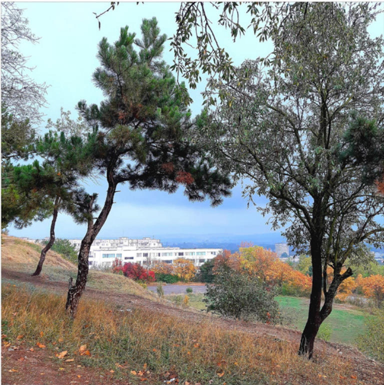
10 Landschaft nahe Simferopol, Alexander Barbuch 2019.

Sascha, ich muss da durch, zu den Meinungen, in sie hinein. Ich wähle diesen Weg als Erkenntnismittel, ob mit kitschiger oder faktischer Brückenmetaphorik, geschmückt mit Zürichblümchen, entzückt von der Krimkälte – verrückt!, wie er sagt. Meinetwegen. Rückversichert durch Krimtrotz. Mit Rückenwind der vielen »ja, sicher, aber psst«.