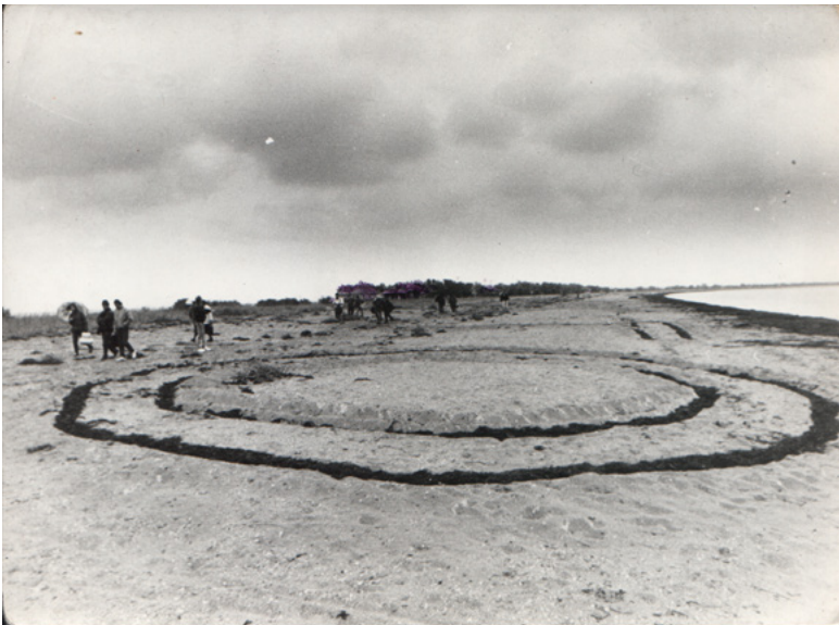
30 Geoglyph O, Andrej Kanischew 1993. Diese und die folgenden Abbildungen des Kapitels von Andrej Kanischew erschienen zuerst in «ГФ — Новая Литературная Газета», 1994, Nr. 2(2), 1–6.

Im September 1993 fanden Installationen im Rahmen der Ausstellung Tabula rasa auf der Insel Tuzla statt. So erstreckte sich zum Beispiel die Arbeit LOOK TO THE HEAVENS (Schaut zum Himmel) von Rostislaw Jegorow auf dem Strand über einen Kilometer lang: Die Buchstaben dieses Mottos hat er aus schwarzen Algen ausgelegt. Die Aufforderung erinnert den Zuschauer an verschiedene Welten und daran, dass etwas, was sie vereint, über ihnen steht, denn über der Aufschrift kreisten Hubschrauber der ukrainischen und russischen Grenzwa- che, der Fisch- und Jagdinspektion. Einen Monat später soll Michail Ajzenberg, der mit einer eigenen Ausstellung in den USA gewesen ist, dem Organisator des Forums Aufnahmen überreicht haben, die tief gerührte NASA-Mitarbeiter von dieser Aufschrift angefertigt haben, so der Mythenliebhaber Sid.