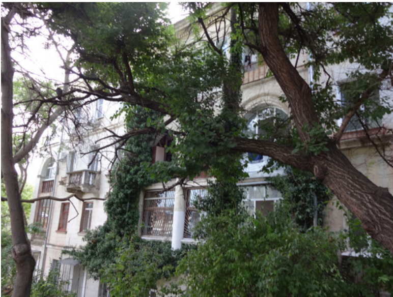
46 Zugewucherte Militärstadt, 2015.

Die Wege sind breit und hell, so umarmend sollen Altstädte sein. Früher, hat die odessitische Chassidin gesagt, in der Nezaleschnost-Zeit habe man die Große Morskaja als die Große Bankenstraße bezeichnet, nämlich als Bolschaja Bankowskaja. Dort hatten viele ukrainische Banken ihre Filialen. Die Innenstadt wäre beinah als Weltkulturerbe unter UNESCO-Schutz gestellt worden, wenn nicht die unteren Stockwerke von den Banken umgebaut worden wären. Dabei haben sie die historischen Fassaden übermalt, statt sie fachgerecht zu reinigen. »Die Ukraine hat diese Stadt nie geliebt, wofür soll diese Stadt die Ukraine denn lieben?«, fragt sie resigniert beim Abschied.