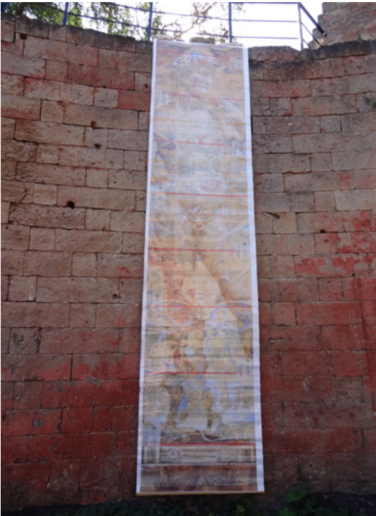
25 Ismet's Plakat mit einer Skulptur von Michelangelo, Tatjana Hofmann 2015.

schen Kunst und lässt sein Publikum verstummen, bis jemand scherzt: Die »inneren Organe« verfügen wie immer über die größte Macht. Die Scherze verselbständigen sich, die Gruppe lüftet ihre Kommentare über dem Hafenpanorama, Ansichten vieler Unpolitischer. Jemand sagt, auf die ukrainische Blockade der Personen- und Güterbewegung über den Landweg könnte Russland so antworten, dass ukrainische Waren nach Russland nur über die Krim gelangen dürfen. Jemand anderes sagt, es mögen zwei verschiedene Länder sein, aber die Menschen, sie sind dieselben. Jemand rückt den Sonnenhut zurecht, die Hitze haftet an der Haut. Ich rücke zur Festungsführerin, die in ihrer schwarzen Hose, ebensolchem T-Shirt und dem nach hinten gebunden Kopftuch einem Seeräuber ähnelt, rücke ein paar Daten im Gedächtnis zurecht und vergesse sie kurz darauf wieder.