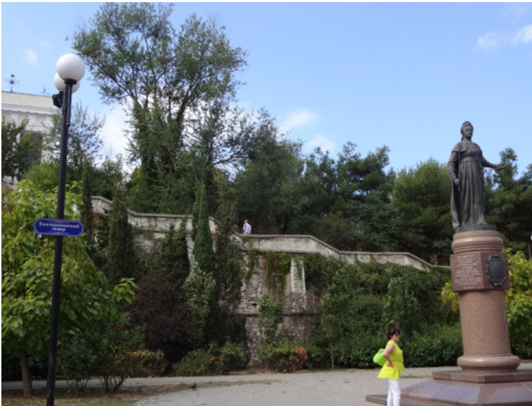
42 Denkmal für Katharina die Große

Fahnen über Fahnen, wie im Schweizer Schrebergarten. Sewastopol feiert überdeutlich, dass es russisch (geworden) ist. Gleichzeitig denke ich oft an die Türkei hier, noch mehr aber in Simferopol und in Kertsch. Eine Türkei, die an der Ecke Maiskolben verkauft – Kukuруза auf Russisch und fast genauso auf Türkisch, gesalzen und glänzend gebuttert. Das kann man so nicht sagen, lassen wir die Türkei, zumal diese Assoziation mir viele der neuen Busfassaden aus dem Kopf zu schlagen versuchen: Sie sind in russischen Nationalfarben bemalt, einige ziert der Schriftzug »von Moskau für Sewastopol«. Rot-Blau-Weiße Fahnen hängen von Häusern und Autos, als ob gerade wieder Parade wäre. Ein älterer Mann, sehe ich im Vorbeigehen, trägt im Alleingang eine Flagge mit Hammer und Sichel zu einer Gedenktafel an Gefallene im Zweiten Weltkrieg, andächtig, im Marschschritt, kerzengerade. Unweit davon steht das neue Denkmal für Katharina die Große.