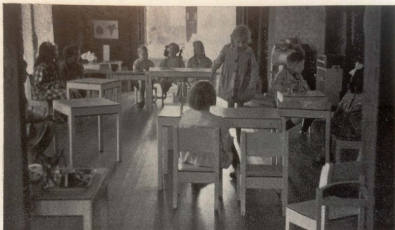
„Loopen, zonder dat iemand er iets van hoort, is lang niet makkelijk!“ (Montessori-Centrum, Laren.)

Een kind dat zich op een Montessori-school oefent in lopen zonder dat iemand het hoort © KU Leuven Bibliotheken 20