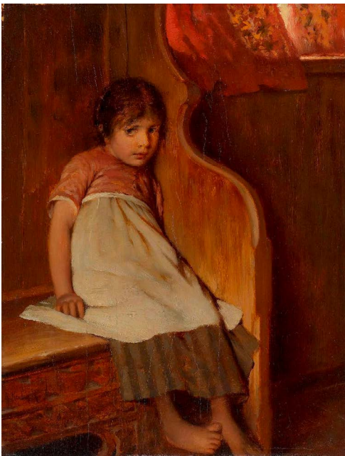
Het verlegen meisje door de Duitse kunstenaar Hermann Kaulbach

Wie in het onderwijs staat, kinderen heeft of de kinderen van zijn of haar broer of zus heeft bestudeerd wanneer ze op twee- of driejarige leeftijd op een feestje toekomen, die zal ze ongetwijfeld kennen: de kleuters en peuters die zich dralend aan de rok of broek van mama of papa vastklampen, de kinderen die schoorvoetend, met bevende handen en een lichte krak in de stem vooraan in de klas een versje opzeggen, of de jongeren die liever de kat uit de