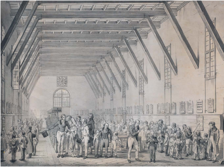
Een aquarel van Het Lancaster-Bell onderwijsstelsel door Giovanni Migliara, 1820

pleidooi voor het gebruik van stilte in de pedagogiek terug, maar wordt aandacht besteed aan de politiek-maatschappelijke rol van stilte en het leren stil zijn op school.