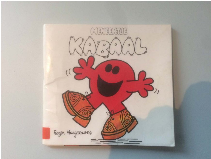
Voorpagina Meneertje kabaal door Roger Hargreaves uit 1986 © Privéverzameling Pieter Verstraete

om een symbolische en collectieve minuut stilte te houden ter nagedachte- nis van de vele slachtoffers. Op 22 maart 2017 weerklonk op verschillende scholen in Vlaanderen één minuut lang een veelbetekenende stilte. Via de stille herdenkingspraktijk voor de slachtoffers van de terroristische aanslag werden leerlingen aangespoord om stilte niet alleen als een probaat middel te zien om menselijk leed en persoonlijk lijden een plek te geven. De stilte werd ook vervlochten met een specifiek kader van waarden en normen dat jongeren er mede toe moest aanzetten om tolerante en democratische persoonlijkheden te ontwikkelen. 6