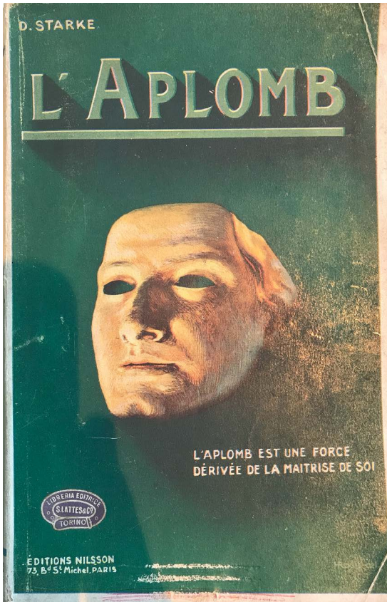
Frontispice van L'aplomb door Dr. Starke uit 1913

van het boekje L'aplomb toch vermoeden dat deze voorstelling niet helemaal correct is: “Gebrek aan aplomb is altijd een obstakel geweest voor degenen die worden bezeten door het verlangen om het te maken in het leven. De onhandigheid die voortkomt uit verlegenheid heeft te allen tijde diegenen geschaad die erdoor worden beïnvloed. Maar nooit was dit gebrek meer merkbaar dan in het hedendaagse leven.” 56