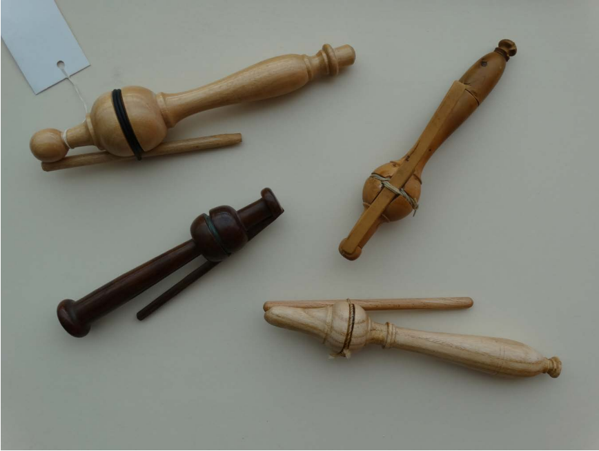
De knip of le signal van Jean-Baptiste De la Salle

hun boek steeds in de hand houden en goed meedoen; dat hun armen en handen altijd te zien zijn en ze elkander niet aanraken dat ze elkaar niets geven, of naar elkaar kijken; dat ze altijd de voeten netjes naast elkaar geplaatste houden; dat ze nooit de voeten buiten hun schoenen of klompen steken; dat de schrijvers niet op tafel gebogen liggen, terwijl ze hun les opzeggen, en dat ze geen enkele onbetamelijke houding aannemen.” 20