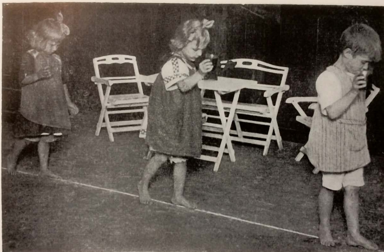
De aandacht wordt verdeeld tussen het plaatsen van de voetjes op de lijn en het houden van 't glas water zodat er niet gemorst wordt.

Een oefening in concentratie en het controleren van de beweeglijkheid