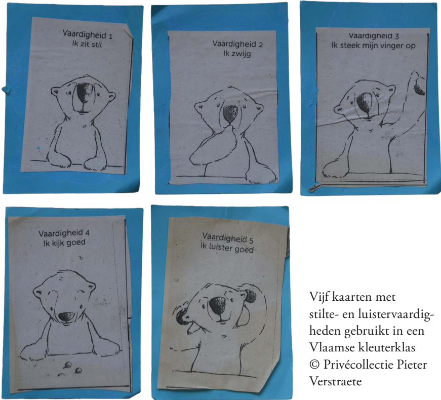
Vijf kaarten met stilte- en luistervaardigheden gebruikt in een Vlaamse kleuterklas

een tiental minuutjes kunnen terugtrekken. De materiële aanpassingen van de klasomgeving leiden tot betere concentratie en gedrag, bieden de kinderen rust, en stimuleren de verantwoordelijkheid én de zelf-bewust-ording van kinderen. In een wereld waarin alles continu moet worden opgeladen – denk maar aan gsm's, smartwatches of elektrische auto's – heeft ook het zich ontwikkelende kind "een oplaadpunt nodig voor zichzelf". 1 Aan de vele prikkels die gedurende een schooldag aan de kinderen worden aangeboden hangt een prijskaartje: de batterij van het zelf raakt op. Die lege toestand van het zelf kan zich op verschillende manieren manifesteren. Zo zijn er kinderen die vermoeid raken, beginnen te geeuwen of minder alert worden. Maar evengoed zijn er leerlingen die beginnen te razen of andere kinderen pijn doen. Beide manifestaties zijn het gevolg van dezelfde oorzaak: het zelf raakt op en moet worden heropgeladen tot het opnieuw zijn oorspronkelijke honderd procent heeft bereikt.