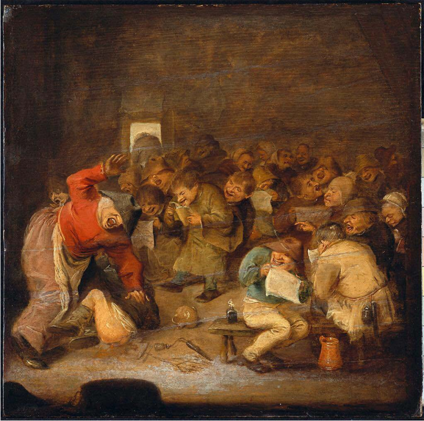
Een school uit de zeventiende eeuw geschilderd door de Vlaamse schilder Adriaen Brouwer

dit gebrek aan aandacht voor de opvoeding en het onderwijs van nieuwe generaties kinderen onlosmakelijk samen met een gebrek aan deugdzaamheid bij volwassenen en de verschrikkelijke gevolgen die hieraan gekoppeld dienden te worden – zoals bijvoorbeeld de vele godsdienstoorlogen die toen woedden. Enkel door kinderen al vanaf jonge leeftijd op te voeden en na verloop van tijd in contact te brengen met wat hij noemde de bonae literae – inspirerende geschriften uit de Grieks-Romeinse oudheid – kon men hen kneden en de juiste vorm geven opdat ze zouden uitstijgen boven het niveau van dierlijke instincten.