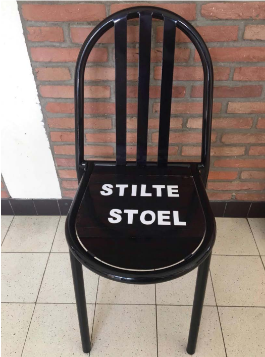
Een stiltestoel in een Vlaamse school voor buitengewoon onderwijs

van verzet of intellectuele tekortkoming geïnterpreteerd. Het feit dat hij zich niet engageerde in de groepswerken en maar heel zelden antwoord gaf op de vragen die hem werden gesteld, kon op weinig sympathie van de Amerikaanse onderwijzers rekenen. Hao's stilte paste niet in het Amerikaanse onderwijsstelsel waar van kinderen verwacht werd dat ze vooral dialogisch leerden en al converserend progressie maakten. Stil zijn stond gelijk aan niet mee willen, dan wel niet mee kunnen, en had dus voornamelijk een negatieve connotatie.