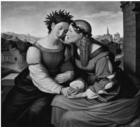
Abb. 1: F. Overbeck: Italia und Germania (1828)

Dass Eichendorff in seiner Geschichte des Dramas von 1854 Italien so rundweg verdammt, lässt sich allein durch den spezifischen historischen Hintergrund der nachrevolutionären Situation erklären, als eben der italienische Risorgimento-Nationalismus eine entschieden antikatholische Angelegenheit geworden war und zum »heiligen Krieg« gegen den »römischen Vampyr« rüstete (B. III. 3. 2. 3). Eichendorffs frühere Werke sind nämlich durchaus von jener deutsch-italienischen Symbiose geprägt, wie sie Friedrich Overbeck in seinem bekannten Bild »Italia und Germania« (Abb. 1) programmatisch verewigt hat. »Italien, wo die Pomeranzen wachsen« ist im Taugenichts ein poetischer Sehnsuchtskomplex, 259 Rom der symbolische Kristallisations- und Angelpunkt der Erzählung, und auch noch im Roman »Dichter und Gesellen« (1834) führt der Weg des Künstlers nach Rom, wo die nazarenische »Künstlerrepublik« ihren Sitz hatte. 260 Bei seinem Wien-Aufenthalt 1846/47 verkehrte Eichendorff zwar nicht wie 1811/13 im Hause Schlegel mit