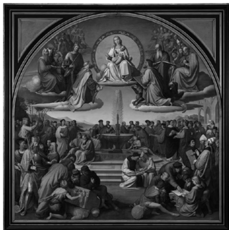
Abb. 2: F. Overbeck: Das Magnificat der Künste (1840)