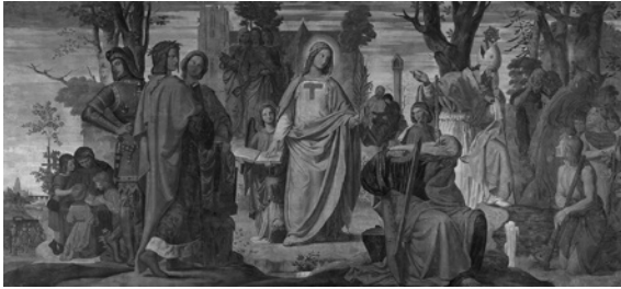
Abb. 3: Philipp Veit: Die Einführung der Künste in Deutschland durch das Christentum (1836)

Den inneren Zusammenhang des Christlichen und Germanischen hat etwa auch Philipp Veit in seiner »Einführung der Künste in Deutschland durch das Christentum«