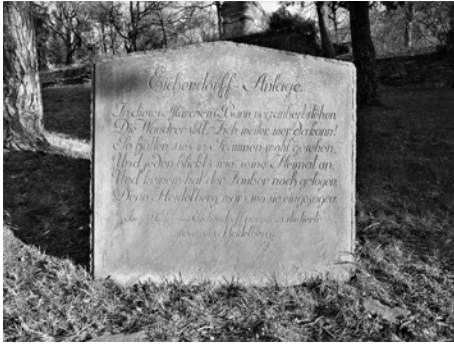
Abb. 4: Eichendorff-Gedenkstein. Heidelberger Philosophenweg

Der Wald indes rauscht von uralten Sagen, Und von des Schlosses Zinnen über'm Fluß, Die wie aus andrer Zeit herübertagen, Spricht abendlich der Burgeist seinen Gruß, Die Stadt gesegnend seit viel hundert Jahren Und Schiff und Schiffer, die vorüberfahren.