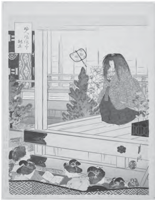
Abb. 2: Ogata Gekkō, Nogaku [Im Nō-Theater] (Holzschnitt, 1891, gemeinfrei, Quelle: www.dh-jac.net/db/nishikie/arcUP0543/portal/ [letzter Abruf 10.3.2022])