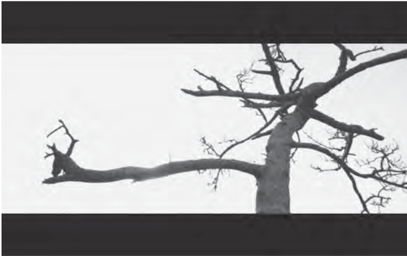
Abb. 3: Doris Dörrie, GRÜSSE AUS FUKUSHIMA

Konstitutiv für den gesamten Film ist eine Mischung fiktionaler und dokumentarischer Anteile. Zu seinen thematischen Oppositionsfiguren gehört ein Kontrast zwischen dem agrarischen und dem technoiden Japan ebenso wie zwischen Satomi und ihrer Tochter Toshiko (Aya Irizuki), die als eine Art neue Geisha zu Elektromusik in Tokio auftritt. 6