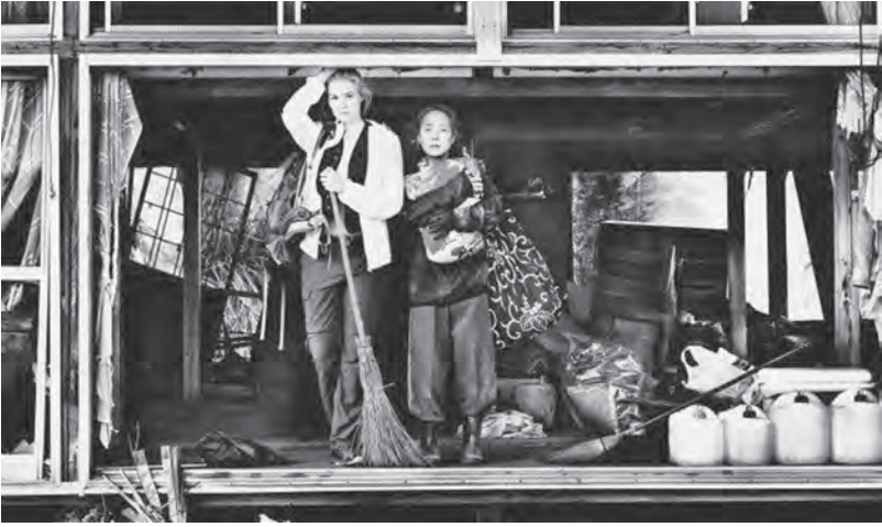
Abb. 1: Doris Dörrie, GRÜSSE AUS FUKUSHIMA