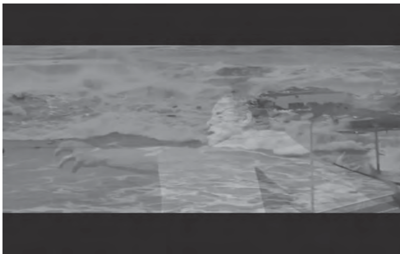
Abb. 6: Doris Dörrie, GRÜSSE AUS FUKUSHIMA

Filmtitel lautet FUKUSHIMA, MON AMOUR . 14 Angespielt wird damit auf den 1959 erschienenen Film HIROSHIMA MON AMOUR nach dem Drehbuch von Marguerite Duras und unter der Regie von Alain Resnais. 15