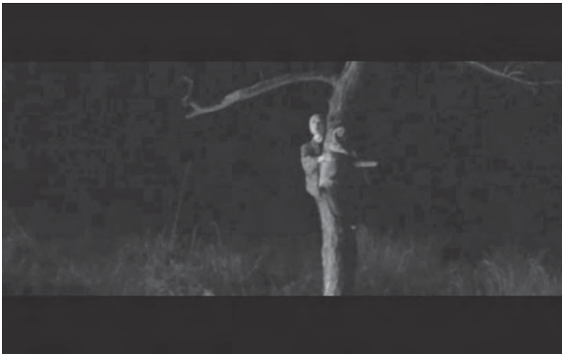
Abb. 4: Doris Dörrie, GRÜSSE AUS FUKUSHIMA

Zuletzt figuriert der Baum aus Dörries Film als ein Hort der Geister (Abb. 4). Hier erscheint der Geist von Yuki (Nanako), der früheren Geishaschülerin Satomis, die sich gemeinsam mit ihr auf den Baum geflüchtet hatte, aber vom Tsunami fortgerissen wurde und dabei ums Leben kam. Satomi selbst berichtet später, sie habe Yuki möglicherweise hinabgestoßen. Yukis Geist besetzt den Baum vor Satomis Haus und sucht die beiden Frauen darin heim. Es gehört zu den Leistungen von Dörries Film, dem Geist Yukis eine physische Existenz zu verleihen, die bis hin zur körperlichen Auseinandersetzung