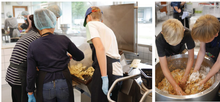
Billede 1 og 2. Fællesskaber og samarbejde omkring stegepande/kipsteger, gryde og store mængder mad.

I løbet af køkkenugen var det karakteristisk, at eleverne opholdt sig i køkkenet hele tiden, og at de ofte havde pauser på andre tidspunkter end resten af skolen. Eleverne fortalte, at de ofte var så trætte, at de faldt i søvn med det samme, når de kom hjem. Eleverne så dermed meget lidt til familie og venner og mest til hinanden i løbet af køkkenugen. Dermed oplevede eleverne den liminale fase særlige overgangsrum og tidsstruktur, selvom de tog hjem hver for sig hver dag. Når de ikke længere var i denne fase, var det den proces og kultur, der havde været, som blev det essentielle i deres perspektiver.