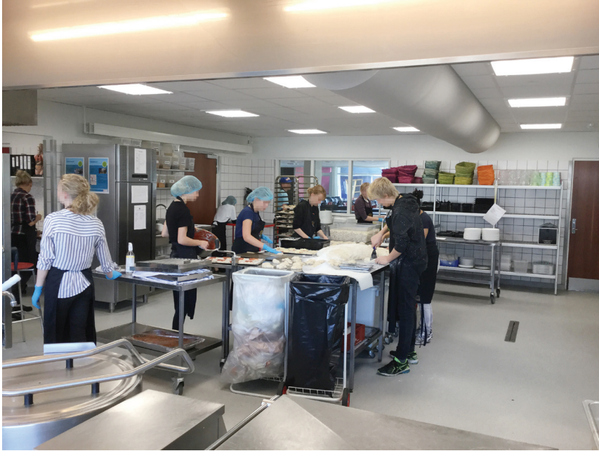
Billede 7. En af køkkenets arbejdsstationer.

der dannede brede rektangler, hvor der kunne stå op til ti personer og arbejde.