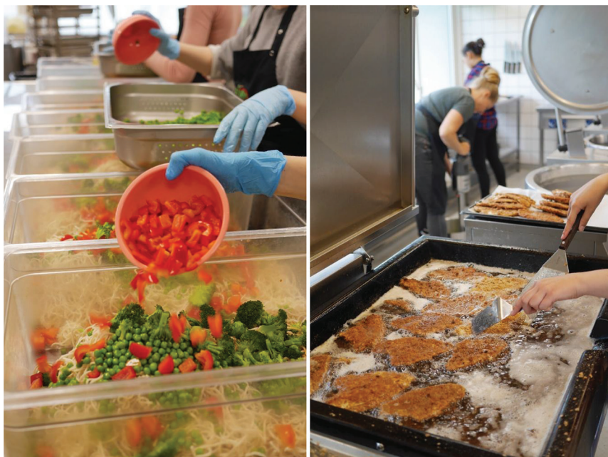
Billede 4 og 5. Store mængder mad tilberedes. Fotograf: Kristina Holt. Alle rettigheder forbeholdes.