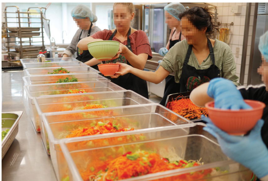
Billede 8. Instruktion fra og samarbejde med køkkenpersonalet.

I den rituelle proces beskriver Turner instruktørerne som nogen, der har en ganske særlig autoritet, som deltagerne underordner sig (Turner, 1967). I LOMA havde køkkenpersonalet autoriteten som instruktører, både i kraft af deres professionskompetencer og deres udholdenhed. Køkkenpersonalet fungerede også som læremestre med læringsformer i praksis som erstatning for formel undervisning i skolens fag (Nielsen & Kvale, 1999; Lave & Wenger, 2003). Køkkenpersonalet havde ansvaret for at få køkkenet til at fungere, og det blev forventet, at eleverne adlød og samarbejdede, mens de også blev instrueret og lærte at håndtere råvarer og køkkenredskaber. Køkkenpersonalet stod sammen med de mindre grupper af elever dagen igennem og havde en anderledes kontakt gennem det fysiske arbejde.