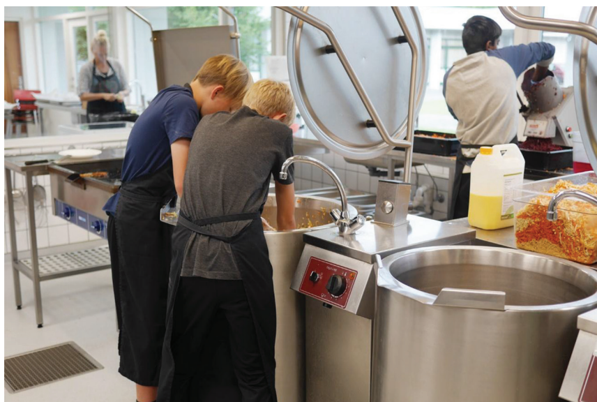
Billede 6. Fælles om at røre sammen.

Vi stod bare der omkring den der kæmpestore gryde og skiftedes til at røre rundt med den der giga spadeske, som jeg fik helt ondt i armen af at røre med, alene, i lang tid, indtil kødsovs var færdig. Det var fedt at vi kunne være flere om at røre i den sammen. (Holt, 2018)