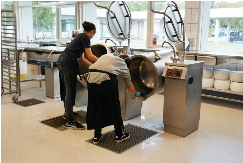
Billede 3. Store køkkenredskaber rengøres sammen. Fotograf: Kristina Holt. Alle rettigheder forbeholdes.

Liminalfasen kendetegnes som beskrevet ved, at individer befinder sig i specielle rum med særlige udfordringer sammen. I det fælles læringsrum blev eleverne præsenteret for store mængder af mad i køkkenet: “Wow, vi skal lave meget mad! Jeg havde bare ikke forestillet mig, at vi skulle lave så meget mad, det var vildt”, udbød en elev første dag, ifølge mine feltnoter (Holt, 2018). Udfordringerne gør individerne sårbare, og det er netop den tilstand, der gør dem modtagelige for bearbejdning. For de elever, der deltog i LOMA, dannede produktionskøkkenets store køkkenmaskiner og de store mængder mad rammen.