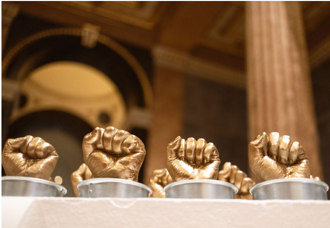
Installation: Wessen (Kunst-)Freiheit? Anahita Neghabat & Asma Aiad, Muslim*Contemporary 2022

Unsere Fäuste stehen weiter Seite an Seite solidarisch gegen Rassismen, Sexismen, Queerfeindlichkeit und jede Form von Diskriminierung.