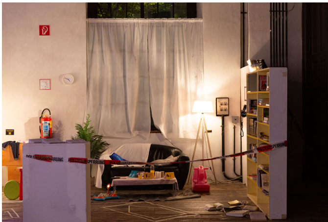
Installation: »Der Neunte November 2020« von Asma Aiad in Ko-Kreation mit Betroffenen der Operation Luxor, Muslim Contemporary 2021

Zum ersten Mal fand Muslim* Contemporary im Herbst 2021 zum ersten Jahrestag der Operation Luxor statt; 2022 fand Muslim* Contemporary erneut statt. Der Jahrestag der Operation Luxor wurde nicht zufällig als Festivaldatum gewählt. Muslim* Contemporary stellte eine künstlerische Intervention dar und hatte die Absicht, die Ereignisse um die Operation Luxor, die zu diesem Zeitpunkt noch sehr wenig mediale Beachtung in Österreich gefunden hatten, kritisch zu thematisieren und öffentlich zu machen. Eine zweiteilige Installation beschäftigte sich daher explizit mit der Operation Luxor.