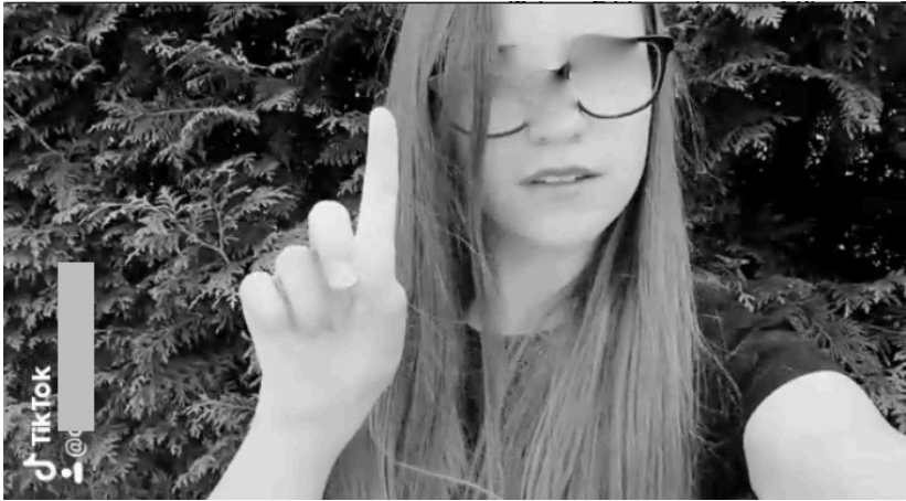
Abb. 2: Videostil aus dem TikTok Video Ich hatte Glück mit meiner besten Freundin (anonymisiert)

bzw. Bedeutung eine symbolisch und konjunktiv aufgeladene Geste zugewiesen bekommt, die in einem Aufzählen – pro Eigenschaft ein Finger – mündet. 7