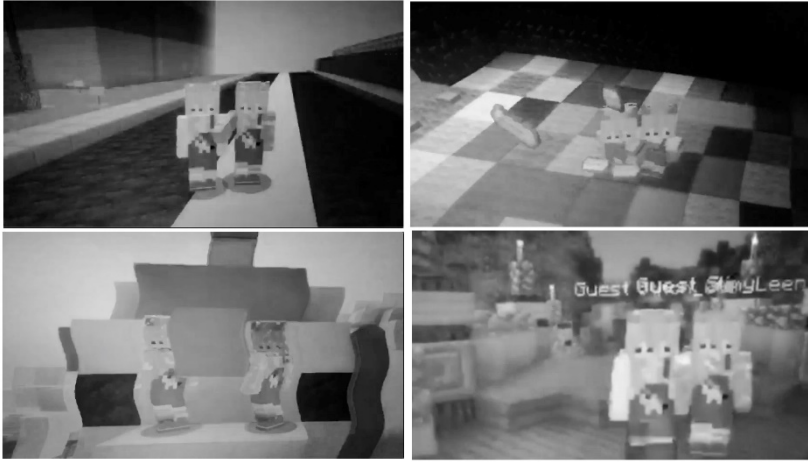
Abb. 4: Beschriftung: Videostills aus den Minecraft-TikTok-Musikvideos