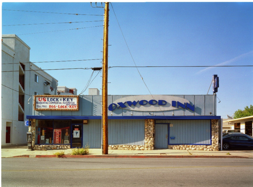
Abb. 3: Kaucyila Brooke; »The Oxwood Inn, Van Nuys, CA«; Chromogenic Print; 40 x 55 in. (113 x 151 cm).