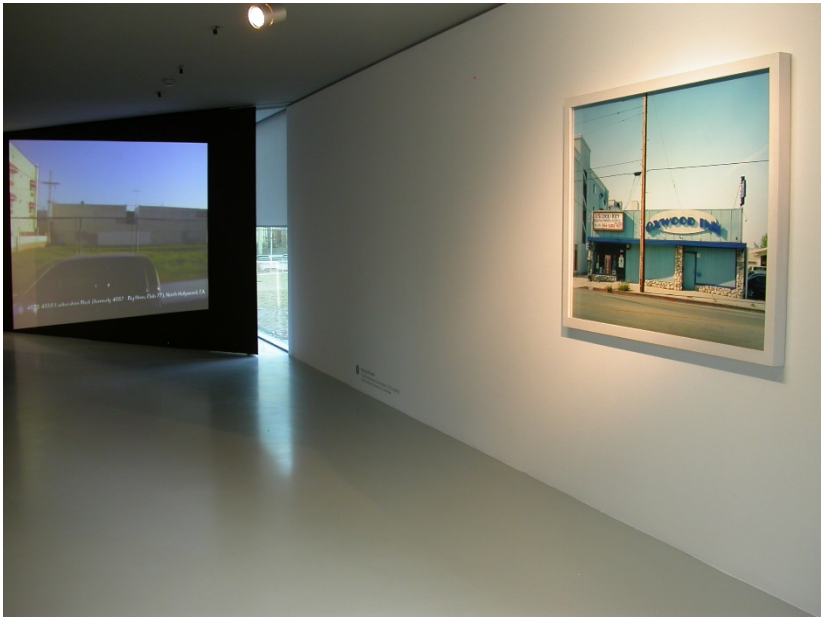
Abb. 1–2: Zwei Präsentationsansichten von »The Boy Mechanic/Los Angeles« (seit 2005) in der Ausstellung »Warum etwas zeigen, was man sehen kann?« (25.02.–07.05.2006) in Galerie für Zeitgenössische Kunst Leipzig.