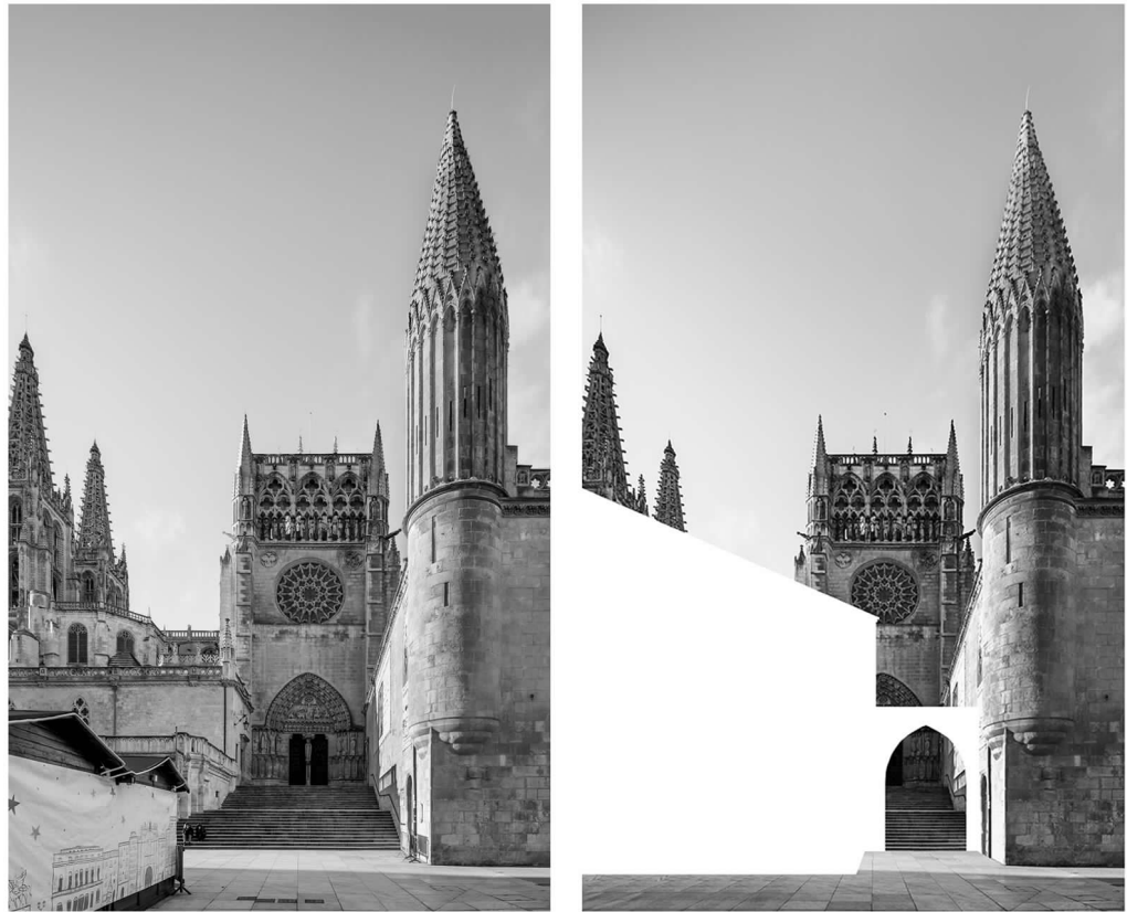
Fig. 10. Current view and digital collage of the Puerta del Sarmental of Burgos Cathedral.