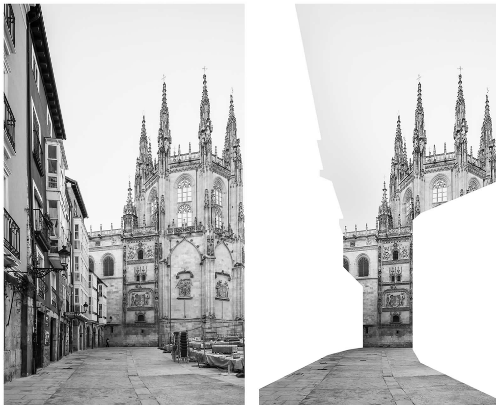
Fig. 9. Vista actual y collage digital del exterior de la Capilla de los Condestables desde la Llana de Afuera.

alineaciones existentes en el Archivo Municipal de Burgos, o fotografías, dibujos y grabados históricos obtenidos de diversas fuentes. Se ha llevado a cabo un montaje o collage digital, a partir de una serie de fotografías de la Catedral de Burgos en la actualidad, realizadas por los autores, sobre las que se han unificado bajo un mismo velo blanco las construcciones que aún se mantienen en pie y los numerosos edificios de los que los antiguos burgaleses decidieron paulatinamente prescindir en busca de una visión más directa y unitaria, para así poder descifrar los diálogos y las 'transiciones' que la fábrica gótica mantenía con la ciudad antigua.