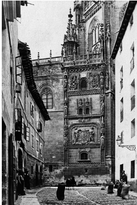
Fig. 5. Vista de la Capilla de los Condestables en 1865.