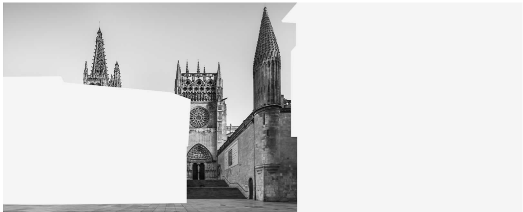
Foto collage de la puerta del Sarmantal de la Catedral de Burgos. Fotomontaje de los autores.

Catedral de Burgos, ciudad histórica, arquitectura y fotografía, patrimonio mundial, UNESCO