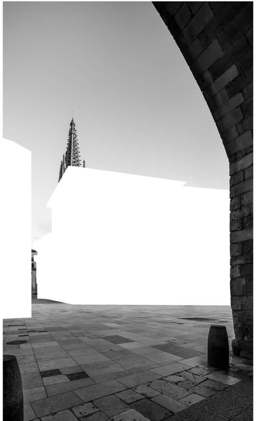
Fig. 8. Current view and digital collage from the Plaza del Rey San Fernando.