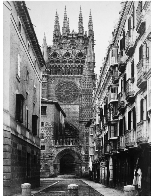
Fig. 4. Puerta del Sarmental before 1865.

century, at the same time as the great French cathedrals of Ile-de-France, it was inscribed as a World Heritage Site by UNESCO in 1984.