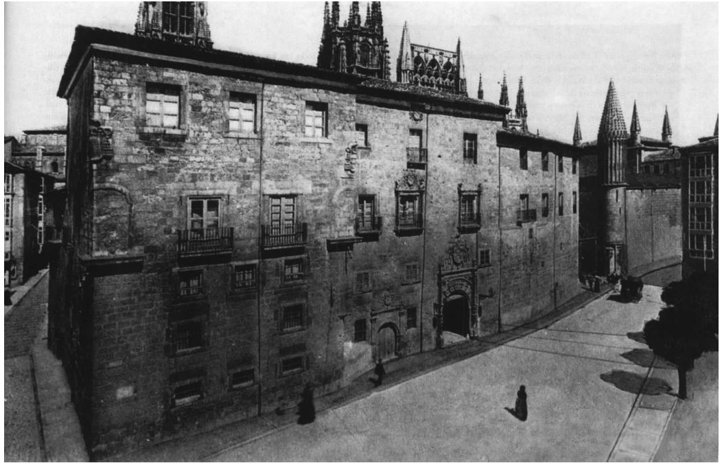
Fig. 2. Old archiepiscopal palace of Burgos, before its demolition. Photograph by Lucien Lévy, 1908.

mand of its inhabitants, entails a longing, a desire to travel back in time, a vague melancholy that any kind of past was better, as the Spanish Renaissance poet Jorge Manrique used to say. In this work, we intend to offer a new vision of the Cathedral, but not the Cathedral that we can see as inhabitants of the XXI century, nor the one that perhaps those of previous centuries could see. But the one that the superimposition of photography and emptiness want to show us now through a particular look and a particular interpretation. It is about using photography, based on the knowledge of the historical cartography and the chronological drawing of the surroundings of the Cathedral of Burgos, to propose new transitions between the present city and the different cities that, under the same name and on the same ground, transited in time towards us [Calvino 1995].