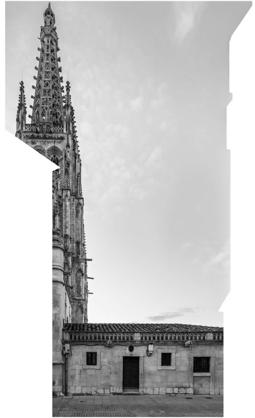
Fig. 7. Vista actual y collage digital de la Catedral de Burgos desde la calle de Fernán González.