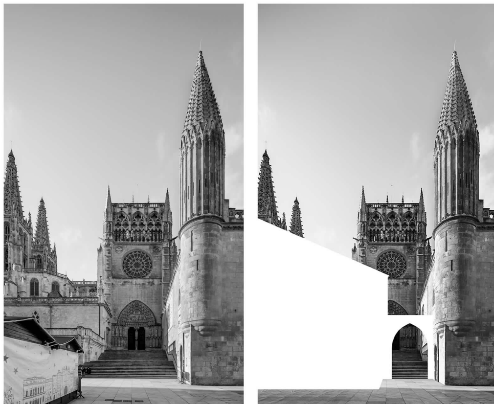
Fig. 10. Vista actual y collage digital de la Puerta del Sarmental de la Catedral de Burgos.

En esos blancos, en esas abstractas 'pantallas', el espectador puede 'proyectar' con su imaginación las visiones y los bruscos cambios de escala que caracterizaban aquéllos antiguos burgos: De la pequeña casa del hombre, a la inmensa casa de Dios, que es la Catedral. Un milagro constructivo y luminoso para aquél oscuro tiempo medieval.