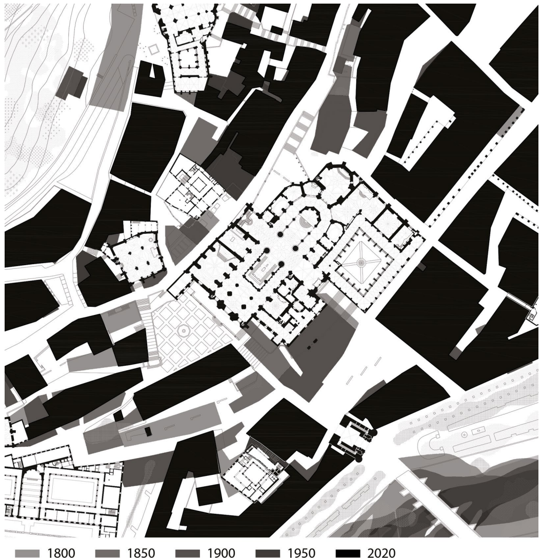
Fig. 1. Plano del entorno de la Catedral de Burgos con la superposición de las diferentes etapas históricas analizadas en la investigación.