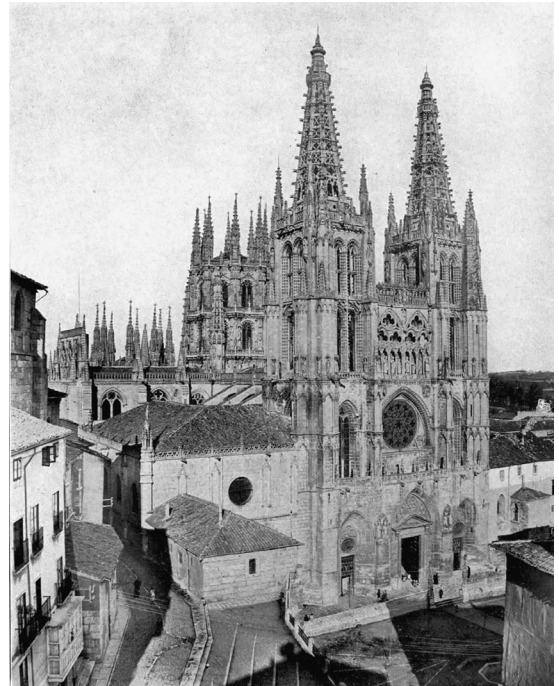
Fig. 6. View of the Cathedral from Fernán González, 1865.

through a series of photographic collages can bring us face to face with the old debate on the isolationism of monuments, so harshly criticized by Camillo Sitte through his beautiful drawings of the floor plans of the surroundings of Italian cathedrals [Sitte 1926]. And since “paper holds everything”, graphic systems, be they drawings, photographs or collages, now allow us to rehearse again these transitions and these looks, be they old or new, be they our own or intended to be those of our ancestors.