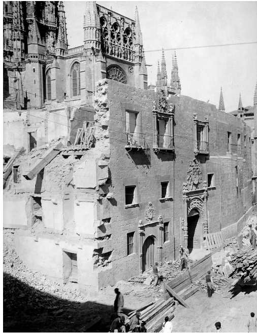
Fig. 3. Demolition of the Archbishop's Palace of Burgos Cathedral during its demolition, 1914.