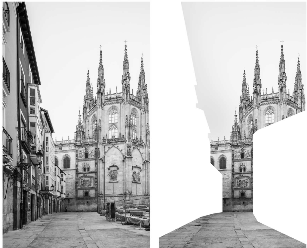
Fig. 9. Current view and digital collage of the exterior of the Chapel of the Constables from the Llana de Afuera.

the Municipal Archives of Burgos, or photographs, drawings and historical engravings obtained from various sources. A montage or digital collage has been made from a series of photographs of the Cathedral of Burgos at present, taken by the authors, on which the buildings that are still standing and the numerous buildings that the old inhabitants of Burgos gradually decided to dispense with in search of a more direct and unitary vision have been unified under the same white veil, in order to decipher the dialogues and transitions that the Gothic factory maintained with the old city.