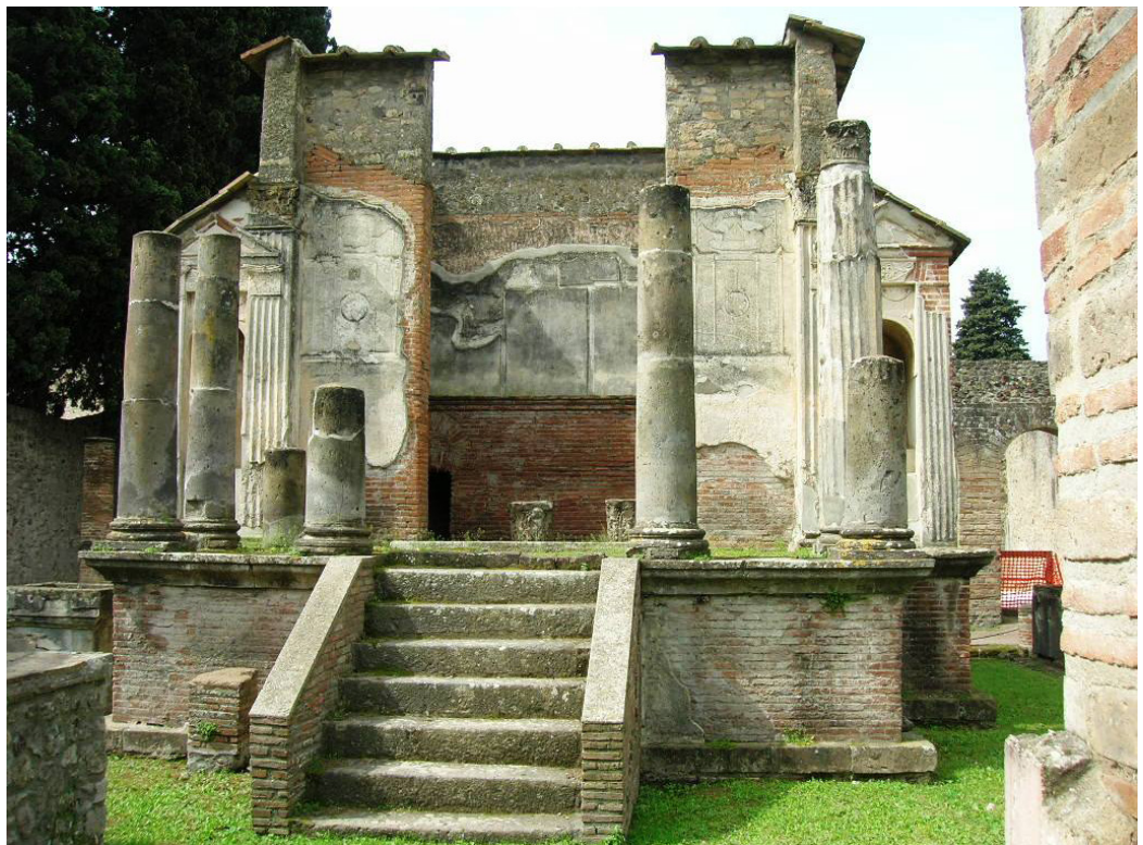
Fig. 3. Pompei, Tempio di Iside. Mentnafunangann, CC BY-SA 3.0. < https://commons.wikimedia.org/wiki/File:Tempio_di_Iside_1.JPG >.

La fama di bambino prodigio di Wolfgang Amadeus Mozart conduce l'artista a Napoli nel 1770, dove rimane per poco più di un mese, le suggestioni di questo breve soggiorno segnarono Mozart anche per gli anni successivi. Insieme al padre Leopold arrivarono a Pompei accedendo proprio dal Teatro Grande risalente al II secolo a.C., all'interno del quale venivano rappresentate commedie e tragedie; successivamente visitarono, come Piranesi, il decoratissimo Tempio di Iside (fig. 3). Il tempio diventa subito una famosa meta del Grand Tour perché il fascino orientale mischiato a quello classico della città è un unicum che attira studiosi e intellettuali. Il tempio si presentava con una facciata con pronao tetrastilo con due grandi nicchie, fregiate con rilievi in stucco, contenenti le statue di Arpocrate e Anubi, le divinità affini al culto di Iside la cui statua era serbata all'interno della cella. Il complesso di affreschi, sculture e oggetti di culto hanno come tema comune paesaggi egizi e strumenti musicali a testimonianza del carattere multiculturale della cittadina di Pompei dovuto anche agli scambi con l'Oriente.