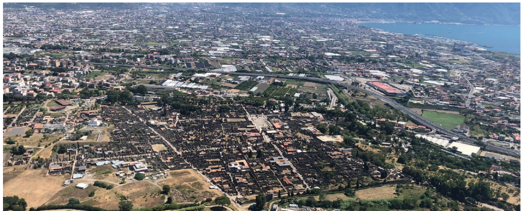
Aerial view of the archaeological park of Pompeii.

Pompeii, perception, Piranesi, Mozart, Goethe