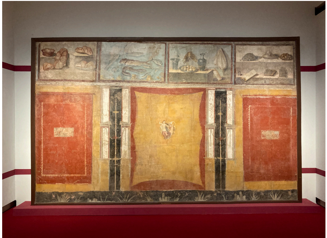
Fig. 5. Pompeii, Praedia di Iulia Felix , Reg. II, 4, 3. IV style's frescoed wall (298x447cm) with Natura morta ( xenia ), 1st century AD. Photograph by the author.

feature that strikes him most, to his amazement, is the presence of the decorations in all the houses of Pompeii, not only in the dwellings of the wealthier classes. This peculiarity makes him reflect on the multi-culturally imbued artistic taste of the Pompeian people, conveying a vision of this city as lively and colourful. The circulation of his essay Italian Journey and his explicit love for the capital of Campania and its ruins was certainly one of the reasons that aroused great interest in 18th-century society, contributing to Pompeii's fame and the neoclassical fashion of decorating one's homes with 'grotesque' paintings.