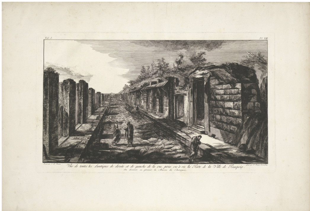
Fig. 2. G.B. Piranesi, Vue de toutes les Boutiques de droite et de gauche de la rue, prise vis-à-vis la Porte de la Ville de Pompeia . Engraving, Rijksmuseum, RP-P-2003-6, CCO I.O. < https://commons.wikimedia.org/wiki/File:Gezicht_op_de_rue%3%AFnes_van_een_oude_winkelstraat_te_Pompe%C3%AF_Vue_de_toutes_les_Boutiques_de_droite_et_de_gauche_de_la_rue,_prise_vis-a-vis_la_Porte_de_la_Ville_de_Pompeia,_RP-P-2003-6.jpg >.