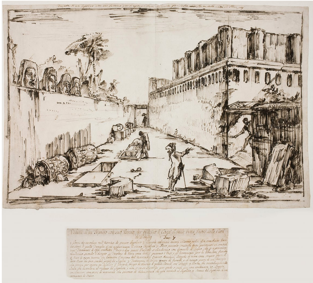
Fig. 1. G.B. Piranesi, The Tomb of the Istacids , 1777. Statens Museum for Kunst, Copenhagen.