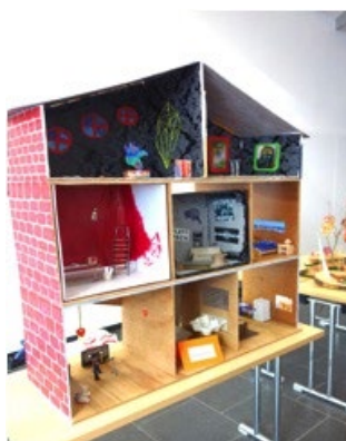
Abb. 1: Impressionen vom musée sentimental 2016 und 2017