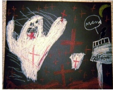
Abb. 2: Gespensterbilder – Beispiele unterschiedlicher dynamischer Vitalitätsformen

Stern beschreibt eine wichtige Funktion der Vitalitätsformen, dass sie mit einem Inhalt gekoppelt sind. „Sie transportieren einen Inhalt [...] Sie verleihen dem Inhalt eine Zeit- und Intensitätskontur und damit die Wirkung einer lebendigen ‚Darbietung‘“ (Stern 2011, 36). Der Maler des linken Bildes vermittelt durch seine geordnete, strukturierte, man könnte sagen, rationale Umsetzung des Themas, durch die weichen Farbkontraste in Pastelltönen zweifellos eine gänzlich andere Intensitätskontur als der Maler des rechten Bildes, der nicht nur den Inhalt um eine „Mama“ rufende Figur erweitert, sondern die Erzählung mit einem expressiven graphischen Ausdrucksstil und harten Farbkontrasten zusätzlich dramatisiert.