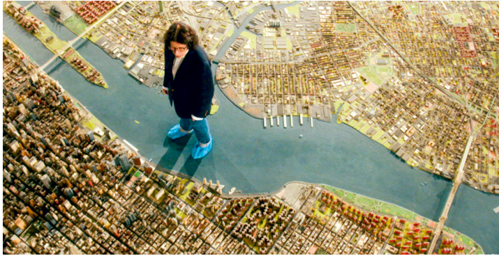
Abb. 1: Screenshot, PRETEND IT'S A CITY (R: Martin Scorsese, USA 2021).

Es handelt sich um ein Modell aller fünf Stadtteile New Yorks, die in einem Maßstab von 1:1200 wiedergegeben sind. Lebowitz kommentiert – im Modell stehend – Stadt- und Architekturgeschichte, aber auch das Panorama selbst: »It made you realize that if only Robert Moses had done everything in miniature, we wouldn't hate Robert Moses.« 11