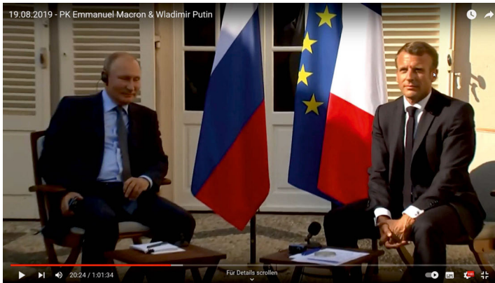
Abb. 1: Macron, Emmanuel: Pressekonferenz mit Vladimir Putin, Fort Brégançon, 19. August 2019, https://www.youtube.com/watch?v=EYvrGKWChRI , 20:23 [11.03.2022]

Dieses geographische Klischee ist nicht neu. 2009 hat der tschechische Autor Jáchym Topol es in einem Roman über Theresienstadt (Terezín) satirisch damit kommentiert, dass nicht einmal eine Figur in Wladiwostok (am Pazifischen Endpunkt der Transsibirischen Eisenbahn) sich im Osten verortet wissen möchte: »Was für ein Osten, [...] sind Sie übergeschnappt? Hier ist doch der Westen, das wahre Ende des Westens, hier hört Europa auf!« 82 In absurder mimetischer Partizipation am westlichen Diskurs löscht sich hier der Osten selbst aus.