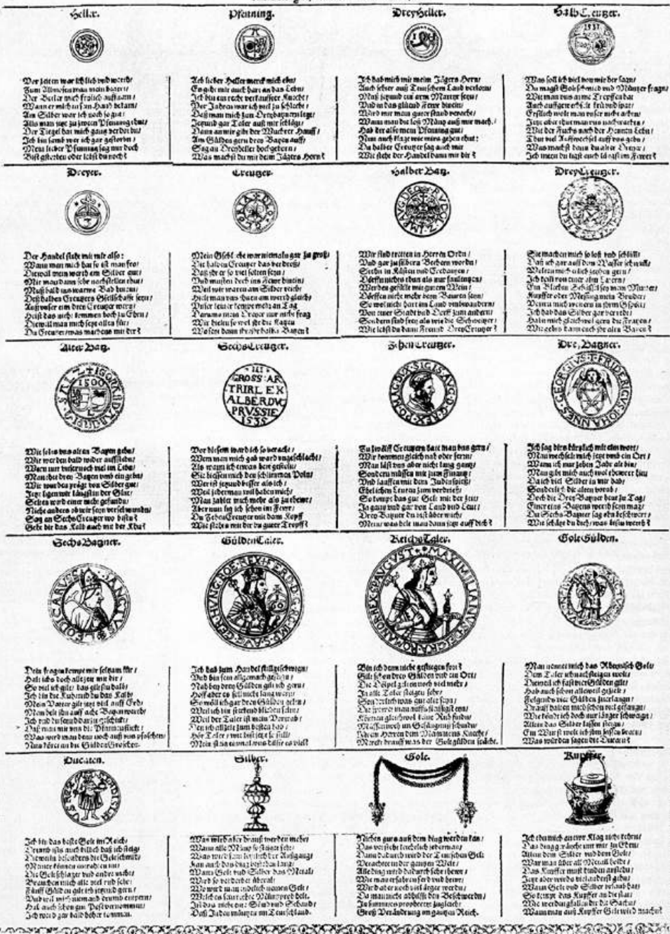
Abb. 2: Flugblatt Ein schön neues Gespräch von dem jetzigen unträglichen Gelt auffsteigen und elenden Zustand im Münzwesen (1621).