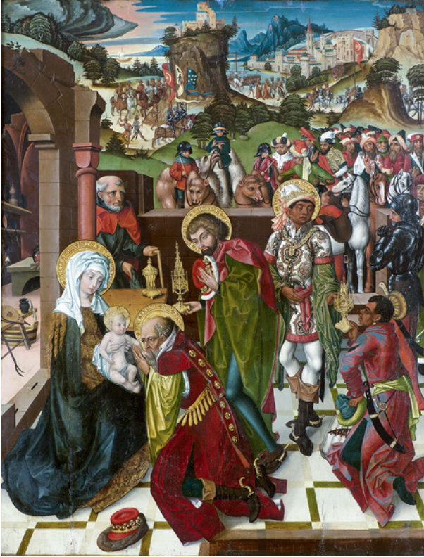
Fig. 2.3 The Adoration of the three Magi

In the Middle Ages it was a well established exegetic tradition that the Three Magi also represent the three known continents. It can already be found in the commentary on the gospel of Matthew, written by the Venerable Bede, an anglo-saxon Benedictine monk, at the beginning of the 8th century. 31 But this tradition had seldom been depicted until the second half of the 15th century. My assumption is, that the change was caused by the fall of Constantinople. The Christian world of Western Europe reacted to the Islamic expansion by depicting a Christian expansion, promised in the gospels. And princes like