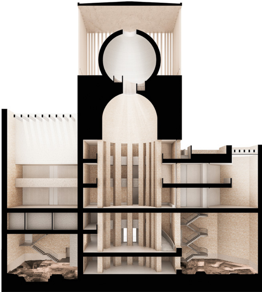
Fig. 7.2 House of One; Innenansicht, Schnittansicht

Demjenigen, der das Gebäude betritt, öffnet sich die Mannigfaltigkeit der Wege- und Raumkonstellationen, gleichermaßen eine kleine Stadt von Religionen und Gesellschaft, die um ein Forum in ihrer Mitte herum angeordnet ist. Von der Eingangshalle aus besteht zunächst die Möglichkeit, sich nach unten oder oben zu orientieren. Eine vertikale Zeitachse durchzieht das Haus, im Untergeschoss ansetzend mit der Archäologischen Halle. Mit den Bodenfragmenten der neogotischen Petrikirche steht die Archäologische Halle ganz sinnfällig und paradigmatisch für die Vergangenheit, für die Vorgeschichte und die Tradition des Ortes, für seine Religions- und Stadtgeschichte. Aus diesen alten Fundamenten heraus entwickelt sich das neue Gebäude, als gebaute Fortschreibung der Tradition.