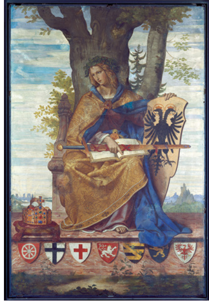
Fig. 2.1.2 Philipp Veit, Germania