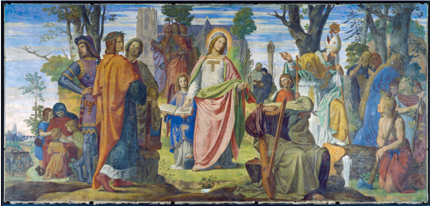
Fig. 2.2 Philipp Veit, The Introduction of the Arts to Germany by Religion

the church building, embodying architecture, sculpture and painting. To the left the picture opens up to a beautiful landscape. We see the view of a town beside a river with an old bridge and a prominent church tower. This town can easily be identified as Frankfurt am Main, where the Städel Museum is located. In the context of the fresco it represents to what the arts lead: traffic and trade, wealth and civilisation.