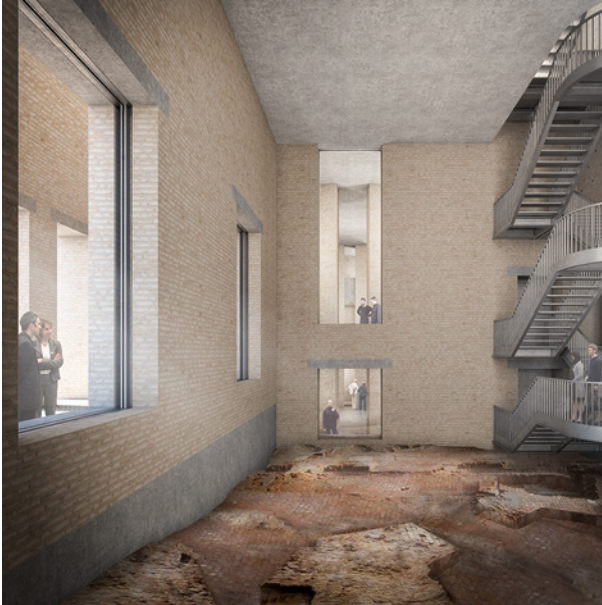
Fig. 7.4 House of One; Innenansicht, Archäologische Halle

Hinblick auf Religionen und Weltanschauungen in einer Zeit „echter Optionen“ leben. In vielen Bereichen der Gesellschaft sind wir nicht mehr durch Geburt und Sozialisation ein Leben lang durch eine Bindung festgelegt. Stattdessen gibt es, Hans Joas folgend 19 , eine Optionalität in einer doppelten Hinsicht: als religiöse Option neben der säkularen Option und andererseits als religiöse Option im globalen Kontext anderer Kulturen, Konfessionen und Religionen. Dass gerade die Religionen ihre Rolle als fragloser Orientierungsrahmen eingebüßt haben und wahrgenommen werden als eine zu erprobende Möglichkeit neben anderen, ist als Prämisse des Selbstverständnisses des House of One anzusetzen. Demgemäß gilt für alle Religionen, was Hans Joas im Blick auf das Christentum konstatiert: „Alle Theologien, die diese Erfahrungen nicht ernst nehmen, erscheinen mir als obsolet. Wir brauchen in diesem Sinne eine neue Sprache für das Christentum, als diese durchdrungen sein muss von einem Verständnis für die Leistungen säkularer Weltanschauungen einerseits, einem tiefen Verständnis nichteuropäischer Kulturen andererseits.“ 20