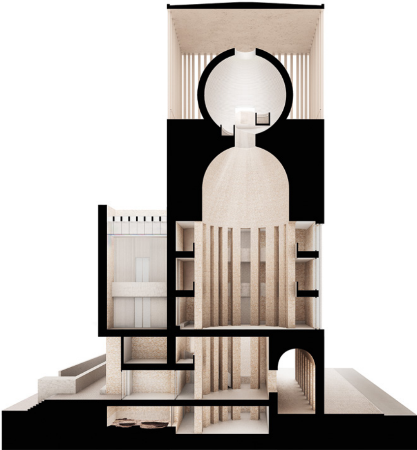
Fig. 7.3 House of One; Innenansicht, Schnittansicht

Sich aus der Archäologischen Halle über den Eingangsbereich in das 1. Obergeschoss begebend, gelangt der Besucher auf die horizontale Ebene des Zentralen Kuppelsaales und der drei Sakralräume Synagoge, Kirche und Moschee. Der Zugang zu den Sakralräumen erfolgt jeweils vom Kuppelsaal aus, dem sog. Vierten Raum, der für das Gemeinsame steht, für die undefinierte Offenheit des einander in der Gegenwart Begegnen-Könnens. Der vertikalen Achse folgend setzt sich schließlich der Aufstieg fort hin zur Stadtloggia als dem baulichen Abschluss des House of One – uneingeschränkt öffentlich der Stadt und dem Himmel zugewandt.