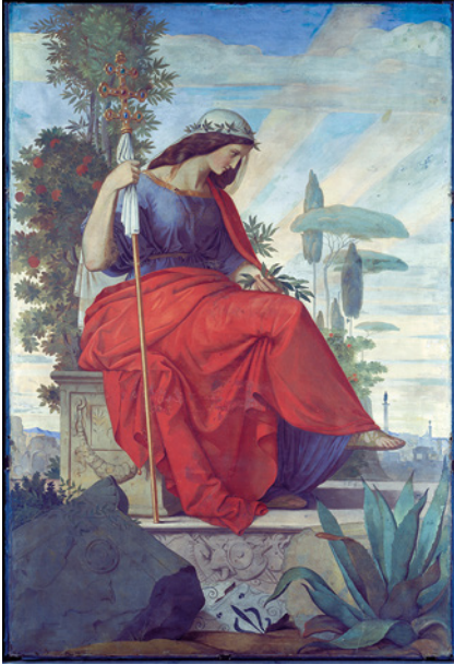
Fig. 2.1.1 Philipp Veit, Italia