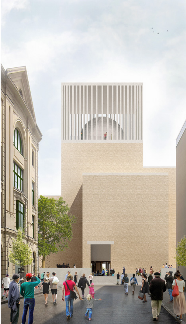
Fig. 7.1 House of One; Außenansicht, Haupteingang von der Brüderstraße

wissen, an dem in rechter Weise über diese Fragen nachgedacht werden kann. Und auch in der Art und Weise, wie das geschehen wird, bringt uns Nathan auf eine richtige Spur: indem er eine Geschichte erzählt, eine Parabel von den drei Ringen.