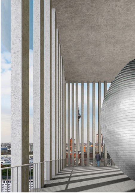
Fig. 7.7 House of One; Außenansicht, Stadtloggia