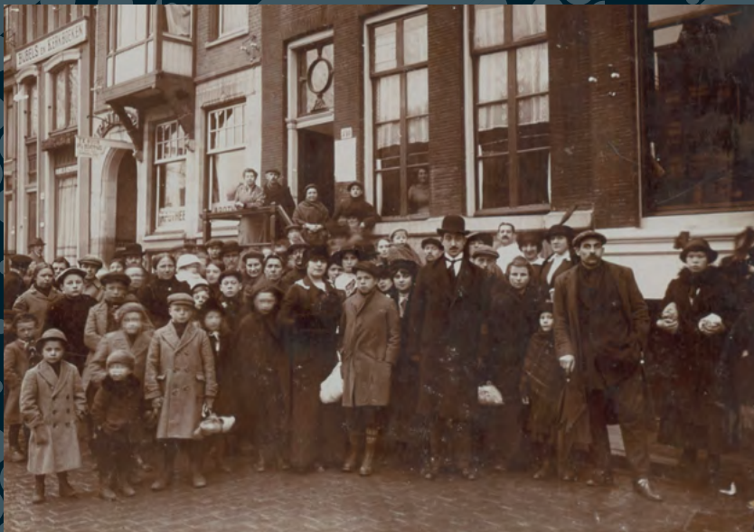
10 Belgische vluchtelingen in december 1914 voor het doorgangshuis aan de Singel op nummer 340 te Amsterdam.