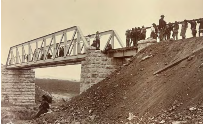
2 Spooraanleg te Blesbokspruit, Transvaal, Zuid-Afrika, circa 1890.