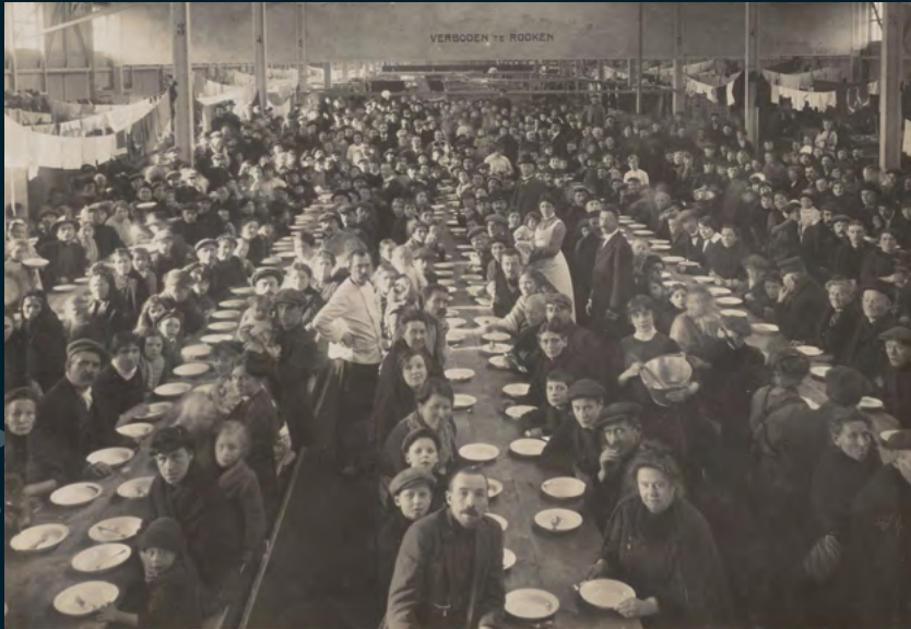
9 Belgische vluchtelingen eten gezamenlijk in Loods L aan de Y- en Handelskade te Amsterdam.