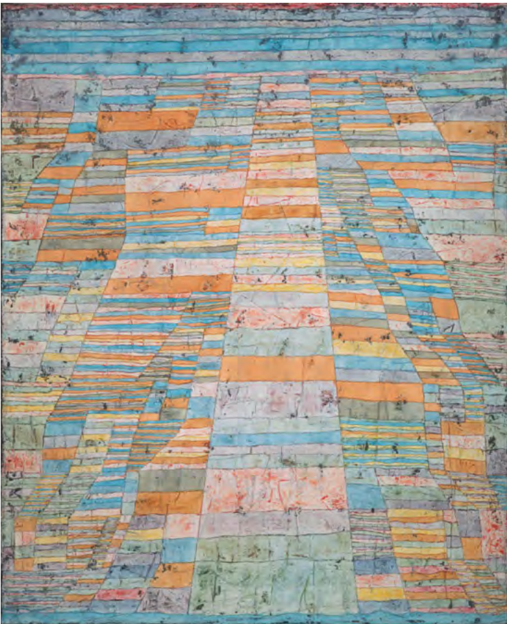
Abbildung 1: Paul Klee. Hauptweg und Nebenwege , 1929, 90 Ölfarbe auf Leinwand. 83,7 x 67,5 cm