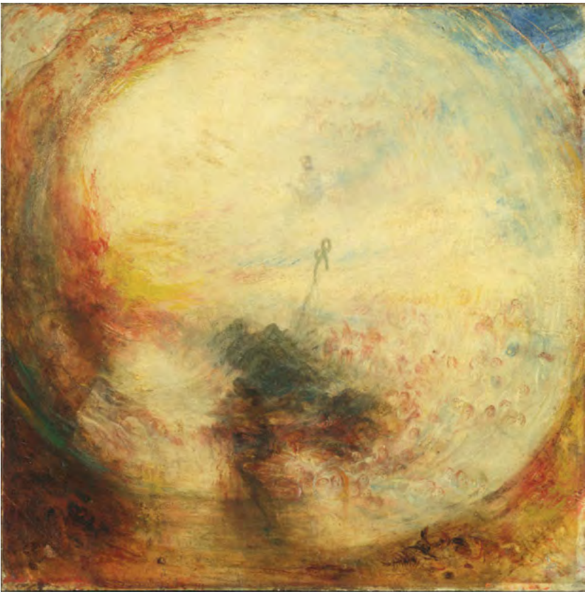
Abbildung 2: William Turner: Light and Colour (Goethe's Theory) – the Morning after the Deluge – Moses Writing the Book of Genesis (1843). Tate Britain