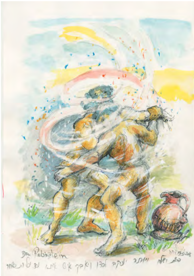
Abbildung 3: Dan Rubinstein, Jakobs Kampf (2016)