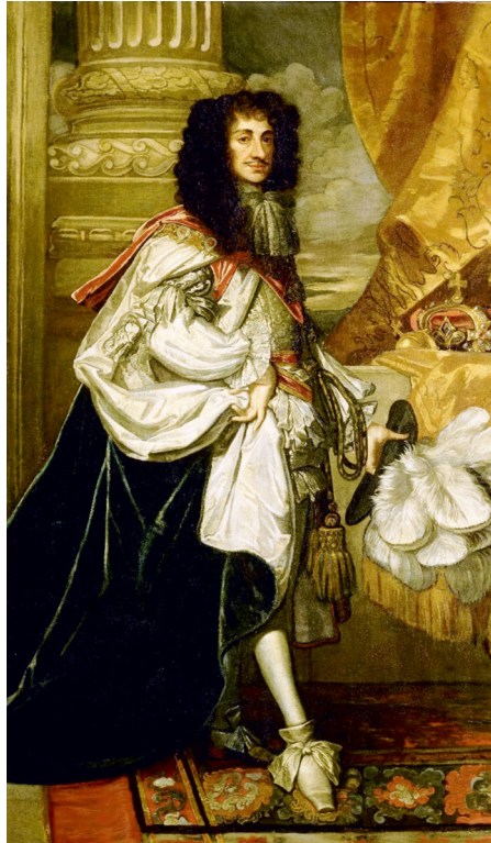
Abb. 5: Peter Lely: Charles II (1630- 1685), ca. 1670, Öl auf Leinwand, 214.6 x 134.6 cm, Royal Museums Greenwich, London.

Lely wird auf diese drohende Forminstabilität antworten, indem er versucht, seine eigene künstlerische Erbfolge zu stärken und Van Dyck zu seinem persönlichen Ahnherrn zu stilisieren. Auf formaler Ebene adaptiert er dafür jene Manier der Sprezzatura oder lossigheid , für die Van Dyck bekannt war und für die nun er, Sir Peter Lely, gepriesen wird. Und wenn er sich in seinem Doppelportrait von Charles I. und James, Duke of York noch hauptsächlich kompositionell an dem Doppelportrait von Charles I. und Henrietta Maria seines Vorgängers am Hof orientierte, so entwickelt er in den späteren Portraits von Charles II. die nobilitierende Handschrift Van Dycks weiter und lässt den neuen König in Glanz und Gloria erstrahlen. Wir kön-