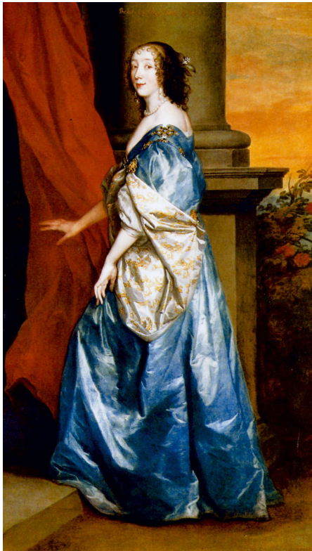
Abb. 4: Anthonis van Dyck: Portrait der Lucy Percy, Countess of Carlisle, 1637, Öl auf Leinwand, 217.9 x 140.3 cm, Privatsammlung.

Dabei fällt auf, dass die Dichter dem Maler eine Kraft zuschreiben, die die dargestellten Personen in ein ästhetisches Ereignis verwandelt. Als ›Poems of Praise‹ heben sie die eidetische Qualität, d.h. die vornehmlich demonstrativ verfahrenenden