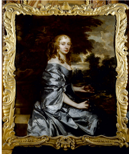
Abb. 3: Peter Lely: Portrait der Lady Jenkinson/ Arabella Bankes, Mrs Gilly (1642), 1660–65, Öl auf Leinwand, 127 x 101.6 cm, Kingston Lacy Estate, Dorset