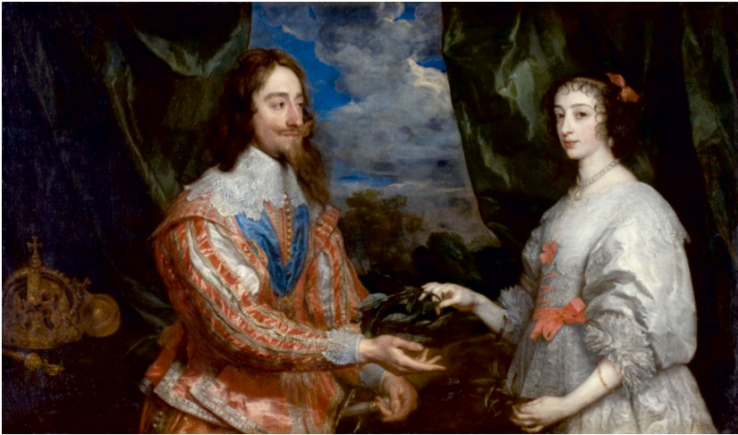
Abb. 2: Anthonis van Dyck: Charles I und Henrietta Maria , 1632, Öl auf Leinwand, 113.5 × 163 cm, Kroměříž Archdiocesan Museum.

Er hatte es zu einer solchen Zufriedenheit des Königs ausgeführt, heißt es, dass er geadelt und zum principall Paynter ernannt wurde, während sein Konkurrent Daniel Mytens (1590–1647) England verließ und auf den Kontinent zurückkehrte. Lelys Gemälde ruft dieses berühmte Bild bewusst in Erinnerung, um nun in einer elegischen Wende den leidenden König zu zeigen, der von seinem Sohn ein Messer entgegennimmt, um einen Brief zu öffnen. Während Charles von royalen Würdezeichen (Säule, Vorhang) sekundiert wird, türmen sich hinter James dunkle Wolken am Himmel. Kurze Zeit später nimmt Richard Lovelace dieses Motiv zum Anlass, ein Gedicht zu verfassen, das dem Gemälde jenen Namen verliehen hat, unter dem es heute bekannt ist – »Clouded Majesty«: