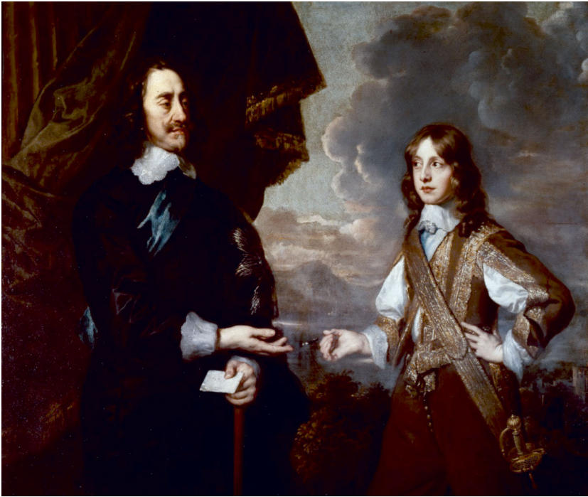
Abb. 1: Peter Lely: Charles I und sein Sohn James, Duke of York, ca. 1647, Öl auf Leinwand, 132.1 × 149.9 cm, Privatsammlung.

Es ist einer der ersten Aufträge, die der niederländische Maler nach seiner Ankunft in England entgegennahm, und es zeigt den in Hampton Court inhaftierten König Charles I., der sich seinem Sohn James in einem der wenigen Besuche, die ihm gestattet waren, gegenübersteht. Lovelaces Gedicht markiert einen Wendepunkt in den kunsttheoretischen Überlegungen zur Repräsentationsfähigkeit der Malerei.