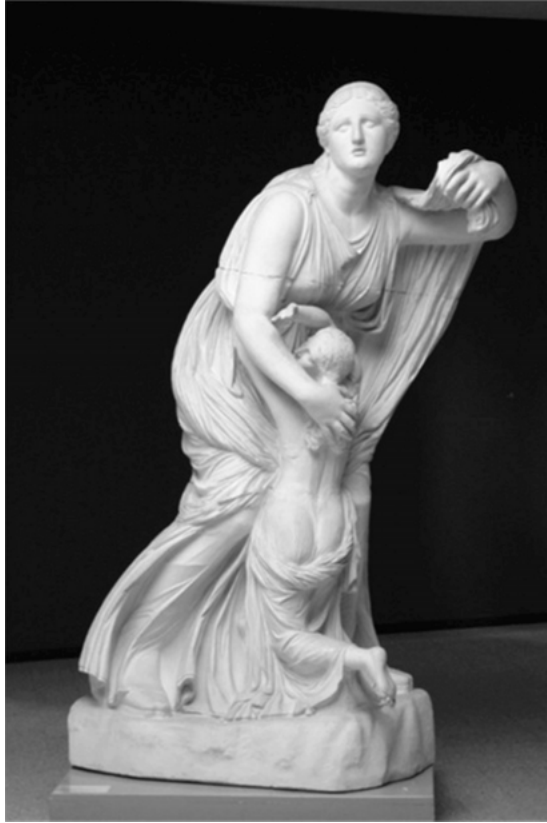
Abbildung 5: »Florentiner Niobidengruppe«(Abguss),Skulpturhalle, Basel. Original: Römische Kopien, wohl nach einer griechischen Gruppe aus der Zeit um 330/20 v. Chr. Uffizien, Florenz.

Im Tod ist das Leben zu Ende und weist nicht über sich hinaus. Leiden und Schmerz sind für Laokoon »gleichsam das Letzte« (XV, 43), er stirbt nicht mit Blick auf eine Versöhnung oder Befriedigung in einer neuen Welt, das Ertragen seines Schicksals kann für ihn so nur »erfüllungslos« (XV, 43) bleiben, denn den »Ausdruck der Seligkeit und Freiheit hat erst die romantische religiöse Liebe.« (ebd.) 11