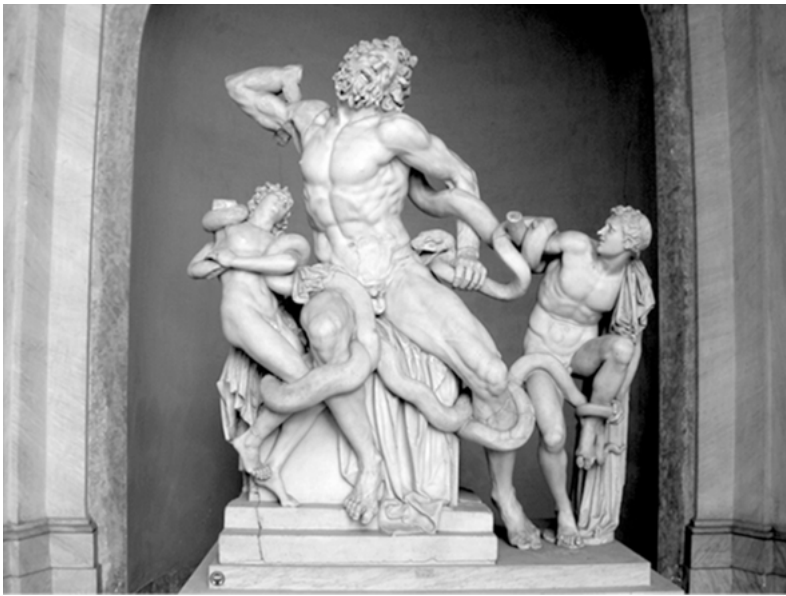
Abbildung 2: »Laokoongruppe« in der zweiten Rekonstruktion mit angewinkeltem Arm, Vatikanische Museen, Rom

Abgesehen davon, dass sowohl Laokoon als auch seinem linken Sohn, der jeweils rechte Arm fehlt und dem rechten Sohn die rechte Hand, ist die Laokoongruppe recht gut erhalten. Doch auch der Kopf der oberen Schlange fehlt und bis heute ist die Restaurierung, die den Kopf an Laokoons linker Hüfte ansetzt, umstritten. 5 So wie wir die Skulptur heute wahrnehmen, aber auch so