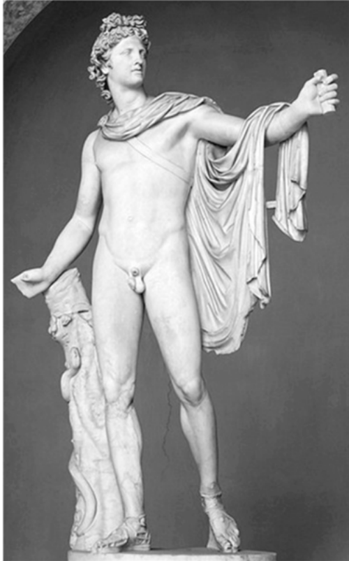
Abbildung 3: »Apollo von Belvedere«, Museo Pio-Clementino, Octagon, Apollo Hall

Dadurch, dass der Mensch hier Eingang in die Kunst findet, bereitet Winckelmann den Boden für die ethischen Ansprüche, die er mit den ästhetischen verknüpft sieht. Von den unberührbaren Göttern und Heroen, wie dem Apollo vom Belvedere (Abb. 3) oder dem Torso vom Belvedere (Abb. 4), den Winckelmann für eine Herkules-Darstellung hält, kann der Mensch nichts lernen.