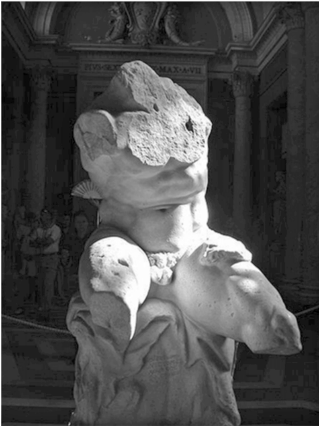
Abbildung 4: »Torso vom Belvedere«, Vatikanische Museen, Rom

Die Haltung, die Winckelmann als ideale dem Leben gegenüber sieht, kann nur aus dem menschlichen Leben selbst kommen. Deswegen benötigt er menschliche Helden wie den Laokoon, dem er Größe angesichts des unermesslichen Leides von den Zügen ablesen kann. Dieses Understatement im Ausdruck dient nicht nur dazu, einer unangemessenen Veränderung von Gesicht und Körper vorzubeugen, sondern gleichzeitig weckt es das Interesse des Betrachters, indem es seinen Geist zu forschen reizt und nicht alles auf einmal offenbart. Der Dichter kann dabei weitergehen als der Zeichner oder Bildhauer, da bei der Abbildung alles zum Abgebildeten passen muss, während im Geschriebenen die Form eine nachgeordnete Rolle spielt, weil es mehr an der Einordnung in historische und kulturelle Aspekte orientiert ist. Laokoon liefert für den gemäßigten Aus-