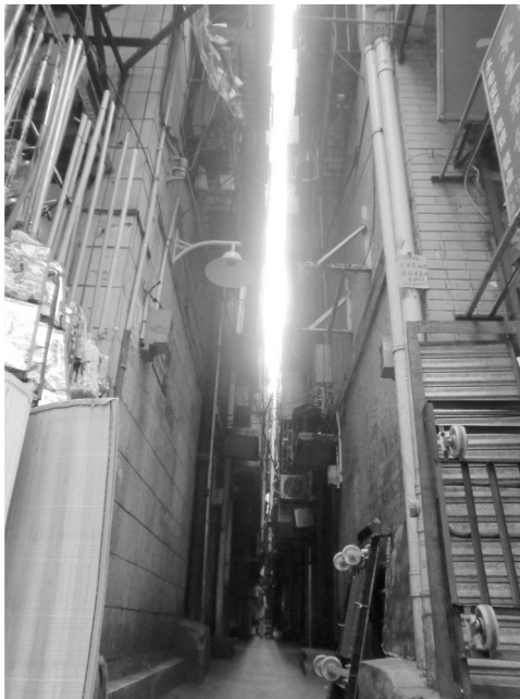
Abbildung 1: Sich fast »küssende Häuser« in Shipai, Tianhe, Guangzhou.