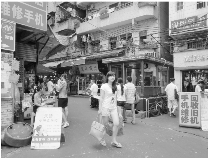
Abbildung 4 und 5: Gasse im Urban Village Tancun, Tianhe, Guangzhou.