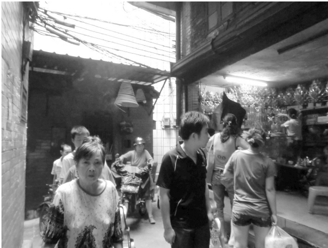
Abbildung 2 und 3: Beide Fotos zeigen Gassen des Urban Village Shipai im Bezirk Tianhe, Guangzhou.