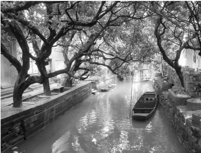
Abbildung 7 und 8: Beide Bilder zeigen das Urban Village Xiaozhou, im Bezirk Haizhu, Guangzhou.