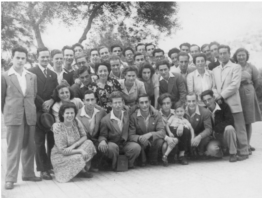
Abb. 6: A group of pioneers who escaped to Spain meeting in Barcelona. Date and photographer unknown.

came from Germany and Austria; a smaller number from countries such as Poland, Czechoslovakia, and the Netherlands.