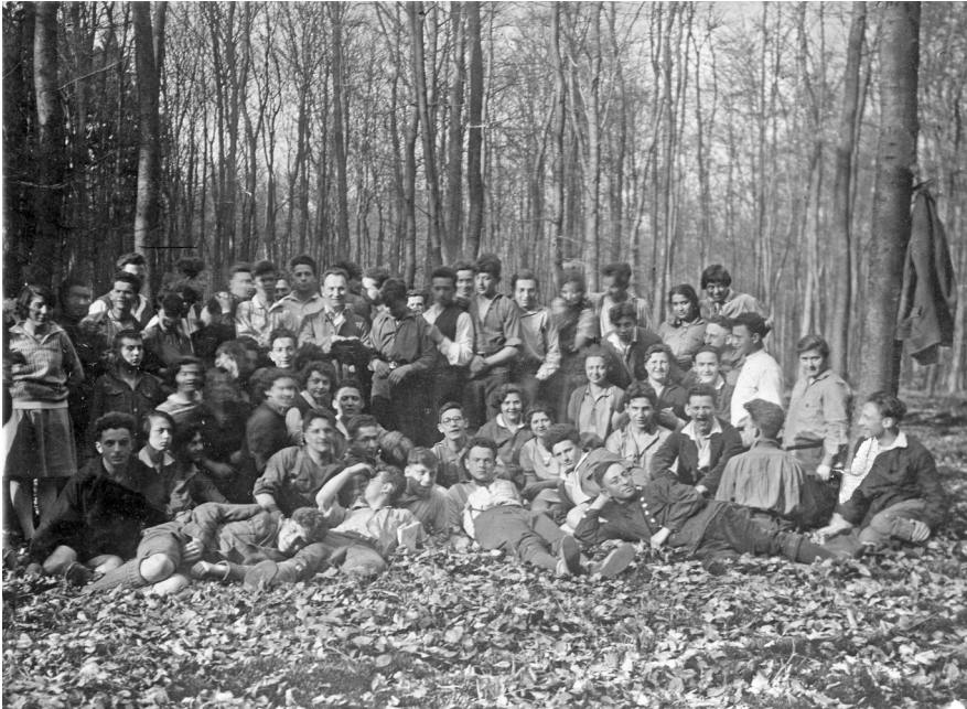
Abb. 1: Der Kibbutz Cherut und Freunde aus dem JJWB/Brit Haolim 1927 im Buchenwald oberhalb von Aerzen, 1