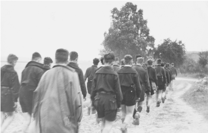
Abb. 3: Sammlung Gert Lippmann, JMB Archiv, 2007/24/2, S. 16.

Wie wurde das Marschieren 1934 visualisiert?