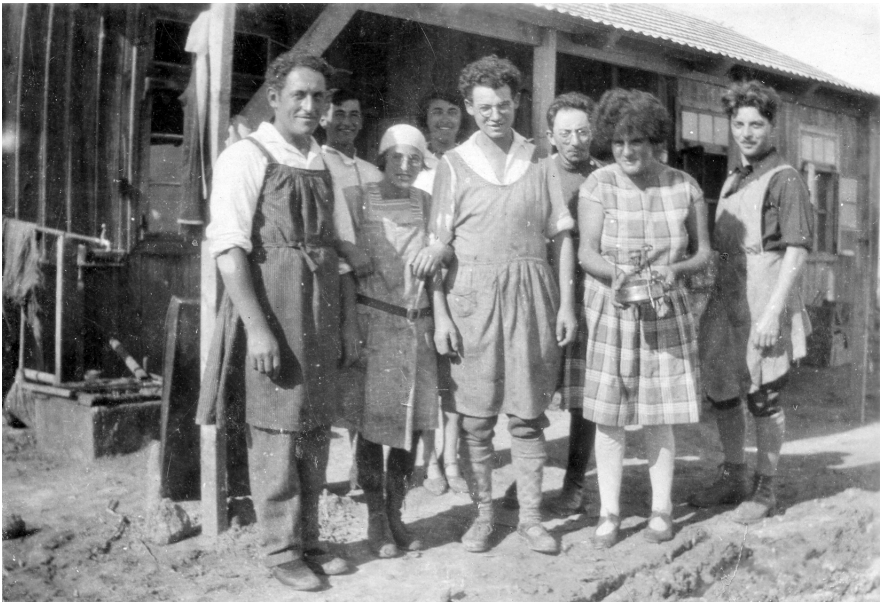
Abb. 4: Anon.: Küchendienst ca. 1930 (Privatalbum Nellenbogen, Archiv Givat Brenner).