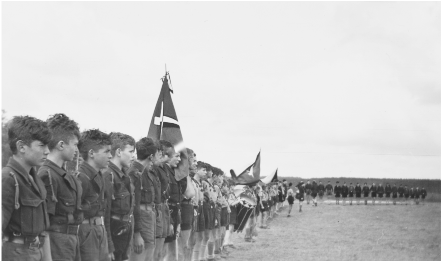
Abb. 1: Sammlung Gert Lippmann, JMB Archiv, 2007/24/2, S. 16.

Wie wurde diese Vision des großen Apells auf dem Reichstreifen des SF visualisiert?