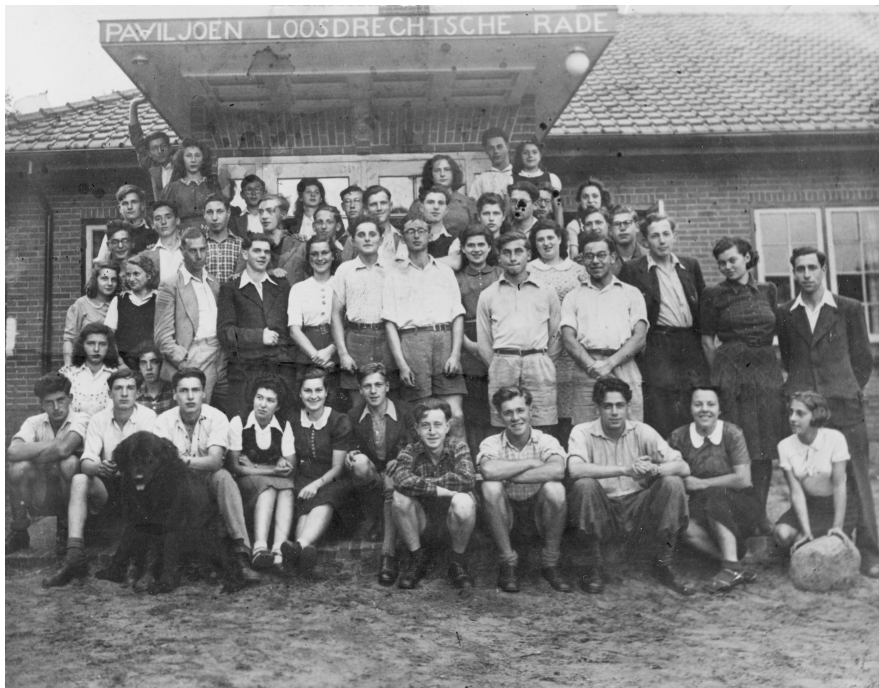
Abb. 1: The Palestine Pioneers of the Paviljoen Loosdrechtsche Raad in the Spring of 1942.

style of the youth movement went their own way, caring little for the Union's opinions. 1