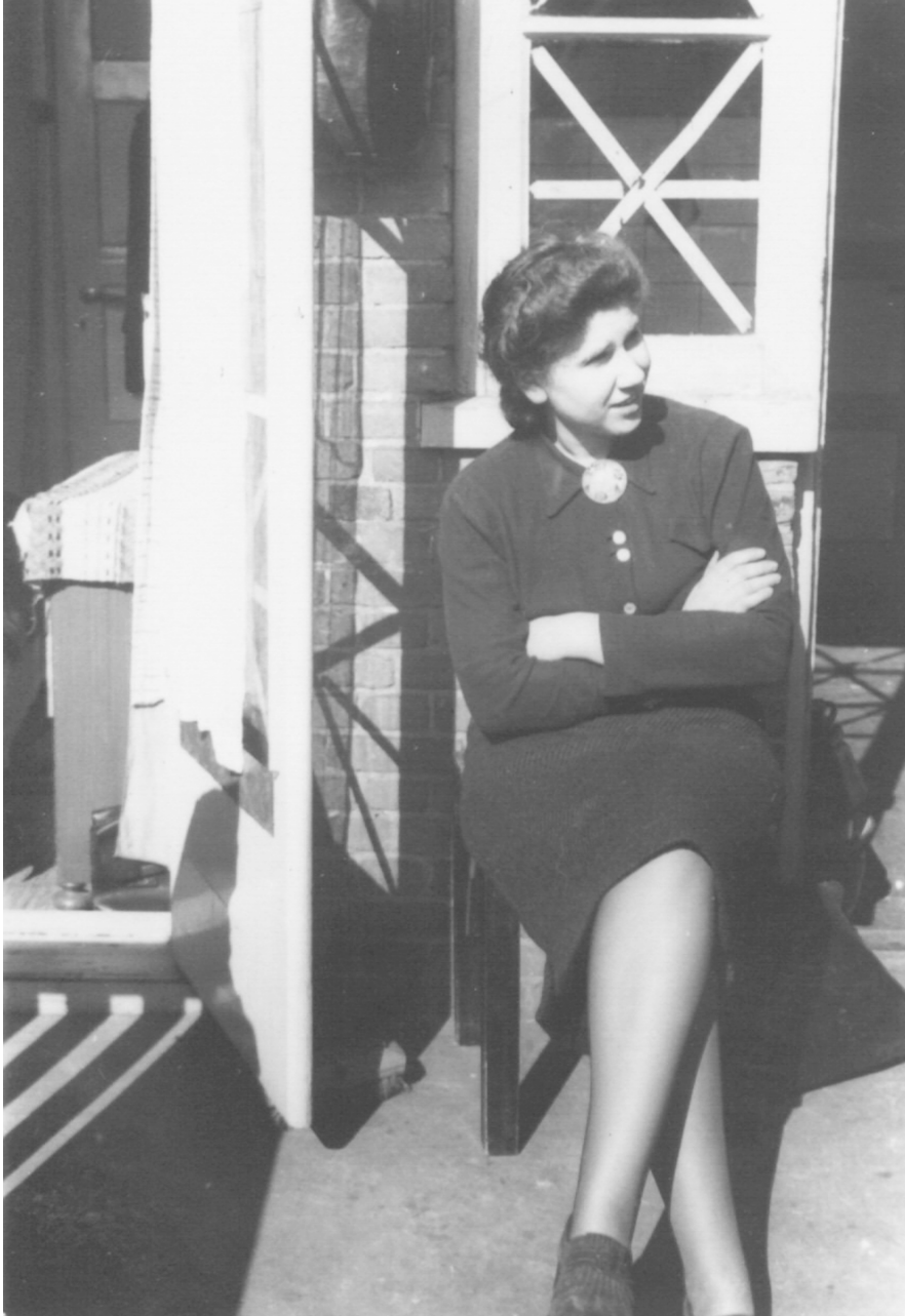
Abb. 5: Lore Durlacher, pioneer and resistance fighter. Date and photographer unknown. Private Collection.