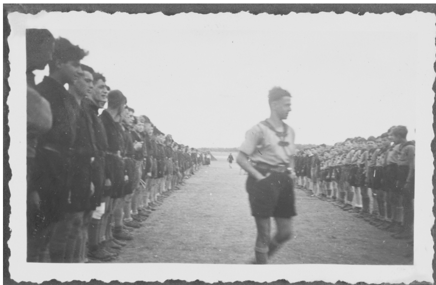
Abb. 6: Sammlung Gert Lippmann, JMB Archiv, 2007/24/2, S. 21.

damit auch einen Gegenentwurf zum Strammstehen schafft. Der Führer erscheint bereits als junger Mann zwischen seinen kindlichen und jugendlichen Zöglingen. Auf diese Weise zeigt das Foto die Bandbreite an Altersunterschieden und hierarchischen Verhältnissen, indem es die Stufen dieser männlichen Gemeinschaft einfängt.