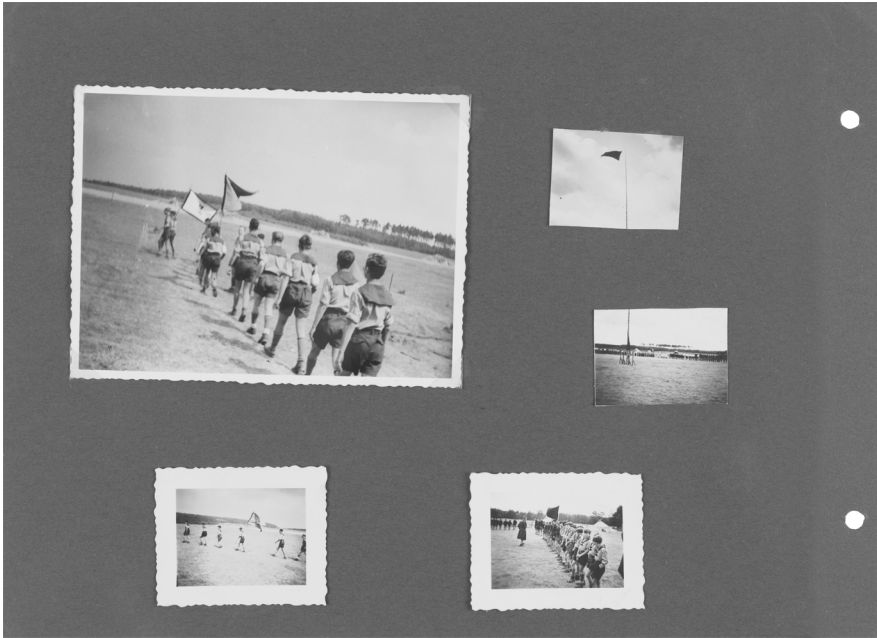
Abb. 4: Sammlung Gert Lippmann, JMB Archiv, 2007/24/2, S. 22.

hinaus. Rechts daneben agiert ein durch Reichswehrmantel, Größe und Statur erkennbar Erwachsener, der wohl im Moment der Aufnahme die Reihen der Mitglieder inspizierte. Die Aufnahme erfasste ihn genau gegenüber der herausragenden schwarzen Fahne. Die beiden kleinen Abzüge rechts außen ergänzen sich und sind ohne Vergrößerung nur schwer zu entschlüsseln. Aus der Entfernung wurde für das untere Foto ein Fahnenmast vor einer langen und mittig geteilten Reihe männlicher und weiblicher Mitglieder aus dem SF in Szene gesetzt. Dass das Ende samt Fahne auch aus der Weite scheinbar nicht durch den Fotografen eingefangen werden konnte, suggeriert dabei eine immense Höhe des Masts. Erst der zweite darüber eingeklebte Abzug ergänzt die Spitze nebst schwarzer Fahne, was für die außerordentliche Bedeutung spricht, die diesem Symbol vom Fotografen und von dem Gestalter des Albums beigemessen wurde. Denkbar ist, dass das fotografierende Mitglied nicht das notwendige technische Material oder die Ausbildung besaß, um diese Weite in einem Foto einzufangen. Die Menschenreihe füllte schließlich den gesamten Bildhorizont und sollte vermutlich visuell der Größe des Lagers entsprechen. Die Albumseite spiegelt dabei die angenommene Relevanz im Selbstbild der Jugendlichen, die damit ihr bündisches Wirken und das große Reichstreffen symbolisch aufluden. Im unteren Foto erscheint außerdem ein Aus-