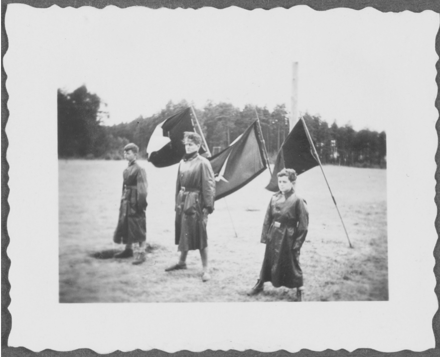
Abb. 2: Sammlung Gert Lippmann, JMB Archiv, 2007/24/2, S. 20.

gleichen Fahnen präsentieren. Im Gegensatz zum größeren gemeinschaftlichen Dienst, der über die Darstellung der Appell-Formation vermittelt werden sollte, transportiert die Fotografie hier individuelle Körpermerkmale und persönliches Engagement der Jungen. Damit wird die Wache als persönlicherer Moment des Dienstes an der Gemeinschaft nachvollziehbar. Die drei SF-Mitglieder versuchten starr ausharrend dem Gemeinschaftssymbol ihre Verbundenheit zu erweisen. Die zeitgenössischen Akteure nahmen ihre Performanz sichtbar ernst. 63 Erkennbar wird in der Zusammenschau von Text und Bild, dass es sich hier um den Versuch handelt, die literarischen Entwürfe in visuelle Selbstbilder zu transformieren. Thematisch ist die Fahnenwache als herausragendes Element dargestellt. Auch lässt sich die Ernsthaftigkeit, mit der die Jugendlichen die ihnen zugeschriebenen Rollen als Wächter der Fahne und Repräsentanten des Bundes annahmen, in Mimik, Blick und Körperspannung erkennen. Doch kann die visuelle Inszenierung aufgrund des