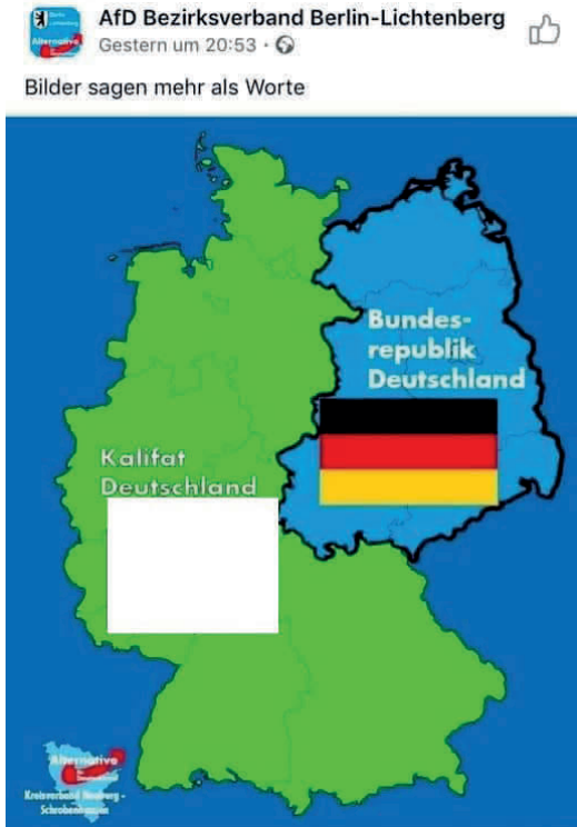
Abbildung 1: Facebook-Post eines AfD Bezirksverbands

Die Erklärung für das regional unterschiedliche Voranschreiten des ‚Großen Austauschs‘ ist aus AfD-Perspektive simpel. Es sei eine Frage von regional unterschiedlichen politischen Einstellungen. Rebecca Pates (2021: 224f.) hat in einem Beitrag zum Narrativ von ‚Umvolkung‘ auf eine grün und blau markierte Deutschlandkarte aufmerksam gemacht, die diesen Punkt illustrieren kann (s. Abbildung 1). 37