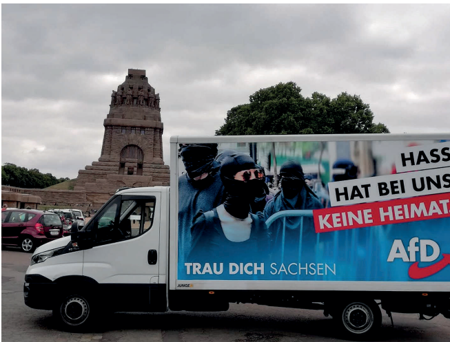
Abbildung 4: Facebook-Beitrag der AfD in Leipzig

Wie ich am Beispiel der ‚inländerfreundlichen‘ Politik im Namen der nationalen Liebe gezeigt habe, betreibt die neurechte Gefühlsgemeinschaft zudem eine Umverteilung von Legitimität entlang von emotionalen Registern. So stehe das rechte Projekt nicht für Hass, sondern für Liebe (s. Kapitel 6). Eine solche emotional codierte moralische Umkehrung lässt sich ebenso eindrücklich an der Klage über die gegen die AfD gerichtete Hass- und Angstpolitik beobachten. Rechte Politik wird oftmals auf das Schüren ‚negativer‘ Emotionen wie Hass und Angst reduziert und genau diese politisch delegitimierende Zuschreibung greifen neurechte Akteur*innen auf und machen sie sich zu nutze. So sagte ein AfD-Politiker, dass es ja immer heiße, die AfD schüre „Hass durch Sprache“, um seinem Publikum daraufhin zu bestätigen, dass dies „Unsinn“ sei (Feldaufenthalt_O7). Vielmehr sieht man sich in der AfD-Gemeinschaft in Gestalt kritischer Labels selbst einer Sprache des Hasses ausgesetzt und insbesondere durch ‚die Antifa‘ als Opfer von politischem Hass: von „Fuck AfD“ Aufklebern bis zu Angriffen auf Parteibüros. „Hass hat bei uns keine Heimat“ plakatierte die AfD in Sachsen gleich doppeldeutig und erklärte damit die ‚hassende Antifa‘ zu Nicht-Deutschen, während sie die AfD und ihre Wähler*innen von jeglichem Hass freisprach (s. Abbildung 4).