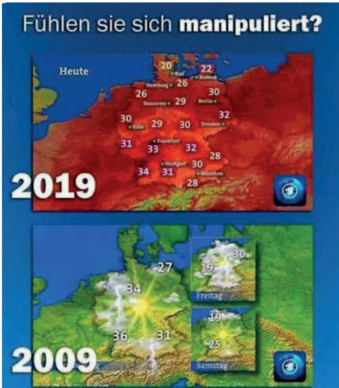
Abbildung 5: durch AfD verbreitetes Meme

Am Ende des Interviews zeigte mir der AfD-Unterstützer Kartz* folgendes Bild im WhatsApp-Status seines Handys (s. Abbildung 5). Er kommentierte, dass man daran mal wieder gut sehen könne, wie uns die Medien heute manipulieren.