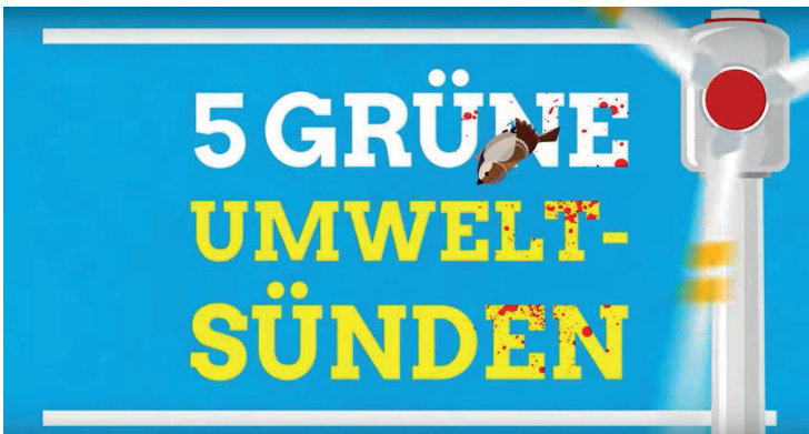
Abbildung 3: Screenshot eines Videos der AfD

Ökologie stellt für die AfD-Gemeinschaft eine affektiv-moralische Ressource dar, um die eigene anti-klimapolitische Position mit dem wohligen Gefühl des wahren Umweltschutzes aufzuladen. Damit einher geht die moralische Diskreditierung und Skandalisierung von Klimaschutzmaßnahmen. Dies zeigt sich eindrücklich mit Blick auf Windkraftanlagen, die im AfD-Kontext wie eine brutale Tötungsmaschinerie der ‚grünen Einheitsparteien‘ dargestellt werden. Das gewaltsame und rücksichtslose Windrad ist die Titel-Story der ‚alternativen Umweltpolitik‘. Es zielt die Frontseite des bereits erwähnten AfD-Flyers (AfD o.J. a), spielt die zentrale Rolle in einem Animationsfilm über „5 grüne Umweltsünden“ (AfD TV 2019) und zieht sich durch die Interviews und Reden bei meiner ethnografischen Forschung. Dabei habe ich einiges über die Gefahren gelernt, die von Windrädern für verschiedene Tierarten ausgehen sollen: etwa Rotorengeräusche, die das Brutverhalten stören oder verunsichernde Schattenwürfe. Windräder haben aber vor allem deshalb das Zeug zur skandalisierenden Cover-Story, weil dadurch Vögel, Insekten und Fledermäuse „[g]eschreddert“ (Feldaufenthalt_O8) würden und diese tödliche Gewalt zudem in gigantischem Ausmaß geschehe.