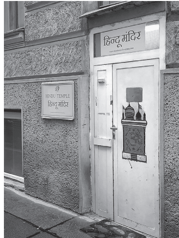
Abbildung 5.2: Die gleiche Tür mit neuem Anstrich, 2016