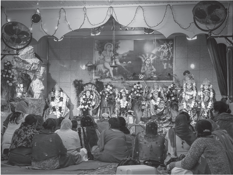
Abbildung 4.5: Die Śivaratri-Feier 2014 im Sanatan Dharam Mandir Sidh Jogi Baba Balaknath

niederschlägt. So frequentieren nicht wenige der Gläubigen, die den Tempel an der Herbststraße besuchen, auch regelmäßig einen der beiden Gurdwaras in Wien (vgl. W14). Der Tempel ist in der Zeit der Erhebung offiziell jeden Samstagabend von 17 bis etwa 21 Uhr geöffnet, einmal im Monat auch am Sonntag. Im Verlaufe des Abends versammeln sich rund 60 bis 80 Personen in dem kleinen Raum, singen gemeinsam Bhajans und feiern Āratī . Auch hier werden stellenweise die gleichen Bhajans gesungen wie im Tempel im Afroasiatischen Institut und jenem in der Lammgasse. Anschließend wird gemeinsam prāsada gegessen. Nebst den regulären Öffnungszeiten treffen sich die Gläubigen auch unter der Woche, um wichtige Feierlichkeiten, beispielsweise zu Śivaratri , zu begehen (vgl. W11). Auch die häufig stattfindenden Nachtwachen, die jagaranas (Nesbitt 2009, S. 163), zu denen auch via Facebook eingeladen wird, sind ein Hinweis auf den Ursprung der hier verfolgten religiösen Praktiken im panjabischen Hinduismus, wie Erndl (1991, S. 339) festhält.