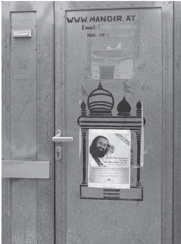
Abbildung 5.1: Eingangstür des Tempelraums der HMA in Wien, 2013