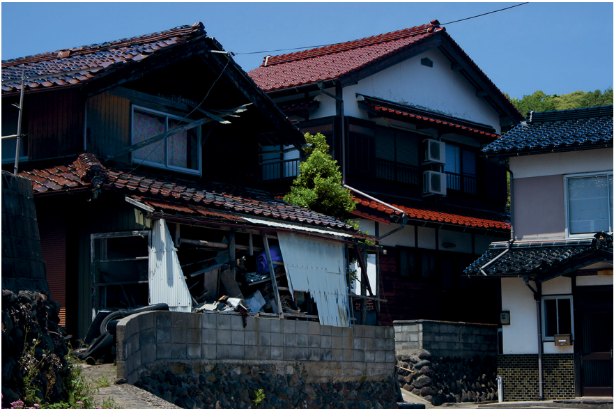
Abb. 2: Verlassenes Haus in Saki, Ama.

gelegenen, noch bewirtschafteten Felder Schäden anrichten können (vgl. Matanle und Rausch 2011: 156–169). Auch in Saki, einem Stadtteil von Ama, in dem ich untergebracht war, prägten viele leere, oft teils zusammengebrochene Häuser das Bild (siehe Abb. 2). Die Abnahme an Lebensqualität durch kommunale Sparmaßnahmen führt wiederum zu weiterer Abwanderung. Matanle und Rausch (2011) bezeichnen dies als „cumulative self-reinforcing pattern of depopulation“ (19). Lokale Wirtschaftsrezession, demographische Schrumpfung sowie Überalterung und die Abnahme an Lebensqualität aufgrund des Abbaus öffentlicher Einrichtungen und harter Infrastruktur beeinflussen und verstärken sich so gegenseitig.