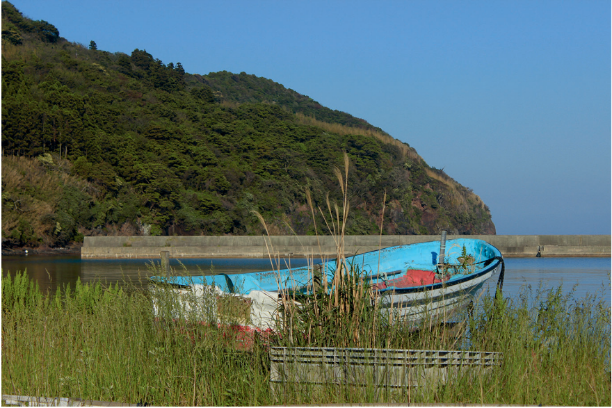
Boot im Hafen von Saki, Ama.