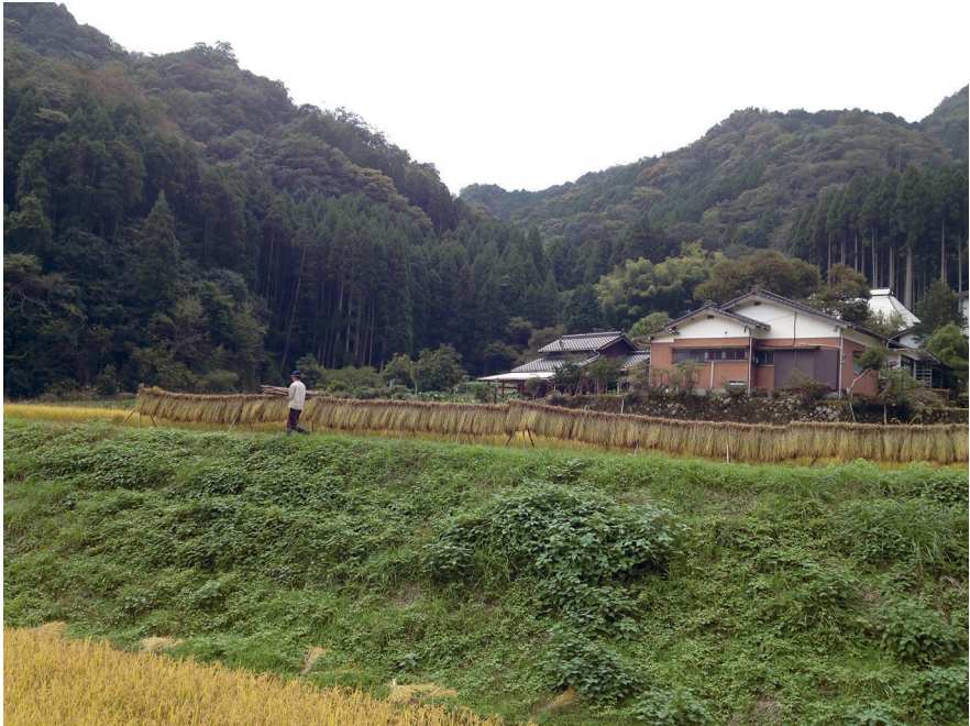
Abb. 6: Reisernte in Yabakei, Nakatsu.

In Yabakei gibt es eine lange Tradition biologischer Landwirtschaft. Die Mitglieder der lokalen landwirtschaftlichen Genossenschaft Shimogō verwenden nach eigener Aussage weder Pestizide noch Kunstdünger (vgl. Shimogō nōkyō: Internet). Dafür ist die Genossenschaft – so berichteten zumindest einige Interviewpartner:innen – auch außerhalb der Gegend bekannt. In Yabakei rekrutierten sich die Interviewten hauptsächlich über meine Bekannte, die selbst vor einigen Jahren aus Kitakyushu dorthin gezogen war. So konnte ich insgesamt sechs Interviews führen. Es handelte sich um einen Freundeskreis von vor allem Paaren und jungen Familien zwischen 30 und Mitte 40, die in den letzten Jahren aus verschiedenen Großstädten dorthin gezogen sind. Anders als die Gruppe in Itoshima – mit der einige aus Yabakei bekannt waren – sind sie jedoch nicht in einer formellen Gruppe organisiert. Bestimmte Themen, wie Anti-Atomkraftbewegung, biologische Landwirtschaft und Erhalt lokaler Forste, spielten auch hier für viele eine wichtige Rolle. Wie bereits erwähnt, ist Yabakei im Rahmen des Diskurses um Revitalisierung zwar weniger prominent als Ama, wurde aber dennoch bereits in Publikationen und Zeitungsartikeln vorgestellt. So waren auch zwei meiner Interviewpartner:innen bereits für ein Magazin, in diesem Fall Turns , interviewt worden.