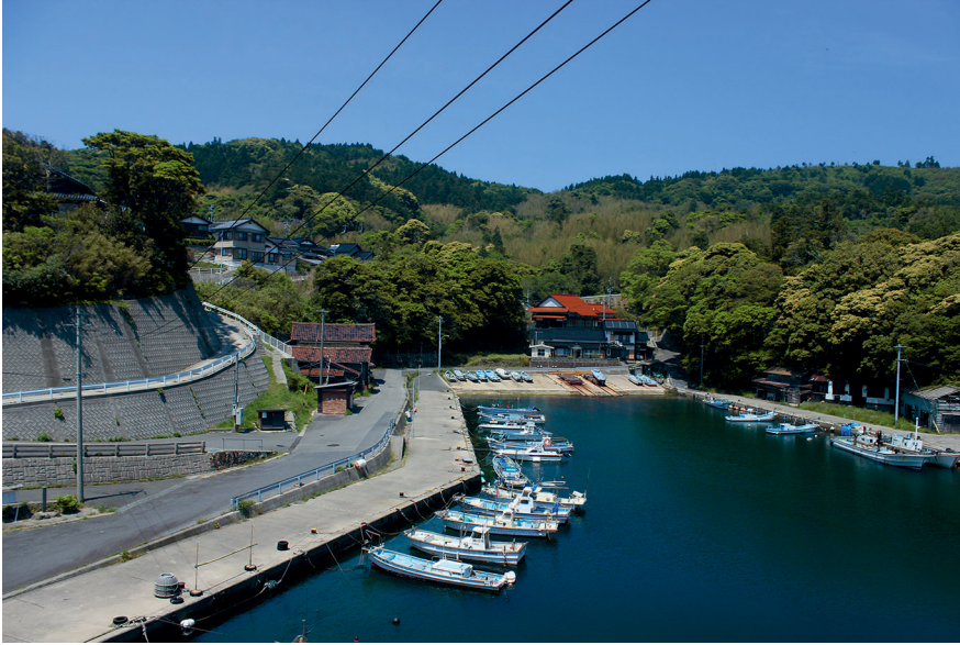
Abb. 4: Blick auf den Hafen von Saki, Ama.

so wird im Artikel deutlich gemacht, ist ein attraktives Ziel für Neuzuzüger:innen. Die Stadt wird als Vorbild für Revitalisierung vorgestellt.