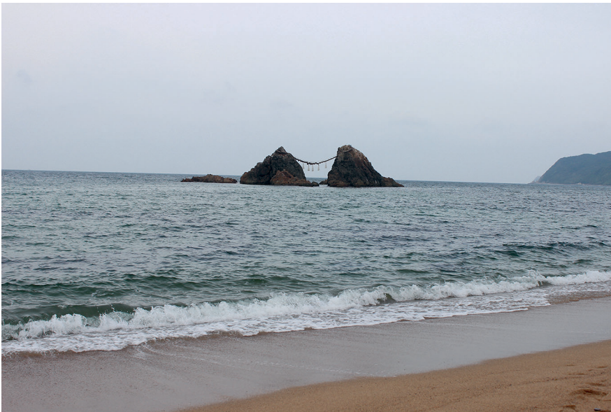
Abb. 5: Am Strand von Itoshima.

Die Stadt Itoshima umfasst seit der Zusammenlegung verschiedener Gemeinden im Jahr 2010 eine Bevölkerung von etwa 96.000 (vgl. Itoshima-shi 2018). Durch die Nähe zur Großstadt Fukuoka, die innerhalb von etwa 30 Minuten erreichbar ist, kann man, anders als im Fall von Ama, kaum von einer abgelegenen Gegend sprechen. Die Wohngebiete abseits des Stadtzentrums bzw. der Bahnhöfe sind jedoch nicht mit dem öffentlichen Nahverkehr zu erreichen, die Landschaft ist von Reisfeldern und Hügeln geprägt und recht zersiedelt. Itoshima ist aufgrund seiner Lage am Meer (Abb. 5), das unter anderem Surfen ermöglicht, besonders in den Sommermonaten ein beliebtes Ausflugsziel.