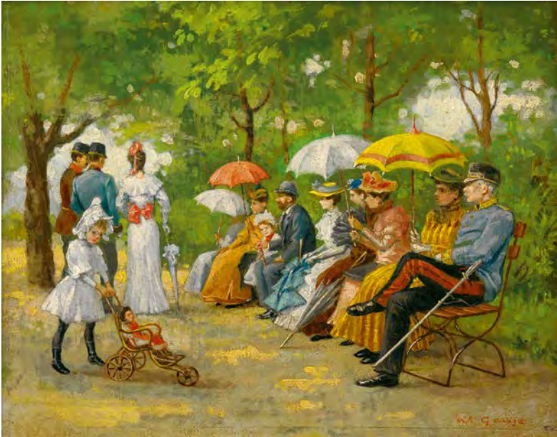
Abb. 10 Wilhelm Gause, Die Lästerallee im Wiener Prater (um 1895)

in der Stadt im Umgang mit den modernen raumzeitlichen Gegebenheiten von Saltens als zentral erkannt wurden. Im Folgenden werden die lebensweltlichen Grundlagen und Erfahrungsdimensionen von Schau in der Moderne und angesichts urbaner Topografien untersucht – zunächst gesamtgesellschaftlich, schließlich mit Fokus auf Dimensionen für die jüdische Bevölkerung.