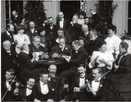
Abb. 02 Karl Lueger kartenspielend in Lovran (1908)

Lueger, der vor allem eine katholische kleinbürgerliche Wählerschicht ansprach, legitiimierte sich über den Katholizismus und stützte sein Programm auf den von ihm mit genährten Antisemitismus. Nach der viermaligen Weigerung Kaiser Franz Josephs, Lueger trotz Wahlerfolgs zum Bürgermeister zu küren, erfolgte die Ernennung 1897 schließlich auch dank päpstlicher Bitte. Als das Filmporträt 1908 entstand, war es Lueger längst gelungen, sich als antisemitischer Redner wie als sorgender Stadtvater zu etablieren. 3 Im Film präsentierte er sich dank des Kartenspiels als geselliger Kommunalpolitiker und staatstragend in den Kronländern der Monarchie. Daneben pflegte er seinen Ruf insbesondere durch seine öffentlichen Auftritte und politischen Agenden, etwa durch Großprojekte in der sozialen Fürsorge oder der Gas- und Stromversorgung (1899–1902), die ihm bald den Beinamen »Monarch von Wien« 4 einbrachten.