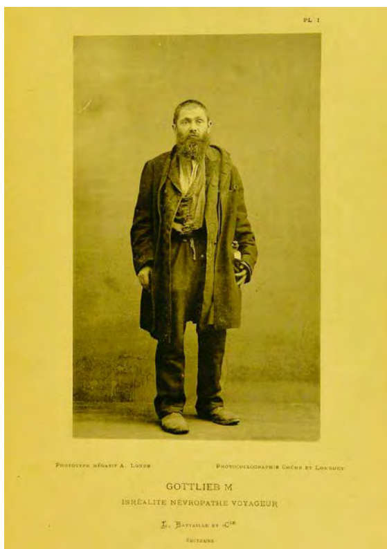
Abb. 07 Gottlieb M. Fotografie aus der Sammlung von Henry Meige (1893)

kehrte vor allem die Gestikulation, die im Lauf der Frühen Neuzeit marginalisiert und aus dem sozial akzeptierten Verhaltensrepertoire verdrängt worden war, 192 als vorgebliches Kennzeichen eines jüdischen Körpers zurück in die gesellschaftliche wie wissenschaftliche Betrachtung.