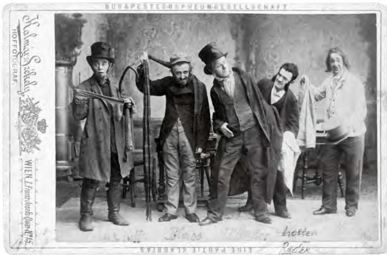
Abb. 06 Die Klabriaspartie der Budapester Orpheumgesellschaft (1890)

Figuren waren Teil dieser Tradition und übernahmen comödiantische Funktionen. Beide Figuren waren Außenseiter, die mittels Sprache oder Habitus als »fremd« markiert wurden. Oft besetzte ein Schauspieler beide Typenfächer, die des Böhmen und des Juden – was nahelag, waren die Fächer doch konzeptionell verwandt und beim Publikum aufgrund ihrer comödiantischen Potenziale gleichermaßen äußerst beliebt. 149 Als »Lachfiguren« wurde jedoch nicht nur mit ihnen, sondern auch über sie gelacht. 150