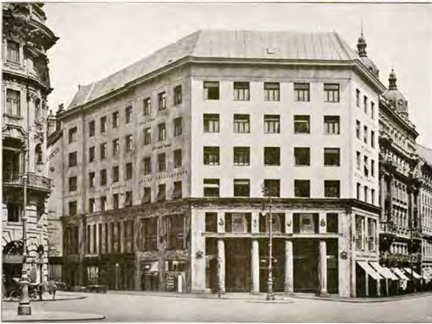
WOHN- UND GESCHÄFTSHAUS IN WIEN, L. HERRENGASSE 2. Architekt: Adolf Loos in Wien.