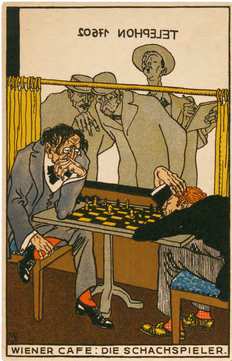
Abb. 05 Moriz Jung, Wiener Café: Die Schachspieler (1911)