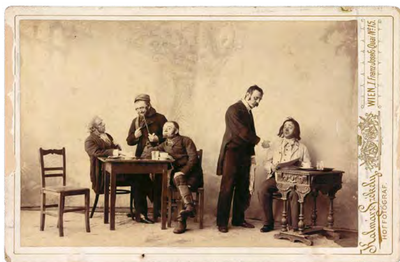
Abb. 03 Szenenfoto der Klabriaspertie (um 1890)

Dass die Inszenierung mehr auf schauspielerische Fertigkeiten fokussierte und auf eine aufwendige Bühnenausstattung verzichtete, deuten auch die überlieferten Drucke und Fotografien an, in denen das Kaffeehaus der Theaterbühne mit einem Tisch und vier bis fünf Stühlen einfach ausgestattet ist (Abb. 03). Auch die Manuskripte sahen keine Verwandlungen vor, was einem Erlass zur Theaterverordnung von 1867 entsprach, der den Singspielhallen den Einsatz von Theatermaschinerien untersagte.