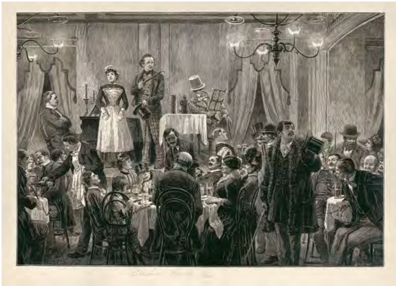
Abb. 04 Wirtshausszene, inspiriert von der Volkssängergesellschaft Kampf (1888)

Figur für das Gelingen und Misslingen einer solchen Kommunikation entscheidend. 93