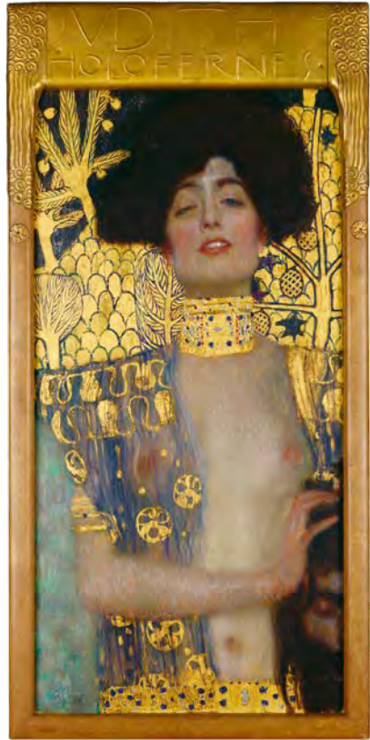
Abb. 13 Gustav Klimt, Judith I (1901)

Was Altmann durch den Tanz anstrebte – die künstlerische Entfaltung der eigenen Persönlichkeit –, vollzog d'Ora fotografisch. Zu ihrer ersten eigenen Ausstellung 1909 notierte sie: »Ich berauschte mich geradezu an meinem Aufstieg! An meinem eigenen ›ICH!‹« 115 1910 bewertete die Zeitschrift Deutsche Kunst und Dekoration d'Oras Fotos als das Gegenteil des »Maskenhaften, Gezwungenen der berüchtigten Berufsphotographen-Aufnahmen«. 1915 beschrieb das Wiener Salonblatt die Fotografin als Meisterin beim »Röntgenisieren [...] der Seele«. 116 Ähnliches befand auch Elsie Altmann über ihre Stammfotografin. In einer Notiz erinnerte sie sich an zwei große Fotograf*innen in Wien, Setzer und d'Ora, und kontrastierte beide: »Setzer war ein sehr guter Photograph, aber er war zu trocken, zu ernst – seine schönsten Porträts waren solche von eleganten, bedeutenden Männern«. 117 Während Adolf Loos Stammkunde bei Setzer war, bemängelte Altmann den fehlenden Zauber der Bilder