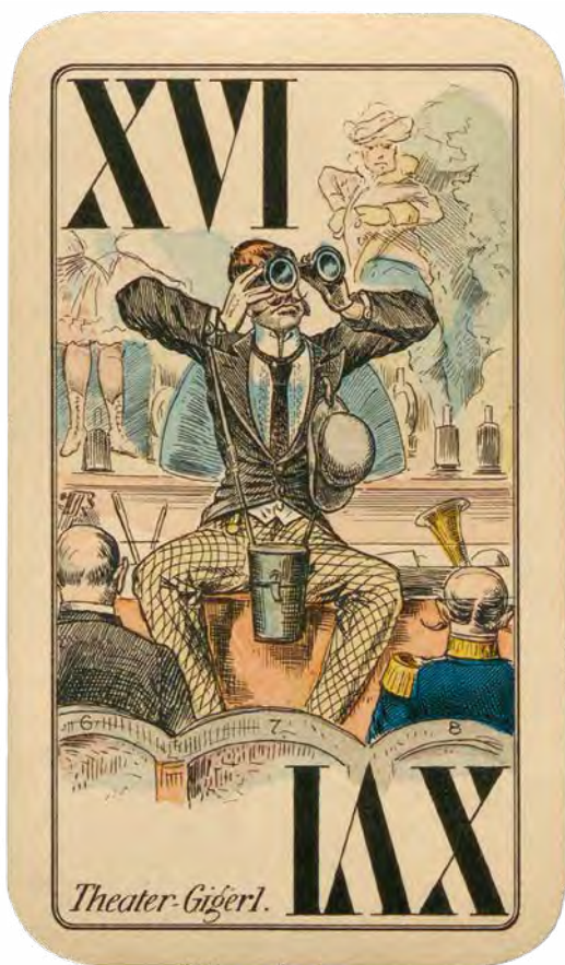
Abb. 08 Spielkarte des Gigerl-Tarocks (um 1890)