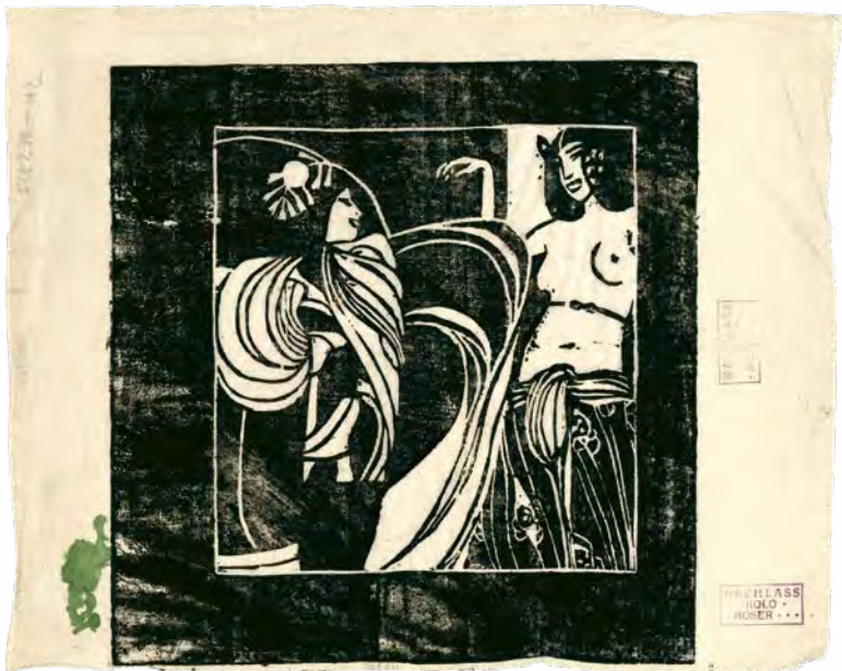
Abb. 14 Koloman Moser, Zwei tanzende Frauen (1902)

aber keine Hinweise mehr auf ein jüdisches Milieu enthielt, etabliert den Tanz bereits 1901 als Mittel der (körperlichen) Transformation. 153 Im November 1906 zeigte er sich nach einem Auftritt Ruth St. Denis' beeindruckt von ihrem Tanz und ein Jahr später publizierte er – im Umfeld der Begegnung mit Grete Wiesenthal – seinen Dialog Furcht . Darin treten die Tänzerinnen Laidion und Hymnis in Dialog über zwei Arten des Tanzens. Während Hymnis den klassischen Tanz hochhält, berichtet Laidion vom befreienden, gottgleichen Tanz einer Mädchengruppe auf einer »südlichen Insel«. Sie beklagt die Selbstentfremdung moderner Kultur und erhofft sich im Zugriff auf den rituellen Fruchtbarkeitstanz die rückhaltlose Transzendierung des Körpers im Augenblick, ein völlig gegenwärtiges, unmittelbares Erleben leibhaftigen Seins: »Und nichts auf der Insel entzieht sich der Gewalt der Tanzenden; diese sind in diesem Augenblick so stark wie die Götter [...]. Sie sind die Gebärenden und