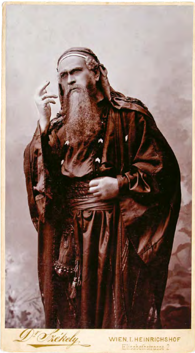
Abb. 01 Adolf von Sonnenthal als Nathan der Weise (1895)