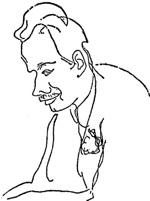
Vladimir Majakovskin omakuva.

Runoilijana tämä Pilvi housuissa Majakovski silti parhaiten tunnetaan. Lahtokohtaa kuvaa Majakovskin oma huudahdus: "Näin