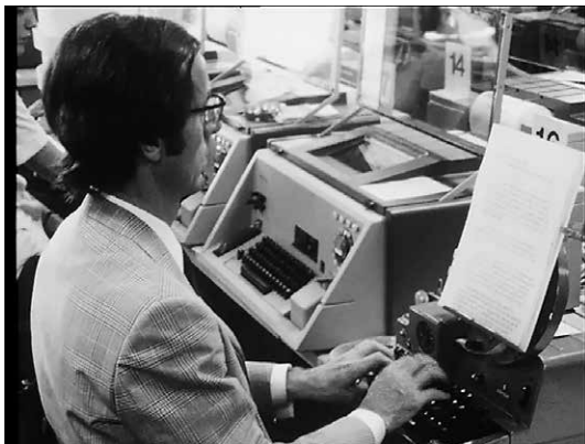
ETYK siirsi maailman katseen Suomeen heinä-elokuussa 1975. Ylen tv-uutiset esitteli 29.7.1975 Suomeen ympäri maailman saapuneita toimittajia sekä heidän käyttöönsä tarjottuja moderneja työtiloja ja -välineitä.

vasta vuonna 1983. 316 Samassa uutislähetyksessä on jo nähty presidentti Urho Kekkonen, harvinaisesti värifilmillä, kulkemassa Helsingin rautatieasemalla Neuvostoliiton kommunistisen puolueen pääsihteerin Leonid Brežnevin ja monien muiden ulkomaisten arvovieraiden kanssa. Muu lähetys on mustavalkoinen. Pitkässä insertissä esitellään myös sitä, kuinka sadat ulkomaiset toimittajat ovat kerääntyneet Helsinkiin ja saaneet käyttöönsä erittäin nykyaikaiset valmiudet raportoida kokouksen annista ympäri maailman. Lähes koko uutislähetys on omistettu vain ETY-huippukokoukselle, joka teki heinä–elokuun vaihteessa 1975 Helsingistä hetkeksi maailman keskipisteen. 317