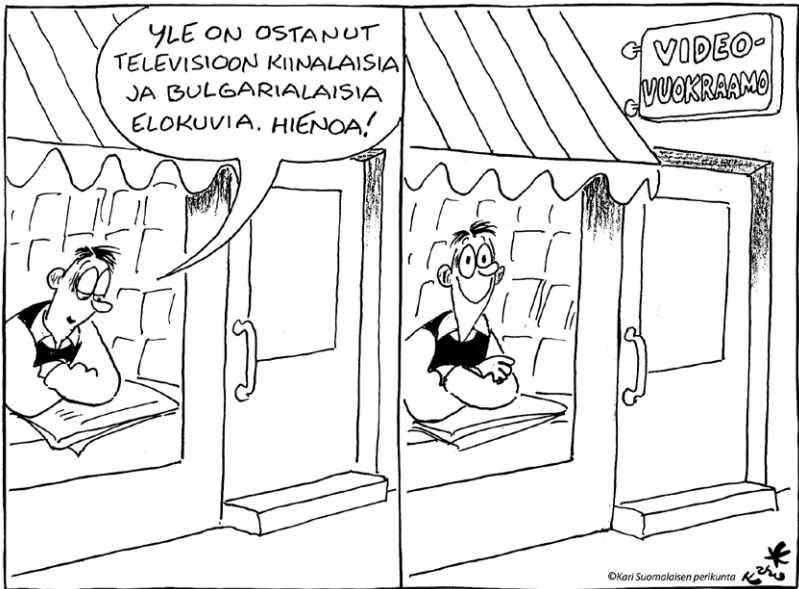
Kari Suomalainen näki Ylen elokuvahankinnat Kiinasta ja Bulgariasta vuokra-videoyrittäjän silmin. Helsingin Sanomat 5.10.1984.

kuva, romanttinen pastoraali Tarina Chun Hyanista esitettiin televisiossa keväällä 1983. 799 Vaikuttimet elokuvien tarjoamiseen ovat oletettavasti olleet paitsi kulttuuri- myös kauppapoliittisia. Taloudellisiin vaikeuksiin ajautunut Pohjois-Korea etsi 1980-luvun alussa kansainvälistä rahoitusta ja kauppakumppaneita sotilaallisesti liittoutumattomien Suomen, Ruotsin ja Itävallan suunnasta. 800 Korean kaupallisten intressien virittämästä televisiodiplomatiasta liittoutumattomaan Pohjolaan todistaa se, että pohjoiskorealaista elokuvaa nähtiin samaan aikaan myös Ruotsin televisiossa.