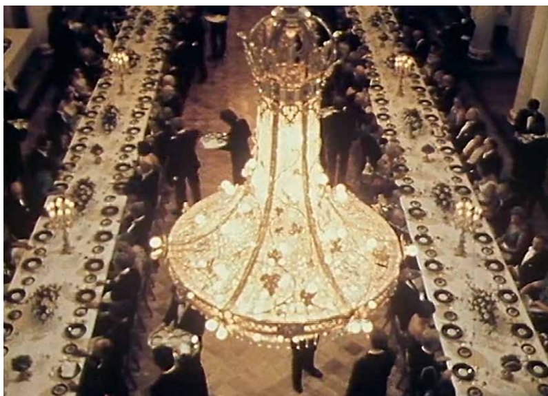
Maan äidit: Sylvi Kekkonen tasapainoili Kekkosen persoonan esittämisen ja presidentillisen loiston visuaalisten nautintojen välimaastossa. Maan äidit, osa 1 "Sylvi Kekkonen" 6.12.1973. MTV Oy:n kokoelma, Kansallinen audiovisuaalinen instituutti KAVI.