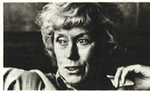
ca 22.40-22.45 TV-NYTT