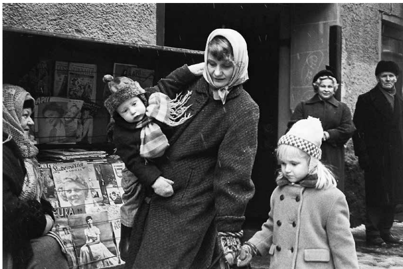
Elämänmeno (Åke Lindman, TV1 1978) teki Kalliosta kulttuurisen ja kansallisen muistin sijaa eurooppalaisen retroelokuvan ja pukudraaman hengessä.