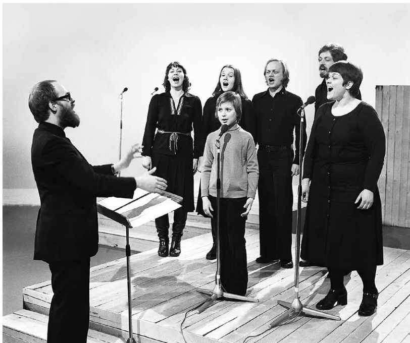
Kaj Chydenius johtaa säveltämäänsä kantaattia Rauhan äiti , esiintyjinä muun muassa Agit Prop -kvartetti ja Kaisa Korhonen. Ohjelma sijoitettiin vappuohjelmistoon.

olla erilaisia vastauksia. Vaikutelmaa siitä, että televisio liitti työväenliikkeen historiaan, saattoi vahvistaa se, että 1980-luvun alkupuolella osa työväenaaatetta käsitelleistä vappuohjelmista oli uusintoja. 520