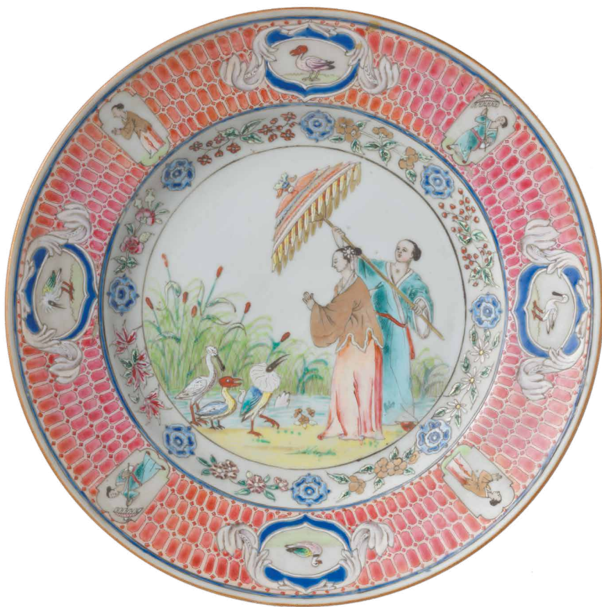
Chinees-porseleinen bord met de Parasoldames in emailkleuren, circa 1737, diam. 226 mm. Amsterdam, Rijksmuseum, AK-RBK-15939-K

personeel, noteerde de Zweedse astronoom Bengt Ferrner (1724-1802) vol bewondering in zijn dagboek na een diner op 21 maart ten huize van Thomas Hope. Hij was echter verbijsterd door het dédain waarmee Hope over de armen sprak, waaruit Ferrner de harde conclusie trok 'dat arm en schelm in dezen kring synoniemen zijn, met dit onderscheid evenwel, dat schelm niet voor zoo onteerend werd gehouden als arm of behoeftig. Zoo spreken de rijken!' 25 Het hoeft dus niet te verbazen dat de Hope's nooit een tweede maal tot diaken zijn gekozen.