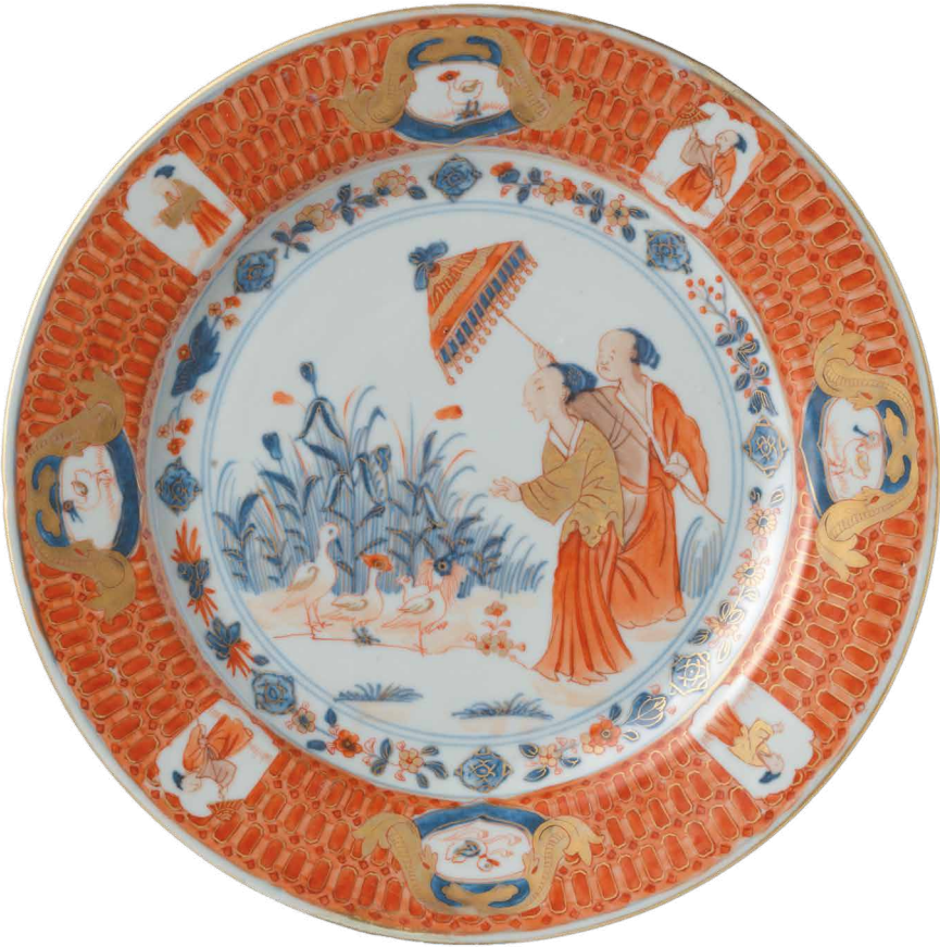
Chinees-porseleinen bord met de Parasoldames in het Imari-palet, circa 1750-1774, diam. 232 mm, Amsterdam, Rijksmuseum, AK-NM-13677

Als representant van opperbewindhebber Willem IV in de WIC had Thomas Hope zich actief ingezet voor de WIC-belangen in het slavernijsysteem. 26 In dienst van de VOC droeg hij bij aan de instandhouding van de slavernij in Nederlands-Indië, die niet minder omvangrijk was. In 1766 bijvoorbeeld waren 8.974 van de 15.180 inwoners van Batavia slaafgemaakt. 27 In mijn artikel over doopsgezinden en het