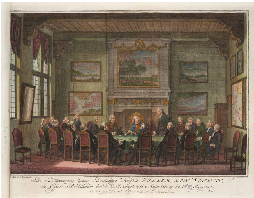
Simon Fokke, De Zittingneming zyner Doorluchtige Hoogheid, WILLEM, DEER VYFDE; als Opper-Bewinthebber ... Pmo. Juny, 1768. Prent, 256 x 372 mm, 1771-1772. Amsterdam, Allard Pierson, OTM: OF 66-14