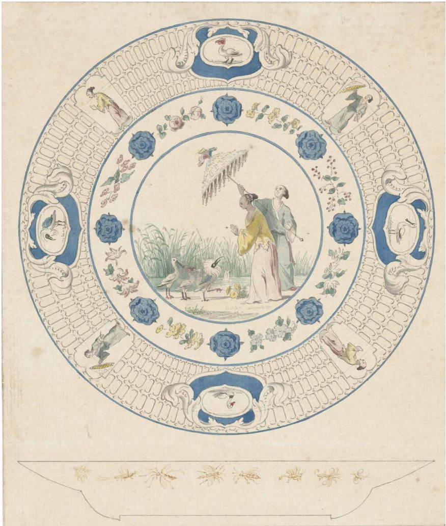
Cornelis Pronk, Ontwerptekening voor een bord , 1734, waterverf, 19 x 16 cm. Amsterdam, Rijksmuseum, RP-T-1967-18