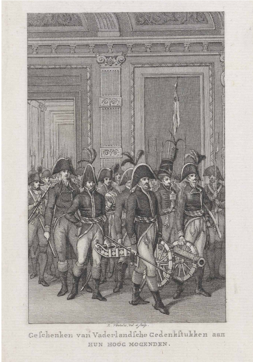
Reinier Vinkeles, Overdracht door de Fransen van historische stukken uit stadhouderlijke collectie aan de Staten-Generaal, 1795. Prent, 202 x 116 mm, 1803. Amsterdam, Rijksmuseum, RP-P-OB-86.127